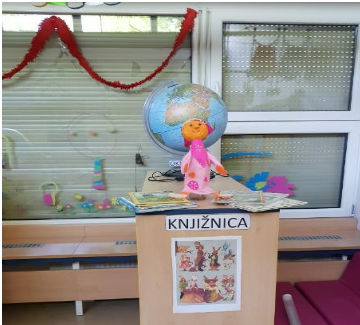
Slika 4: Knjižni kotichek

prostoru komunicira z otroki, ki imajo težave pri govoru in jih z različnimi pripomočki spodbuja, da z uporabo lutke čim bolj razvijajo komunikacijske sposobnosti (npr. berejo pravljici Pajacek in punčka in Rdeča kapica).