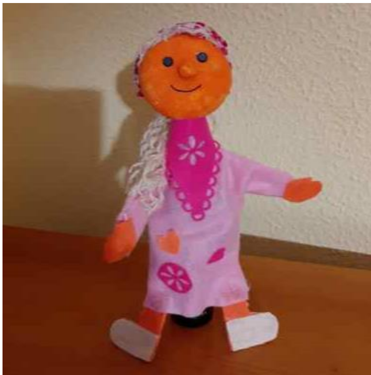
Slika 5: Ročno izdelana lutka

Ročno lutko smo izdelali po postopku, predstavljenem na sliki 1, v teoretičnem podpoglavju 2.1. Izdelano ročno lutko za uporabo v dejavnostih naše raziskave predstavljamo na sliki 5.