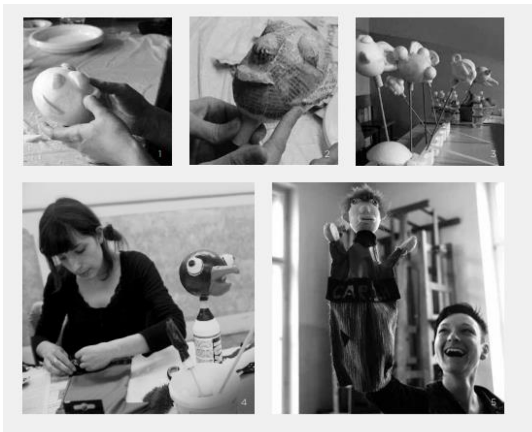
Slika 1: Postopek izdelave ročne lutke (Brezničar, 2014)

Kot prikazuje slika 1, je treba v postopku izdelave ročne lutke najprej oblikovati glavo in roke, tako da z nožem obrežemo primerno velik kos stiropora, ki ga oblikujemo s pomočjo brusnega papirja. Za sestavljanje uporabimo lepilo, ki stiropora ne topi. Nato lutko utrjujemo s časopisnim papirjem. Sledi poslikava z barvitimi barvami in za končni izdelek lutke skrojimo oblekico v obliki črke T ter jo dodatno likovno obdelamo s šivanjem in lepljenjem (Brezničar, 2014).