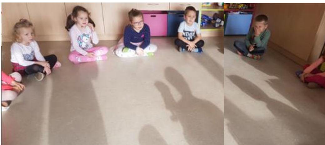
Slika 6: Priprava otrok na prihod lutke

Prihod in predstavitev lutke smo izvedli v okviru vsakodnevnih dejavnosti otrok v vrtcu. Po zajtrku je potekala prosta igra, nato so otroci začeli pospravljati igrače, in ko so zaključili, so zapustili igralnico, da smo lahko pripravili prostor za prihod in predstavitev lutke. Nato smo povabili otroke v igralnico, kjer smo se prijeli za roke, upihnili krog in sedli s prekrizanimi nogami na tla (slika 6).