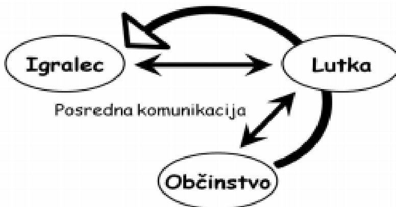
Slika 2: Shema komunikacije (Korošec, 2019, str. 40)

Posredno obliko komunikacije preko lutke, ki je lahko individualna ali skupinska komunikacija med igralcem, v našem primeru vzgojiteljem v vrtcu in občinstvom (to je v vrtcu otrok ali skupina otrok), predstavljamo na sliki 2.