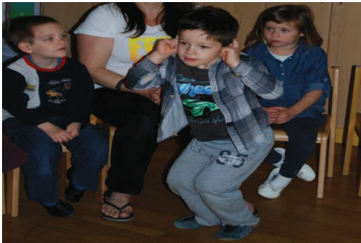
Slika 18: Ponazoritev gibanja zajca

Večina otrok ni imela težav z izražanjem s kretnjami in gibi, prav tako so hitro ugotovili, kaj je njihov prijatelj pokazal.