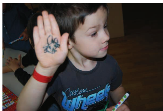
Slika 30: Zajec