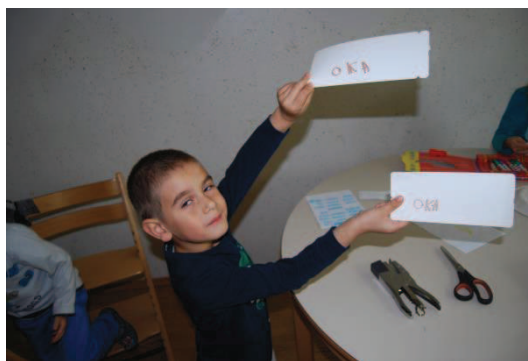
Slika 28: Vabila oz. vstopnice

Vsak izmed njih, se je glede na vlogo odločil, katero telesno lutko bo animiral. Uporabili in izdelali so vse telesne lutke, ki so jih v projektu spoznali.