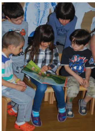
Slika 22: Pripovedovalka