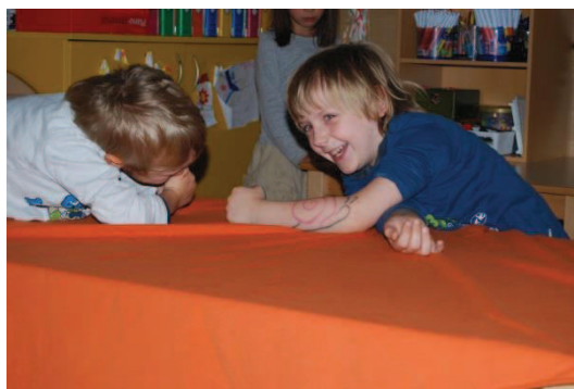
Slika 3: Lutka na komolcu

Obraz, polža, račko si lahko narišemo tudi na komolec, za lažjo izdelavo naj si otroci med seboj pomagajo. S takim načinom sodelovanja, se med njimi vzpostavi bližina, predvsem pa gradijo na medsebojnem zaupanju. Z lutko na komolcu lahko zaigramo zanimive prizore oz. predstave saj nam le-ta omogoča, da ga obrnemo in tako se naša lutka z lahkoto uleže ali obrne na glavo. Z animacijo te lutke razvijamo koordinacijo, gibljivost, krepimo mišice rok hkrati pa dodobra razgibamo naš komolec in ramo.