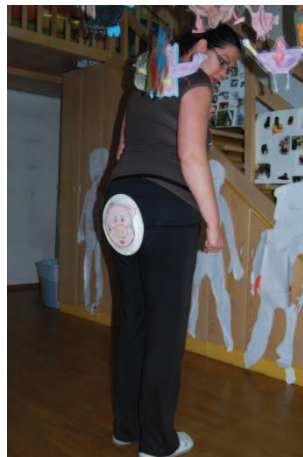
Slika 7: Lutka – maska na zadnjici