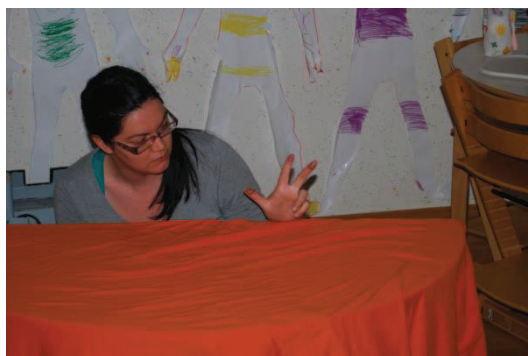
Slika 1: Lutke na prstih

Lutke na prstih so »nadgradnja« prstnim igram, v obeh primerih so prsti glavni akterji katere animiramo. Tu si lutke ne nataknemo na prst, le-tem dodamo predmet (očala, kroglico, blago) ali samo narišemo oči in usta. Ostali prsti lahko postanejo del telesa, lahko pa se osredotočimo na en prst – ena lutka. Pri animaciji se razgibajo sklepi prstov in zapestja. Razvija se fina motorika in obvladovanje gibanja prstov na nenavadne načine.