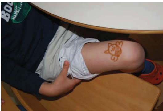
Slika 33: Očka Sovir