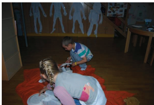
Slika 25: Spontana igra