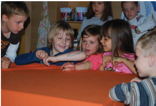
Slika 16: Lutke izdelane na levi roki

Drugo predstavo so pripravili otroci, ki so imeli lutke narisane na desni roki.