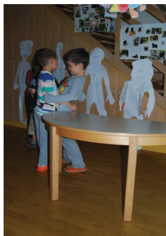
Slika 23: Volk požre prašička

Po določenem času je deklica (pet let, šest mesecev) dala pobudo za izdelavo lutk ter k sodelovanju povabila dečka (pet let, dva meseca) in deklico (pet let). Skupaj so načrtovali in izvedli predstavo, za katero so uporabili tri, njim zelo dobro poznana literarna besedila, Trije prašički, Sovica Oka in Mojca Pokrajculja.