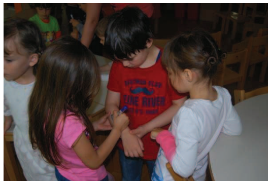
Slika 15: Medsebojno sodelovanje pri izdelavi lutk na komolcu