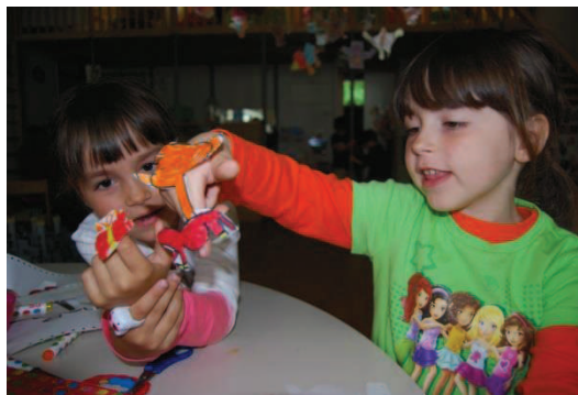
Slika 13: Lutke na prstih