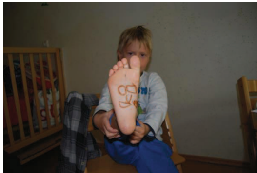
Slika 5: Lutka na podplatu

Na podlagi izkušnje lahko ugotovimo kako zanimiv način komunikacije in čudovito izrazno sredstvo so naša stopala. Animacija lutke na podplatu je zelo zahtevna, povezana je z ustrezno lego celega telesa. Med animacijo le-te moramo ležati oz sedeti, kajti v nasprotnem primeru se lutke ne vidi in kot pravi Jelena Sitar (2012) je tudi zabavna in dobra vaja za trebušne mišice. Tudi pri teh lutkah (kot pri lutki na kolenu) krepimo občutek za ravnotežje in posebne obrate noge s premiki v kolenih, gležnjih in kolkah (Majaron, 2000).