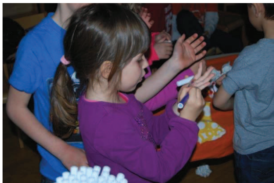
Slika 8: Izdelava lutk na dlani

besedilo. Samostojno so si razdelili vloge. Določili so dva igralca in štiri pomočnike, ki so iz papirja naredili sneg in uprizorili sneženje. V glavnih vlogah sta nastopila Šalček in Rokavička, ki ju je prekril sneg in se nista nikoli več vrnila.