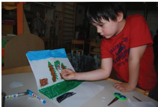
Slika 12: Prstno gledališče