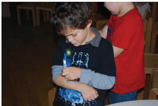
Slika 14: Izdelava lutke na komolcu

Otroci so navdušeno risali lutke. Narisali so še zelenjavni vrt, skalo in avtomobil. Največ lutk so narisali na komolcih in dlaneh.