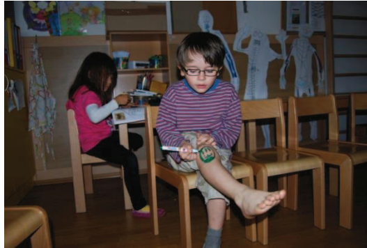
Slika 4: Lutka na kolenu