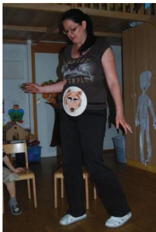
Slika 6: Lutka-maska na trebuhu

Vse te malce nenavadne lutke, ki jih narišemo na kožo, lahko nadomestimo z masko, ki jo nosimo na različnih delih telesa. Sami smo masko uporabili pri lutki na trebuhu in lutki na zadnjici. Vsaka izmed njiju zahteva drugačen način gibanja, ki se mu podredijo telesno težišče, roke in glava. Z animacijo lutke na zadnjici urimo predvsem orientacijo v prostoru, saj je gibanje »obratno« kot to počnemo običajno. Kar je bilo naprej je sedaj nazaj.