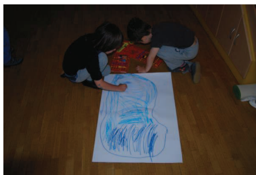
Slika 27: Izdelava scene II. del

Otroci so predlagali, da na predstavo povabimo prijatelje iz sosednje skupine. Izdelali so vabilo in vstopnice, kar predstavlja del čarobnosti, ki je pomemben element lutkovnega gledališča.