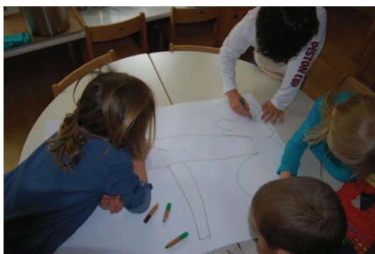
Slika 26: Izdelava scene I. del

Vse dejavnosti, kot so izdelava scene, lutk in vstopnic, so otroci načrtovali in izvedli samostojno. Naša vloga je bila, da smo zagotovili material in sredstva, ki so jih potrebovali. Načrtovali so sceno in se pri izdelavi samostojno razdelili v dve skupini, od katerih je vsaka izdelala en del.