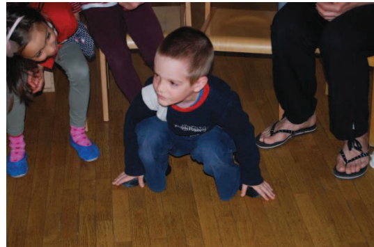
Slika 19: Ponazoritev gibanja rakovice