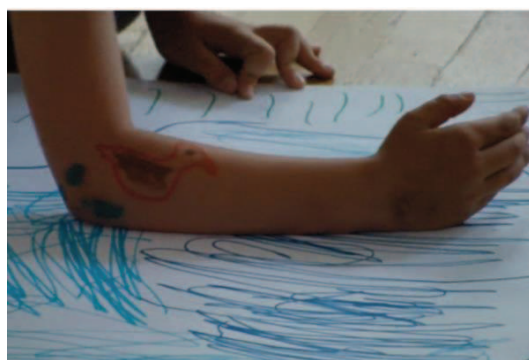
Slika 32: Račka