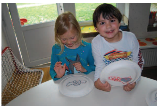
Slika 31: Sestrica Sovice Oke in Lisica