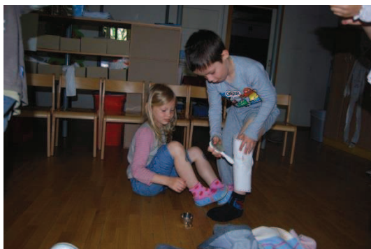
Slika 20: Animacija lutk na kolenu