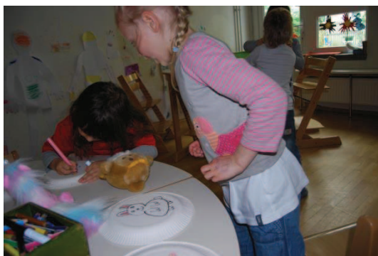
Slika 24: Izdelava lutk – mask

Po določenem času je deklica (pet let, šest mesecev) dala pobudo za izdelavo lutk ter k sodelovanju povabila dečka (pet let, dva meseca) in deklico (pet let). Skupaj so načrtovali in izvedli predstavo, za katero so uporabili tri, njim zelo dobro poznana literarna besedila, Trije prašički, Sovica Oka in Mojca Pokrajculja.