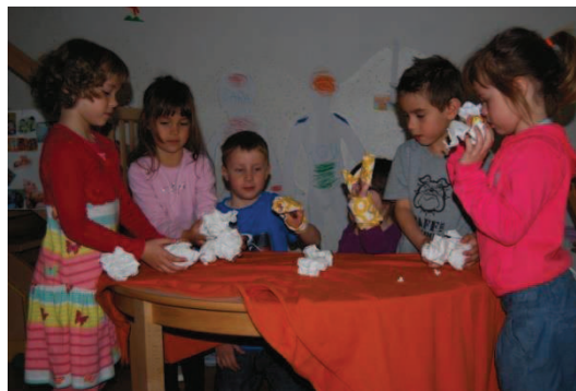
Slika 9: Lutkovna predstava - Zimska pravljica

Deklica (pet let, dva meseca) je predlagala, da bi z lutkami uprizorili predstavo po literarnem besedilu koroške ljudske pravljice, Mojca Pokrajculja, ki je bilo otrokom dobro poznano. Otroci so animirali lutke na dlaneh. Razdelili so si vloge in nas povabili k sodelovanju, česar prvotno nismo načrtovali.