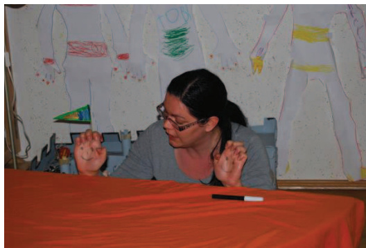
Slika 2: Lutki na dlaneh