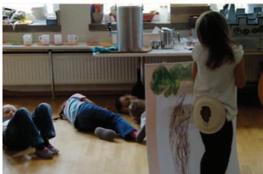
Slika 29: Sovica Oka

Vsak izmed njih, se je glede na vlogo odločil, katero telesno lutko bo animiral. Uporabili in izdelali so vse telesne lutke, ki so jih v projektu spoznali.