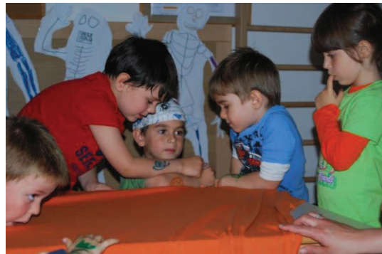
Slika 17: Lutke izdelane na desni roki