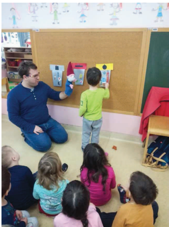
Slika 19: Prepoznavanje barv s pomočjo škrate

Vzgojiteljica se je z otroki posedla v jutranji krog in zapela Gumbkovo pesem. Sami pa smo odšli iz igralnice in skupaj s škratom čakali pred vrati. Ko so dokončali pesem in jutranji pozdrav, smo potrkali na vrata. Vstopili smo in se usedli med otroke. Škrat se je naprej zahvalil, ker smo mu vrnilo telo, potem pa je ponovil svojo zgodbo, ki smo jo sicer izvedeli že iz pisma. Povedal nam je nekaj osnovnih načel, zakaj je dobro, da začnemo tudi mi otroci skrbeti za naše okolje. Otroke je vprašal, če vejo, zakaj so koši različnih barv. Vsak koš je podrobno predstavil. Klical je k sebi otroke in jih spraševal, kakšne barve je kateri koš (slika 19).