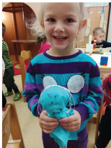
Slika 12: Veselje ob zaključenem delu

Čeprav so imeli nekateri pričakovano težave pri izbiri tako blaga kot ostalih delov, pa so bile lutke hitro končane. Otroci so se res trudili, da bi bile lutke čim lepše. Še ena stvar, ki nas je močno presenetila, so bili odgovori, kaj te lutke predstavljajo. Od klasičnih mamic pa vse do avtomobilov z očmi ali dinozavrov z lasmi. Še ena stvar se nam je zdela zanimiva, in sicer da so bili nekateri otroci močno razočarani nad dejstvom, da ne bodo sami lepili z lepilno pištolo. Vendar pa je bilo zadovoljstvo ob končnem uspehu zagotovljeno. Vsekakor si bomo zapomnili ta dan, saj je bilo nasmeškov še toliko več kot že sicer (slika 12). Presenetilo nas je tudi, da je deklica s posebnimi potrebami lepo počakala na svojo priložnost za izdelavo lutke in bila pri izdelavi močno zavzeta.