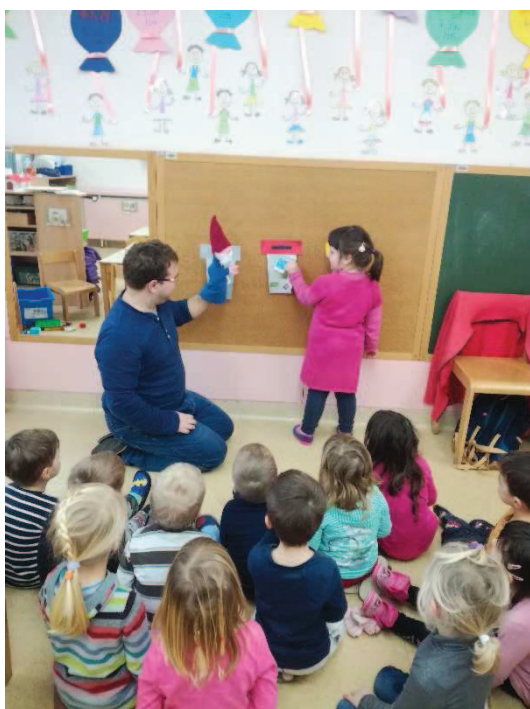
Slika 20: Razvrščanje smeti v igri Loči smeti

Otroci so le začudeno gledali, ko smo jim povedali, da sami nekam gremo in da ne bomo zraven pri jutranjem pozdravu. Ko smo potrkali in vstopili s škratom, pa se je otrokom na daleč videlo, da so zelo veseli. Začudeno so gledali, ko je škrat obešal smetnjake na naš pano. Morda je bila to napaka, saj so pogovoru težko sledili. Vseskozi so se presedali, klepetali in spraševali, zakaj so smetnjaki. Pozornost na pogovor je bila slaba. Punčka s posebnimi potrebami je vstala in hodila naokoli in hitro sta se ji pridružila tudi dva fanta. Začeli so se vrteti v krogu. Z vzgojiteljico smo se morali močno potruditi, da smo jih ustavili in prepričali, da so sledili pogovoru. Na škratova vprašanja je odgovarjalo le nekaj otrok. Vendar pa je pozornost narasla, ko je pogovor nanesel na igro. Kar nekaj otrok je imelo še težave pri ločevanju odpadkov. Na koncu so, ob škratovi pomoči, vsi pravilno razvrstili svoj odpadek v pravi koš (slika 20).