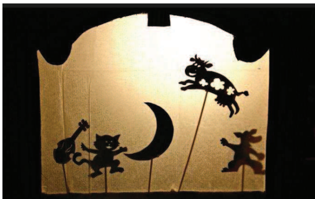
Slika 4: Senčno gledališče

Sodobne senčne lutke so narejene iz različnih materialov. Od neprosojnih, kar daje črno-belo kontrastno senco (slika 4), do prozornih in obarvanih lutk. Senčno gledališče v teh časih še vedno črpa iz Orienta in prilagaja estetiko in sporočilnost glede na čas in prostor. Osnovni princip senčnih gledališč je povsod enak, razlikujejo se le po detajlih, kot so npr. postavitev luči, material lutke, kvaliteta platna ... Zavedati se moramo, da sence omogočajo izredne fantazijske razsežnosti in s tem tudi raziskovanje. Prav ta zvrst je najprimernejša za uprizarjanje tragedij ali oper (Trefalt, 1993).