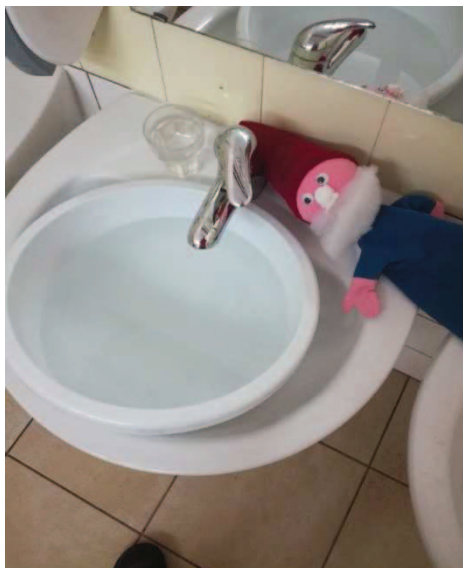
Slika 21: Škrat meri, kje je vode več.