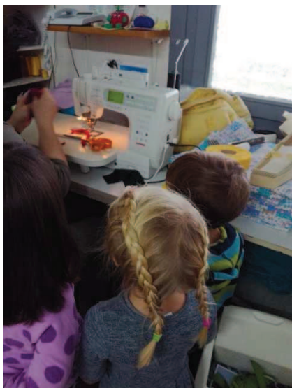
Slika 15: Opazovanje nastajanja lutke

sicer kar poslušali, kar sta jim povedali, vendar pa so komaj čakali, da začnemo z delom. Vseeno pa so predvsem fante močno privlačili tudi stroji, s katerimi poteka delo v pralnici. Ko smo se lotili dela, je ena izmed deklic glasno vzdihnila: končno . Najprej smo naredili glavo. Otroci so si sami izbrali, kakšen material bo za kapo. Potem pa so očarano strmeli v šivalni stroj, na katerem sta glava in na njej kapa nastajali (slika 15).