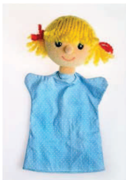
Slika 6: Ročna lutka

Posebnost ročne lutke je velika uporabnost rekvizitov. Moramo pa se zavedati, da je roka majhna, lutka pa je prilagojena njeni velikosti, zato bi se sorazmerno enako velik rekvizit izgubil pred očmi gledalcev. Lutke morajo zato uporabljati rekvizite v realni velikosti glede na roko. Osnova za igro z ročno lutke je knjiga Igralec z lutko , kajti samo prava analiza in poznavanje specifik omogoča pravilno rabo tekstov ali tem. Že tradicionalni ljudski lutkarji so uprizarjali svoje igre s pomočjo lutk. Ker je bilo v tistem času mnogo cenzure igralcev na odru, je lutka kot neživo telo služila, da je do širših množic prišla kritika bodisi oblasti bodisi družbenih norm in podobno. V modernem lutkarstvu pa je ročna lutka prepoznana predvsem po izrednih možnostih uprizarjanja lirskih iger, ljudskih pesmi in tudi vzgojno didaktičnih tem. Prav zaradi naštetega je ta vrsta lutke močno zaživela v šolah in vrtcih (Trefalt, 1993).