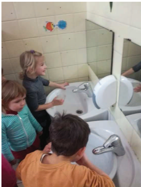
Slika 22: Otroci pijejo vodo s kozarca in direktno s pipe

Edino deklica s posebnimi potrebami je vodo natočila v lavor do vrha in potem s kozarcem zajemala. Eden od dečkov pa je vodo točil v kozarec in jo nato zlival v lijak. Otroci so bili ponosni, ko jih je Lubniški škratek pobožal. Vprašali so ga, če še kaj pride. Obljubil je, da pride in da ima za njih še eno posebno nalogo. Zanimivo je sedaj opazovati otroke, kako se vsakodnevno opominjajo glede uporabe kozarca.