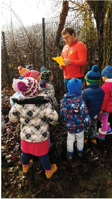
Slika 13: Branje škratovega pisma

Otroci so z zanimanjem poslušali. Ko smo končali z branjem, smo predlagali, da naj poiščejo, če se morda vseeno kje skriva ta škrat. Otroci so tekali sem in tja po gozdu, a škrata seveda niso našli. Bili so vidno razočarani. Zato smo vprašali, kako lahko pomagamo škratu, da mu naredimo telo? V pismu je namreč pisalo, da je škrat začaran (slika 14).