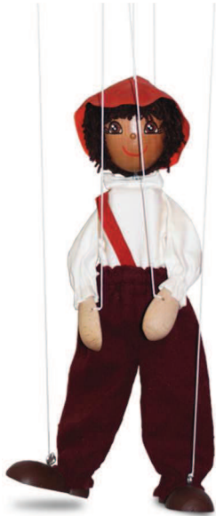
Slika 1: Marioneta

Posebnost ploske lutke je, kot nam že ime pove, da je dvodimenzionalna (slika 2). To pa pomeni, da se na odru ne more obračati. Če želimo s plosko lutko prepričati publiko, jo moramo izdelati v več variantah, ko gleda naprej, levo, desno ... Animacija takšne lutke je zelo zahtevna, saj moramo ves čas paziti, da lutke ne obrnemo preveč. Pri igri s plosko lutko je zelo pomemben podatek tudi to, da ne moremo igrati z rekviziti. S tem imamo v vrtcih pogosto težave (Varl, 1997b).