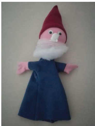
Slika 17: Lubniški škrat

Ko smo imeli pogovor po opravljeni dejavnosti, so nam povedali, da jih je najbolj presenetilo, da je lutka narejena tako hitro. Še nekaj naslednjih dni so se pogovarjali o tem, kako dobro zna gospa iz pralnice šivati in kako hitro je bila lutka narejena. Zelo zanimivo se nam je zdelo tudi to, da je punčka s posebnimi potrebami lepo sodelovala in celo sama izbrala, kakšen nos bo imela lutka (slika 17).