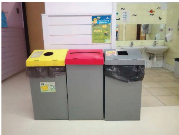
Slika 18: Koši za ločevanje odpadkov

Za začetek ozaveščanja otrok, kako lahko pripomoremo k boljšemu in zdravemu planetu, smo se odločili za ločevanje odpadkov. To se nam je zdela primerna prva dejavnost, saj imajo otroci že od vstopa v vrtec različne koše v vsakem atriju (slika 18).