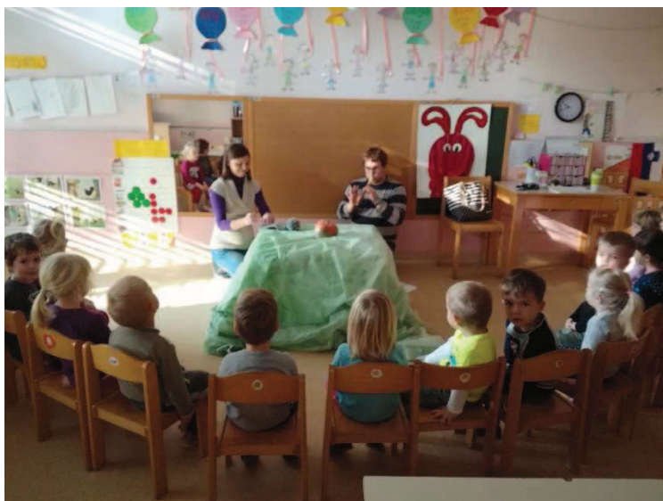
Slika 9: Uprizoritev Razbite buče

Po opazovanju sodeč so se otroci v gledališče usedli z velikim pričakovanjem. Nekateri so na glas spraševali: »Kaj je to«? S sodelavko smo imeli kar nekaj dela, da smo jih umirili in pripravili na ogled predstave. Je pa tak odziv otrok pričakovan, saj lutkovne predstave že dolgo časa nismo imeli in je bilo zato vznemirjenje veliko. Ko se je pravljica začela, so skoraj vsi otroci pravljico spremljali odprtih oči in ust (slika 9).