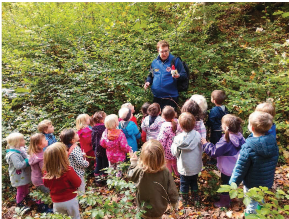
Slika 7: Lutka v pedagoškem procesu