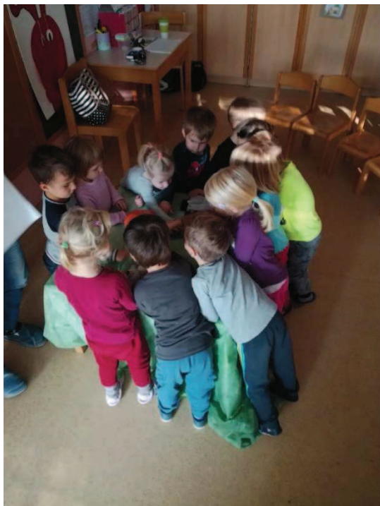
Slika 10: Prepiranje za lutke

ona je namreč očarana opazovala predstavo. Po koncu predstave, ko smo pripravili lutke na ogled, je prišlo do drenjanja (slika 10).