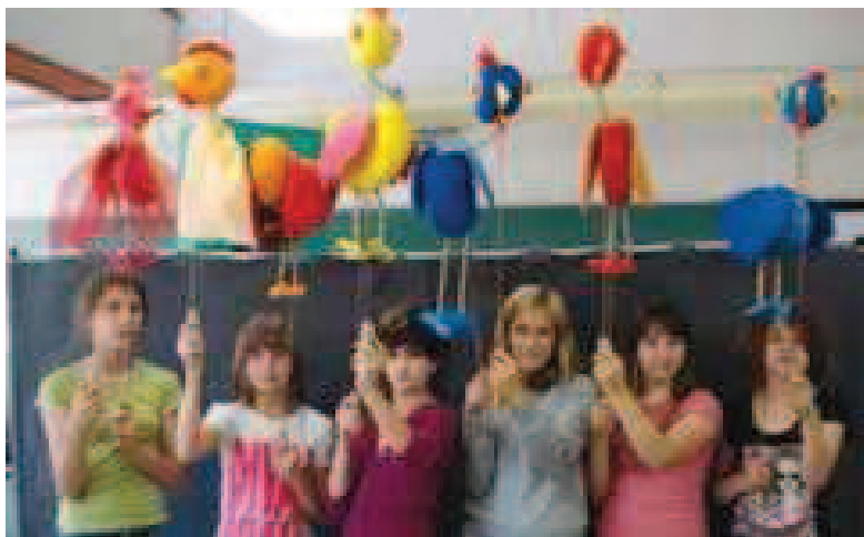
Slika 5: Lutka na palici