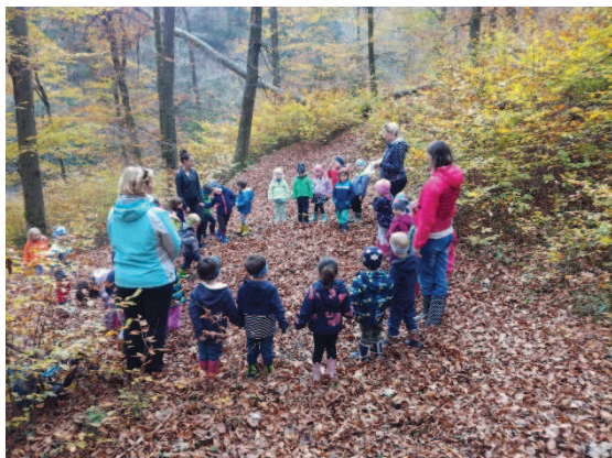
Slika 23: Škratove dihalne vaje za boljše počutje

šolsko leto. Tam smo naredili krog in škrat je naredil nekaj dihalnih vaj za boljše počutje (slika 23).