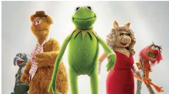
Slika 3 Mimične lutke

Mimične lutke tako imenujemo zaradi njihovih bogatih mimičnih sposobnosti, kar za druge lutke ni značilno. Mimika je možna zaradi prožnih materialov, iz katerih so narejene. Ti materiali omogočajo lutkarju različne spremembe lutkine mimike (Trefalt, 1993).