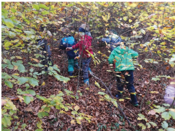
Slika 24: Raziskovanje gozda

Otroci so za vsako stvar hiteli nazaj in škratu razlagali, kaj vse so našli. Ko je bilo raziskovanja konec, smo odšli nazaj proti vrtcu. Otroci so bili utrujeni, kar se vidi po tem, kako počasi so hodili nazaj. Porabili smo skoraj dvakrat toliko časa kot v drugo smer. Ko je škrat prinesel knjige, so bili zelo zadovoljni. Ena izmed deklic je dejala, da smo počasi zamenjali vso igralnico. Otroci pa so se prav prešerno smejali, ko je škrat prinesel še svoje gnezdo. Pokazali so mu, naj ga postavi na grad. To je namreč njihova najljubša igrača v igralnici.