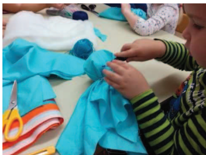
Slika 11: Neverjetna zavzetost otrok

Otroci so bili že v jutranjem krogu precej nemirni, saj smo jim povedal, da jih ta dan čaka nekaj posebnega. Takoj, ko smo se posedli, je ena izmed deklic vprašala, če lahko zaigrajo igro s prejšnjega dne. To je bilo za nas veliko presenečenje, saj ta deklica po navadi ni med samozavestnejšimi. Dogovorili smo se, da bodo predstavo odigrali takoj po jutranjem krogu. Ko smo otrokom povedali, da smo pripravili material za izdelavo lutk, je bilo v igralnici res veselo. Otroke smo z vzgojiteljico težko držali na svojih mestih, da smo jim razložili potek in dogajanje dneva. Kljub včerajšnjemu navdušenju, nam je bilo to zelo zanimivo, saj je to skupina, ki je skupaj že tri leta in otroci dobro poznajo pravila. Ko smo končali pogovor in se razdelili po kotickih, smo se lotili dela. Prav vsi otroci so bili neverjetno zagnani. Mislimo, da je bil to prvi projekt, ki jih je prav potegnil vase. Zavzetost je otrokom sijala iz oči (slika 11).