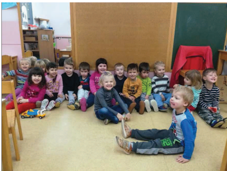
Slika 8: Skupina Gumbek

Praktični del svoje diplomske naloge bomo izvajali v vrtcu Škofja Loka, enota Najdihojca, skupina Gumbek. To je tudi sicer skupina, v kateri smo pomočnik vzgojiteljice. Delo in otroke v oddelku tako dobro poznamo. V oddelku imamo deset punc in sedem fantov in prav vsi otroci iz oddelka bodo sodelovali v raziskavi. Ena deklica ima posebne potrebe, tako da je normativ v oddelku zmanjšan. Skupina je zelo živahna in otroci močno radovedni. Mislimo, da so otroci iz skupine že močno samostojni in vedoželjni. Večina otrok je v oddelku že od prvega dne vrtca, nekateri so se nam priključili lani na začetku šolskega leta, nekateri letos. Skupina je zelo povezana. Otroci so rojeni od decembra 2014 do decembra 2015. Skupina je torej homogena (slika 8).