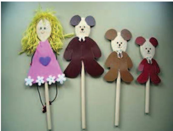
Slika 2: Ploske lutke

Posebnost ploske lutke je, kot nam že ime pove, da je dvodimenzionalna (slika 2). To pa pomeni, da se na odru ne more obračati. Če želimo s plosko lutko prepričati publiko, jo moramo izdelati v več variantah, ko gleda naprej, levo, desno ... Animacija takšne lutke je zelo zahtevna, saj moramo ves čas paziti, da lutke ne obrnemo preveč. Pri igri s plosko lutko je zelo pomemben podatek tudi to, da ne moremo igrati z rekviziti. S tem imamo v vrtcih pogosto težave (Varl, 1997b).