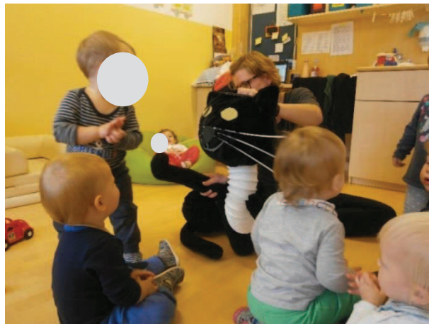
Slika 13: Plešemo s »Črnim mucem«.