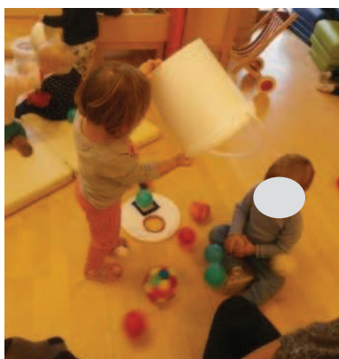
Slika 22: ... stresem!