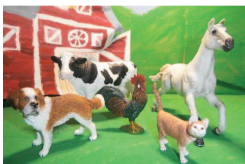
Slika 7: Živali s kmetije