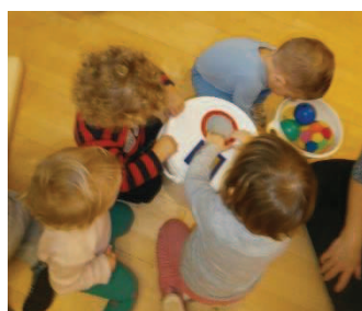
Slika 19: Kako dobiti žoge ven?