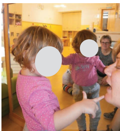
Slika 26: Kje imam nos?