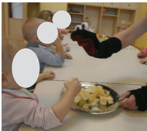
Slika 34: Boš jedla jabolko ali banano?