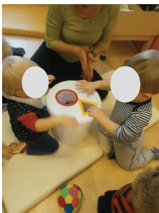
Slika 16: Vstavljanje žogice v pravilno odprtino.