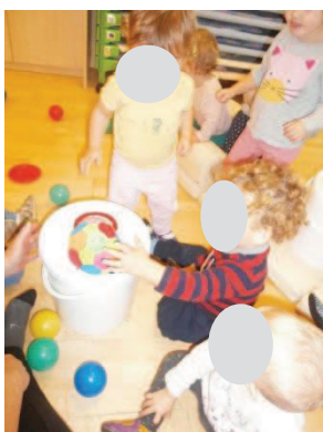
Slika 18: Z veliko žogo poskusi še drugi deček