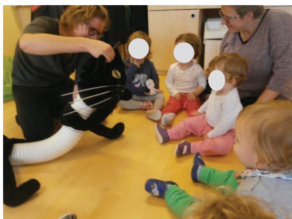
Slika 10: Črni muc se umiva.