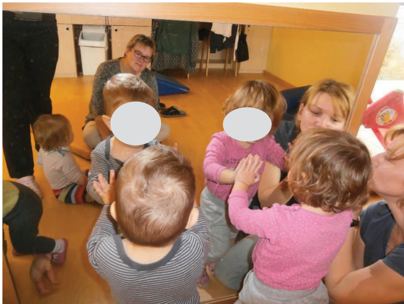
Slika 25: S prstno lutko pred ogledalom.