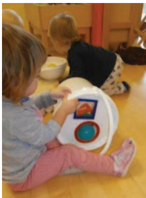
Slika 20: Tu je pokrov.