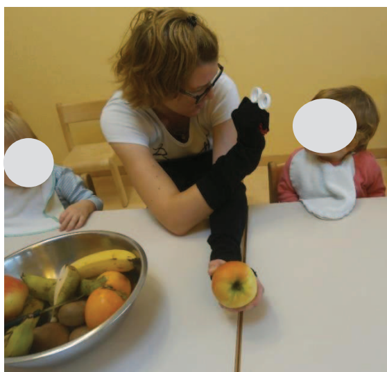
Slika 32: Otrok komunicira z lutko.

Otroci so lutko hitro sprejeli in jo posnemali. Pokazali so, da znajo jesti samostojno in se pri tem trudijo, da bi čim več pojedli sami. Lutka mi je pri dejavnosti dobro služila kot pomočnik in tudi pri komunikaciji z otroki sem dobila več odziva, kot če jih ogovorim jaz. Otroci so z lutko komunicirali na svoj neverbalen način; nekateri so ji tudi že odgovarjali z ja ali ne.