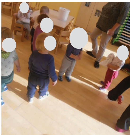
Slika 27: Otroci sledijo lutki.

Preko spontanosti dejavnosti v skupini sem se spraševala, kako preusmeriti pogled otroka iz mojega obraza v noge. Dogajalo se je namreč, da so otroci, ko sem pela pesem »Marko skače« in pri tem dvigovala nogi po ritmu, vedno spremljali le moj obraz. Tako sem poskusila s copati, ki sem jima dodala lase in ju poimenovala Biba in Baja. V dejavnosti Gibamo se z Bibo in Bajo so otroci pogled usmerili v lutki – moji nogi in posledično so se, ko so pogled usmerjali v gibanje mojih nog, osredotočali na gibanje svojih nog in ne več name in moje obrazne mimike. To dejavnost bom izvedla večkrat in sčasoma bodo pozorni tudi na besedilo in ritem pesmi. Opazila sem, da sem takoj, ko so otroci izgubili zanimanje, našla nekaj drugega, da sem jih pritegnila nazaj k sebi. Tudi vzgojiteljica mi je s potjo iz blazin pomagala. Čeprav sem bila v dvomih, da mi bodo sledili, so otroci v vrsti hodili za menoj.