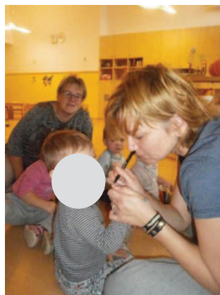
Slika 24: Nariši mi mojo lutko.