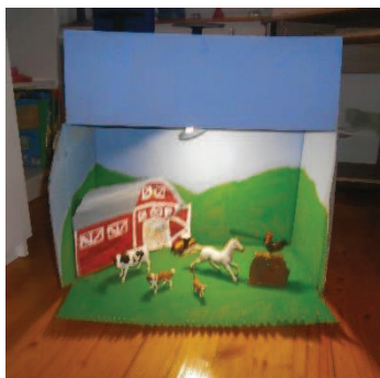
Slika 8: »Mini predstava za mini gledalce«

Ko v otrokovo aktivno in domišljjsko igro vključimo gledališče in igro, mu omogočamo izmenjavo izkušenj in mu neposredno približujemo njegov kulturni okvir. S tem raste, zori in pridobiva izkušnje, ki mu bodo pomagale postati samostojna in enkratna osebnost. Ključnega pomena je, da otrok izkusi gledališko igro in s tem pridobi izkušnjo pripovedovanja, vključevanja gibanja in oživljanja predmetov v ustvarjalno in simbolno igro (Cvetko, 2010).