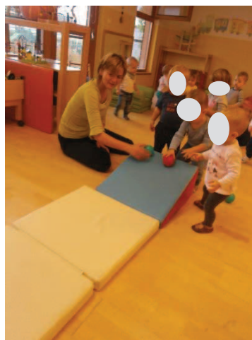
Slika 15: Žogice se kotalijo po klančini