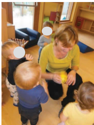
Slika 14: Spoznamo Nagajivo žogico