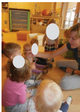
Slika 23: Izštevanika

Dejavnost je uspela, otroci so me deset minut spremljali in sledili lutkam. Menim, da je bil pristop s prstno lutko – osa dobra izbira, saj so otroci lažje, hitreje sprejeli, da se lahko tudi prst, če mu narišemo obraz, spremeni v lutko. Pričakovala sem, da bodo bolje poznali dele svojega obraza in bo več otrok pokazalo na svoj nos, usta, oči, vendar menim, da bodo ob naslednji ponovitvi že v večji meri dosegli cilj. Danes se je tudi pokazalo, da so žogo (dejavnost »Nagajiva žogica«) le sprejeli tudi kot lutko. Otroci so povezali petkovo dejavnost z današnjo. Deček, star 18 mesecev, je vzel žogico, jo pogledal in z njo plesal ob mojem petju pesmice »Žogica«. Otroci kažejo vedno večje zanimanje za lutke. Danes me je presenetilo, da so deset minut sedeli v polkrogu, me poslušali in sledili tako meni kot lutki.