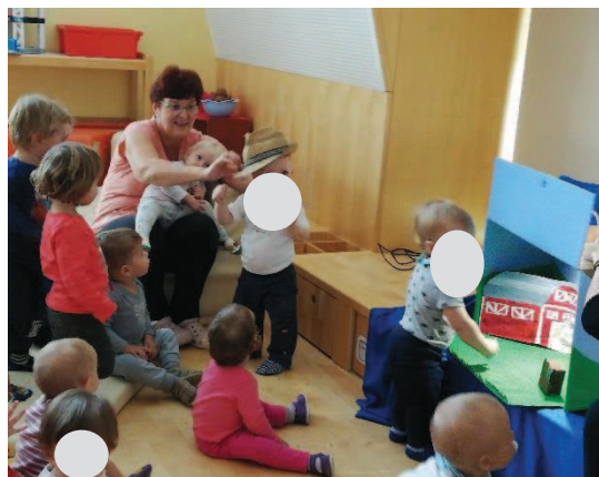
Slika 31: Igra z lutkami in rekviziti.