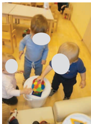
Slika 17: Deček prinese drugo žogo.