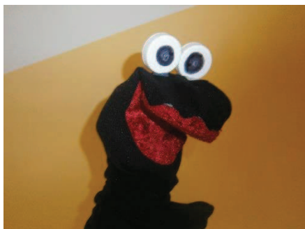
Slika 4: Mimi