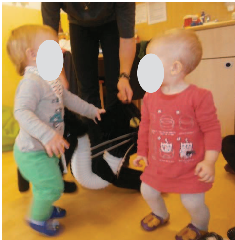
Slika 12: Pojemo s »Črnim mucem«.