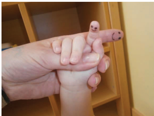
Slika 2: Moja lutka na prstu