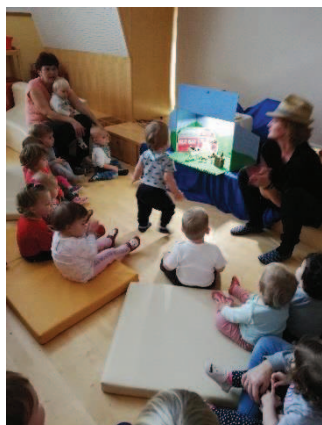
Slika 30: Predstava.

in jih šele nato položila na sceno. Vsebina predstave in dolžina, 10 minut, sta ustrezali starosti otrok. Otroci so si tako prvič ogledali predstavo, vzgojiteljice pa smo dobile povratne informacije o otrocih: kako sodelujejo, kako sledijo in kako se vedejo v drugem prostoru.