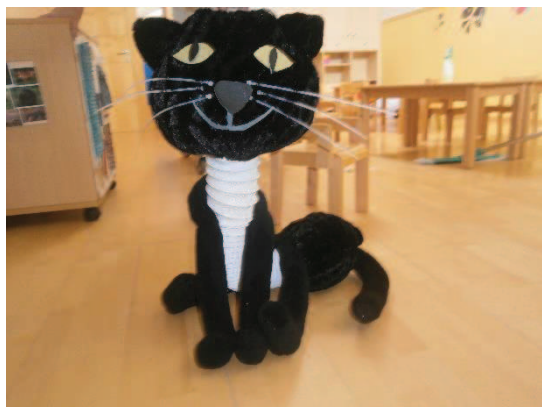
Slika 3: Črni muc