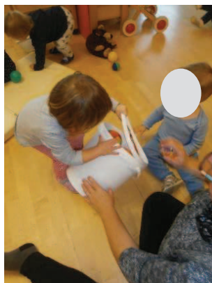
Slika 21: Odprem ...