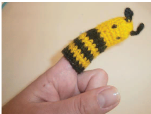
Slika 1: Prstna lutka osa

Takšne vrste lutk so najpreprostejše. Lahko so samo narisane na prstih ali izdelane iz blaga in potegnjene na prst (Majaron, 2006).