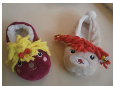
Slika 6: Biba in Baja