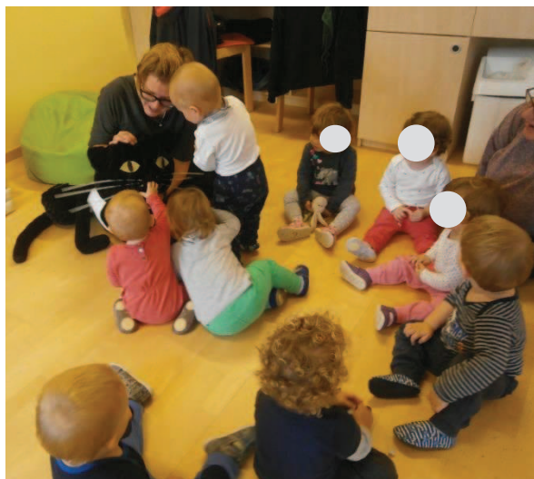
Slika 9: Spoznavamo Črnega muca.