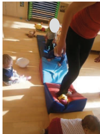
Slika 28: »Biba buba baja pleše ringaraja« Slika 29: Hoja po blazinah.