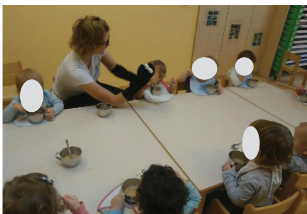
Slika 35: Mi zmoremo sami.