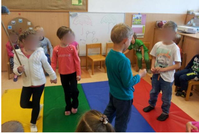
Slika 37: Obnovitev zgodbe brez lutk