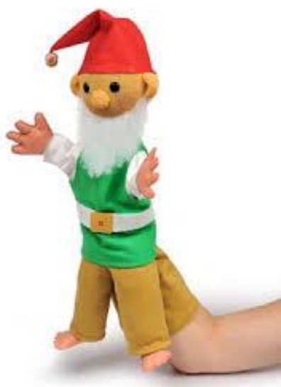
Slika 3: Ročna lutka