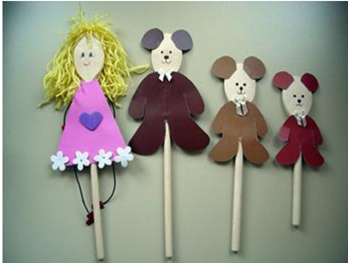
Slika 1: Lutka na palici