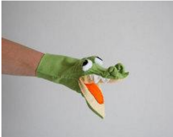
Slika 4: Mimična lutka