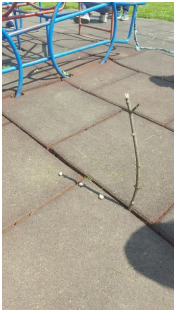
Slika 28: Izdelana sončna ura