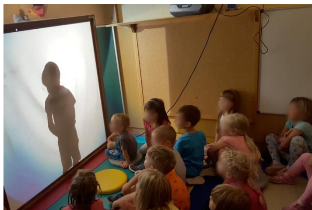
Slika 13: Kdo je to?