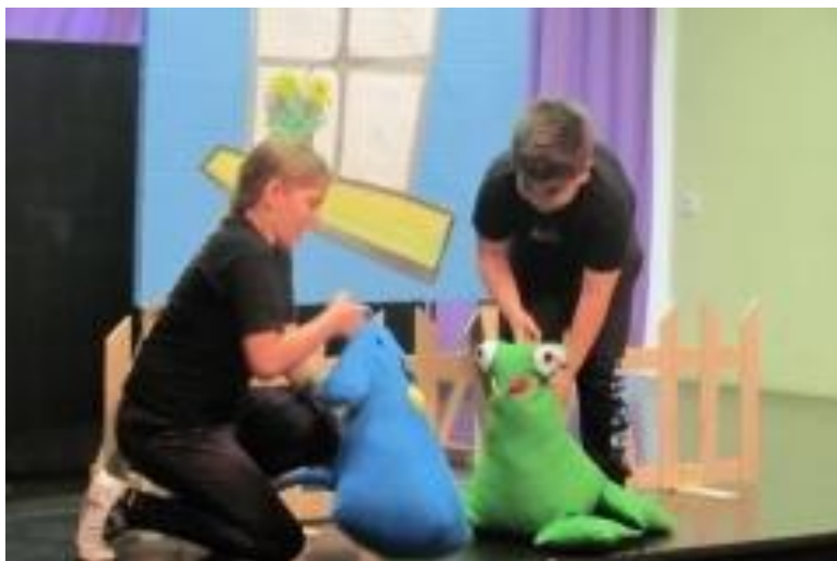
Slika 6: Lutka – igrača