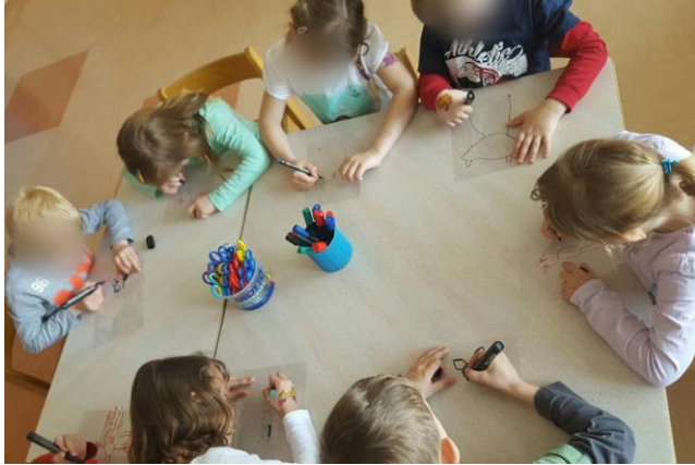
Slika 32: Izdelava senčnih lutk