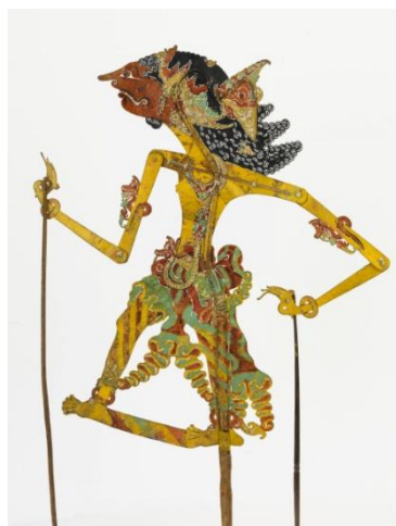
Slika 10: Senčna lutka

(gamelan), lutkar pa je smatran za pravega mojstra, saj mora obvladati več lutk hkrati in podati vsaki svojo osebnost (prav tam).