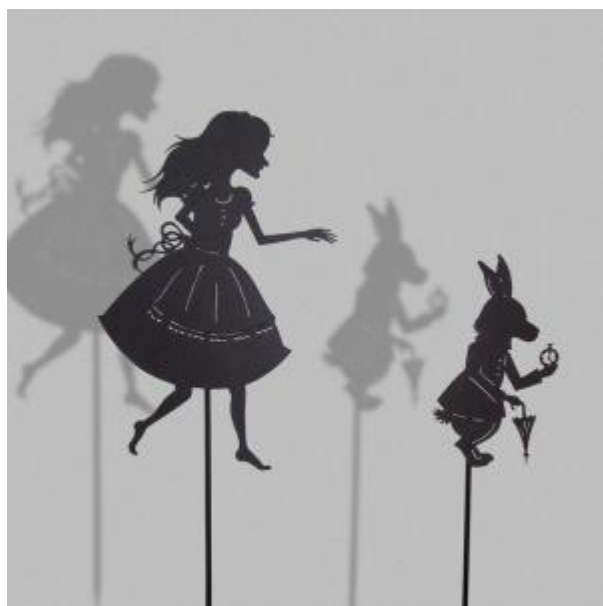
Slika 9: Senčna lutka

Tako kot enostavne ploske lutke so tudi lutke iz senc dvodimenzionalne. Senčne lutke se prikažejo, ko med snop svetlobe in platno postavimo postavimo dvodimenzionalno lutko ali predmet. Na platnu se tedaj orišejo robovi zunanje oblike predmeta ali lutke. Za takšne lutke je značilno, da so mehke, nežne in poetične. Z njimi lutkar ne more predstaviti mnogo podrobnosti, saj sence likov to ne dovoljujejo. S takšnimi lutkami in predstavami lahko lutkar otrokom uprizarja preproste, jasne in otrokom že znane vsebine, ki velikokrat samo dopolnijo ali vzpodbudijo domišljijo. Varl (1997) pravi: »To je edina med različnimi lutkovnimi tehnologijami, ki jo gledamo posredno. Prav v tem pa je njena zanimivost, njena čarobnost.« (Varl, 1997, str. 30).