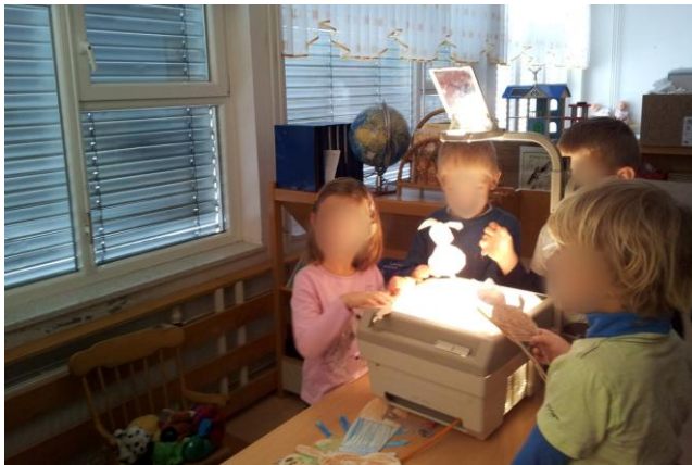
Slika 31: Prosta igra