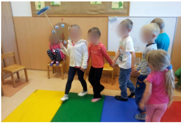
Slika 38: Obnovitev zgodbe brez lutk