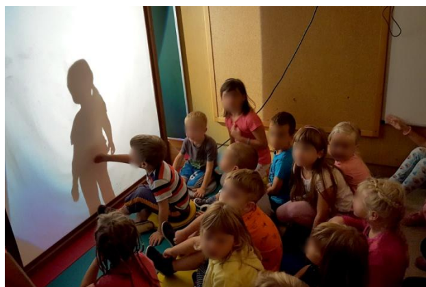
Slika 12: Kdo je to?

otroke zelo zanimivo, predvsem igre, ker skozi njih otrokom lahko lažje predstavimo zastavljeni cilj, na sproščen način, otroku blizu.