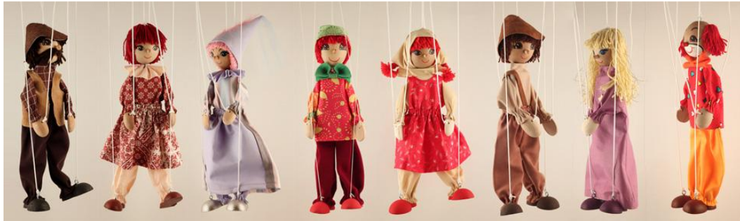
Slika 2: Lutka na nitkah