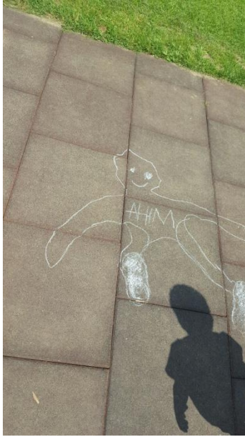
Slika 27: Senca prijatelja