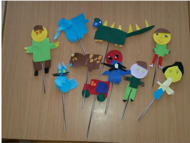
Slika 8: Ploska lutka