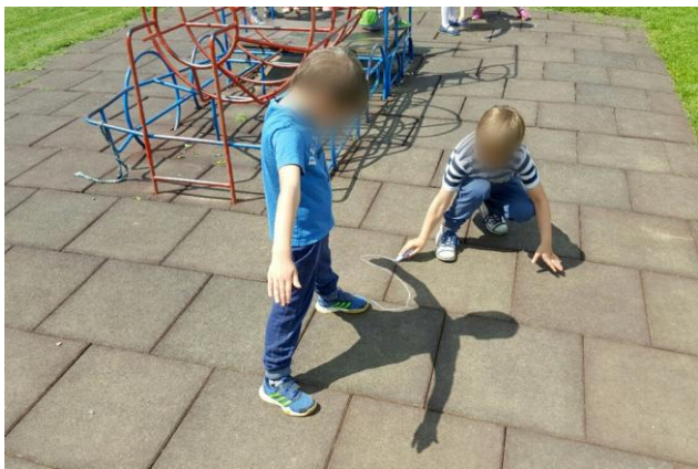
Slika 25: Obrisovanje sence