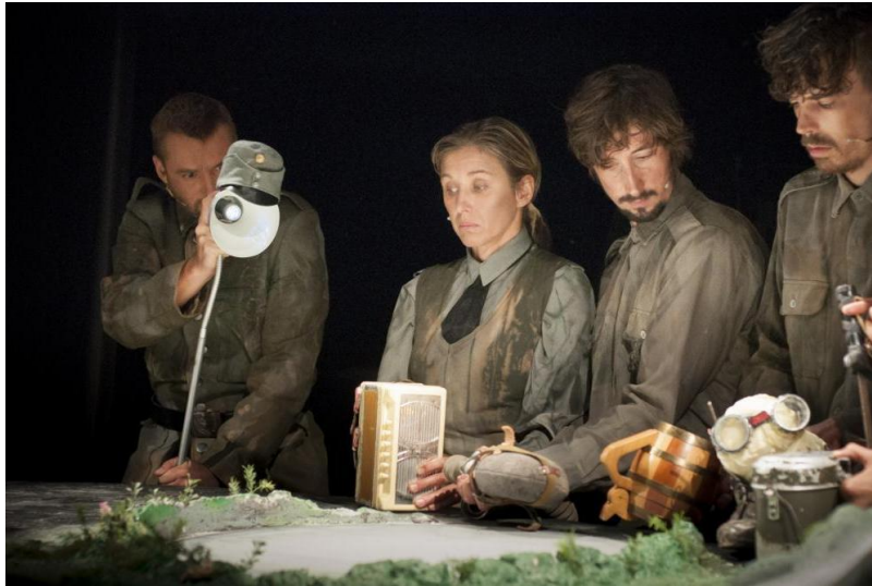
Slika 5: Predmet lutka