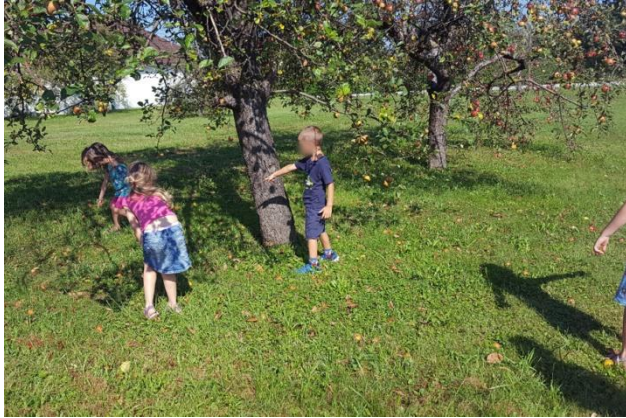
Slika 21: Senca drevesa