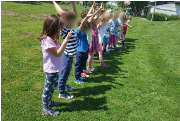
Slika 23: Telesne sence