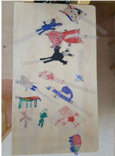
Slika 36: Nekaj primerov izdelanih senčnih lutk