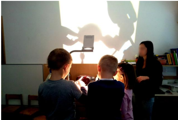
Slika 39: Prosta igra