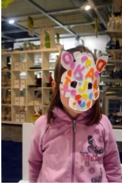
Slika 7: Maska