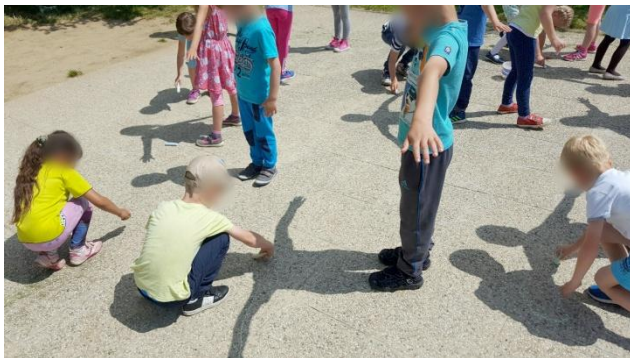
Slika 26: Obrisovanje sence