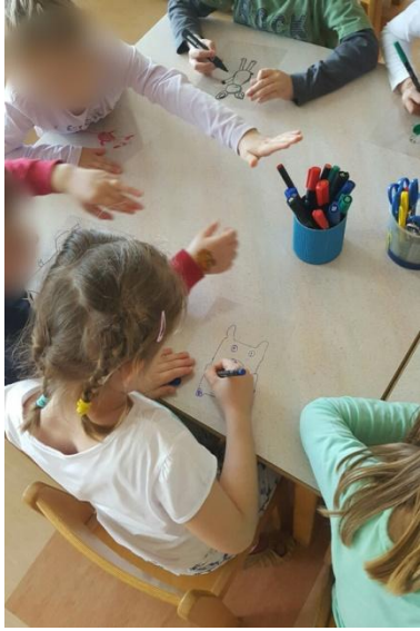
Slika 34: Izdelava senčnih lutk