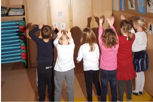
Slika 17: Telesne sence