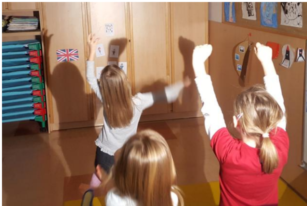
Slika 18: Telesne sence