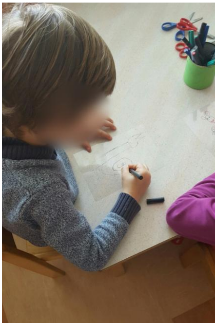
Slika 33: Izdelava senčnih lutk