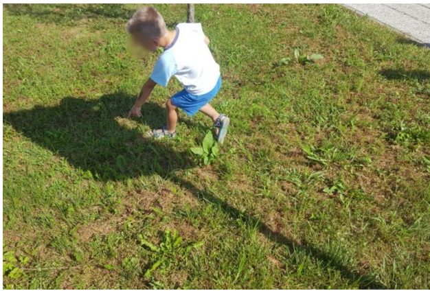
Slika 22: Senca prometnega znaka