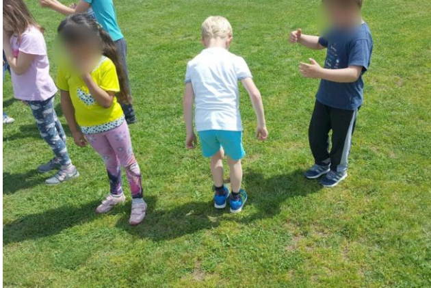
Slika 24: Skok na senco