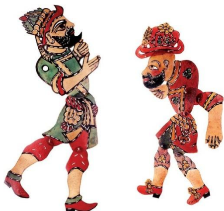
Slika 11: Karadžoz

je bilo značilno, da so imele zamenljive glave in drobne vzorčke, odlikovala pa jih je precizna izdelava. Občinstvo je tako osebkje prepoznalo po glavah, izrazih, obrazih, pričeskah, pokrivalih. S turškim vplivom se je iz Male Azije na večji del Sredozemlja razširilo senčno gledališče Karadžoz oziroma Črnooček, poimenovano kar po glavnem junaku, ki je karakterno zelo podoben našemu Pavlihu, oba sta namreč šaljivca (prav tam).