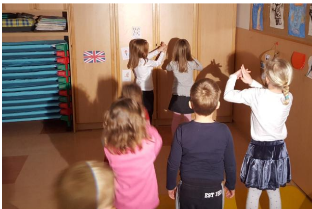
Slika 16: Telesne sence