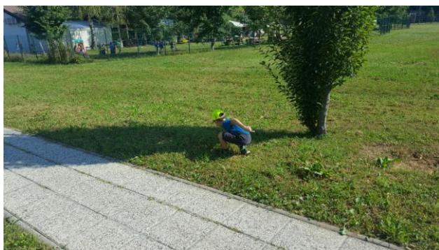
Slika 20: Senca grma

Na sprehodu smo opazovali sence okoli sebe. Otroci so bili dobri opazovalci. Opazili so lastne sence, sence dreves, hiš, avtomobilov, prometnih znakov in podobno. Prispeli smo do domovanja dečka iz skupine, kjer imajo postavljeno sončno uro. Otroci so jo z zanimanjem opazovali. Razložila sem jim njeno delovanje. Po zaključenem sprehodu smo se odpravili na igrišče. Načrtovana dejavnost ni potrebovala dodatne motivacije. Poizkušali so ujeti prijateljevo senco, mu skočiti na glavo, ga pobožati po glavi sence in jo na koncu obrisali. Opazila sem, da so nekateri otroci sencam dodali tudi imena prijatelja, ki so ga obrisali. Nastale obrise senc smo si z otroki skupaj ogledali. Z veseljem so se hvalili: »Ta je moja!« Obrisovanje senc se je zaradi motiviranosti otrok odvijalo dalj časa. Na koncu smo na preprost način izdelali sončno uro, in sicer tako, da smo zapičili manjšo palico med plošče iz umetne mase, ki so položene na območju igral in na različne časovne intervale spremljali dolžino sence palice ter jo označili s kamnom. Otroke sem v nadaljevanju opazovala med prosto igro na igralih in zasledila, da so nekateri radovedno hodili opazovat premikanje sence palice, čeprav jih nisem poklicala, da jo pridejo opazovat.