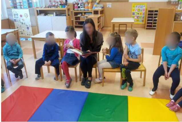
Slika 29: Seznanitev z zgodbo