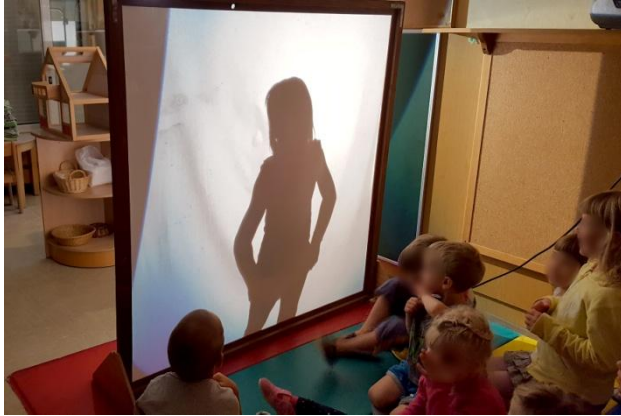
Slika 14: Kdo je to?