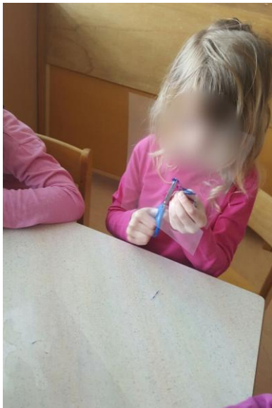
Slika 35: Izdelava senčnih lutk