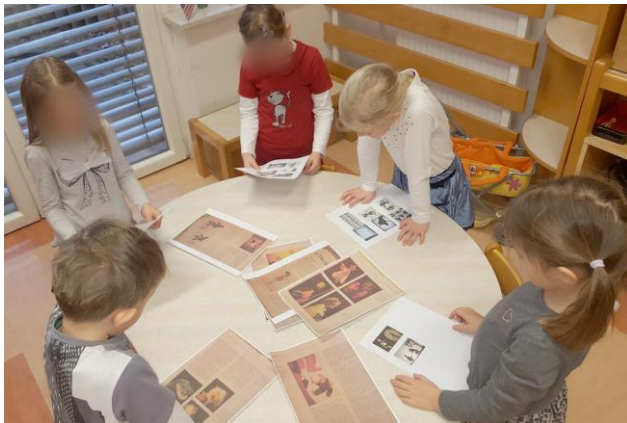
Slika 15: Pregled literature