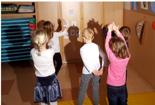
Slika 19: Telesne sence