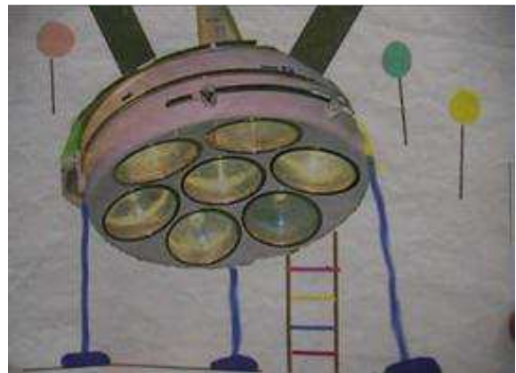
Imagen 2: "Descubriendo el planeta S.O."