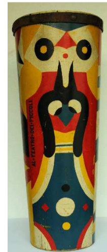
Imagen 20: Tambor para el espectáculo Balli Pastici , 1918