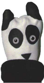
Imagen 30: Títere de mano