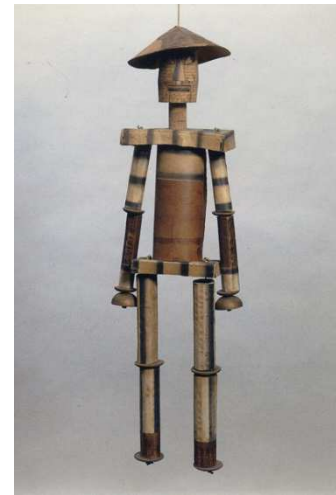
Imagen 17: Pantalón (Sophie Taeuber-Arp, 1918)