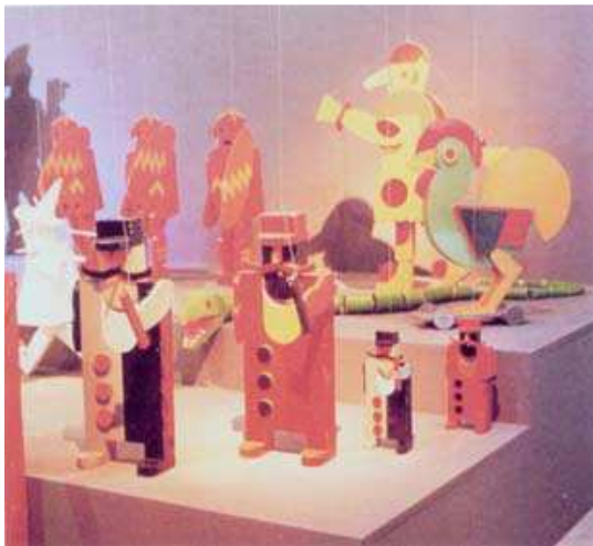
Imagen 18: Marionetas del espectáculo Balli Plastici (Fortunato Depero, 1918)

De las marionetas originales construidas por Fortunato no se conservan ninguna en la actualidad. En 1981, fueron reconstruidas por el taller Bottega Blum , en Venecia, y pintadas por Umberto Spasiano basándose en los diseños originales. 32