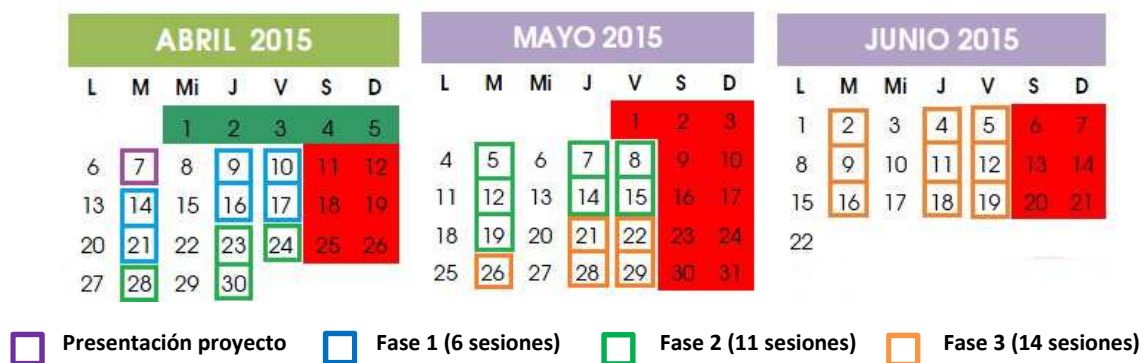
Imagen 27: Organización temporal fases