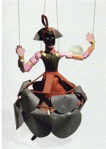
Imagen 13: Longhi I (Alexandra Exter, 1926)