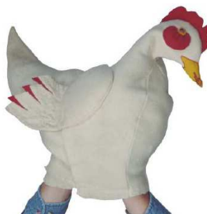
Imagen 34: Títere de guante