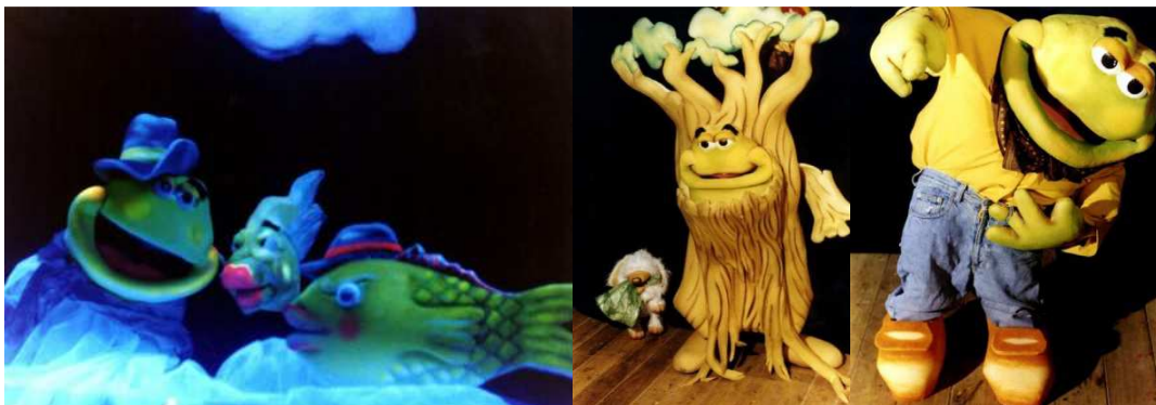
Imagen 29: Espectáculo “Despertando sueños”, compañía Arte Fusión Títeres 37