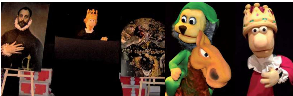
Imagen 28: Espectáculo “El Gran Sueño de El Greco”, compañía Arte Fusión Títeres 36