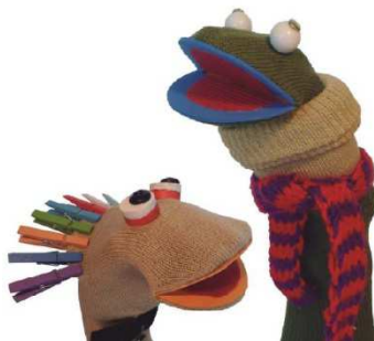
Imagen 33: Títere de media