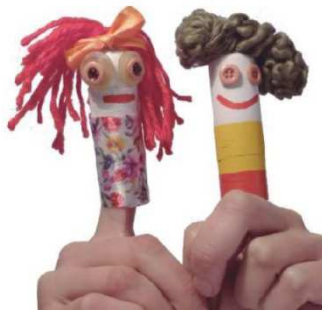
Imagen 31: Títere de dedo