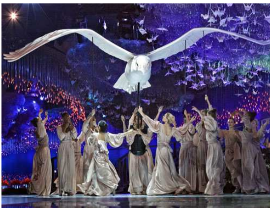
Imagen 24: La boda de Lateefa Bint Maktoum, Dubai (Roger Titley)