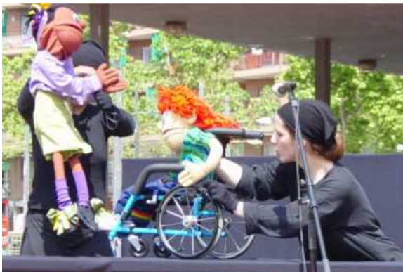
Imagen 5: Proyecto "Compañeros de Barrio"

El proyecto Compañeros de Barrio , grupo formado por cinco títeres, a través de actuaciones cortas destinadas a niños de entre 8 y 12 años, introducen discapacidades como la ceguera, el retraso mental, la sordera, e incluso las diferencias culturales y étnicas. Cada títere, con una discapacidad diferente, explica al resto de compañeros lo que le pasa, como por ejemplo, por qué no puede andar y se encuentra en silla de ruedas, o por qué no puede leer con los ojos y utiliza sus dedos para hacerlo. Estas representaciones son muy interactivas, con la finalidad de que los niños espectadores puedan preguntar a los títeres todo aquello que le cause curiosidad, o incluso, cómo deben actuar ante un compañero o conocido que se encuentre en las mismas circunstancias que los títeres. 27