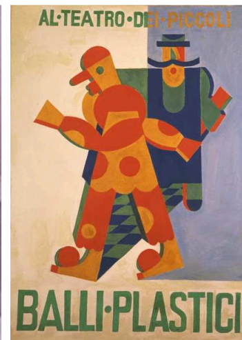
Imagen 19: Cartel del espectáculo Balli Plastici , 1918