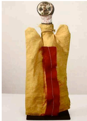
Imagen 10: Fantasma Eléctrico (Paul Klee, 1923)