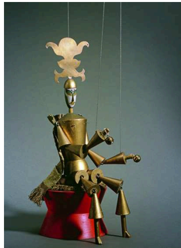
Imagen 16: Rey Deramo (Sophie Taeuber-Arp, 1918)