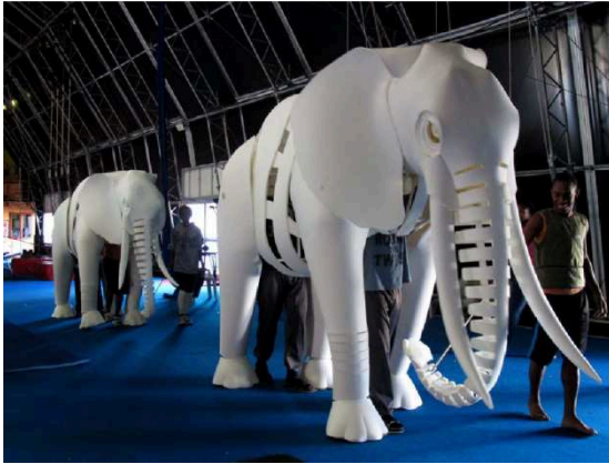
Imagen 22: Elefantes de la Copa del Mundo de fútbol, Sudáfrica