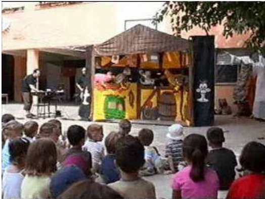
Imagen 7: Teatro de Títeres "Imagina"

muy importante que los pacientes intervengan, tanto en la construcción y puesta en escena de las propuestas, como en la toma de decisiones y organización de las tareas. 28