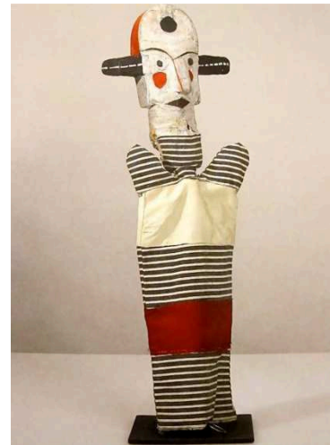
Imagen 11: Payaso de Grandes Orejas (Paul Klee, 1925)