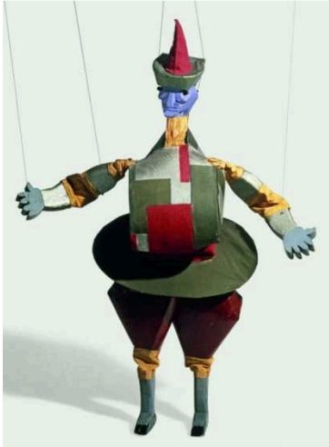
Imagen 12: Polichinela (Alexandra Exter, 1926)

Pero estas no son las únicas marionetas de las que tenemos constancia que fueron elaboradas por la artista. También podemos encontrar otras de hilos, creadas desde el diseño y la pintura, que quizás, fueron diseñadas para un posible espectáculo posterior.