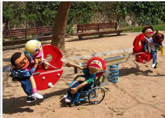
Imagen 6: Proyecto "Compañeros de Barrio"

El psicólogo Alberto García puso en marcha, en el Centro de Día de Santa Eulalia de Hospitalet de Llobregat, el grupo de teatro de títeres Imagina , con el que actúa en diferentes centros educativos. El grupo de teatro está formado por pacientes adultos que sufren algún trastorno mental severo, y que anteriormente han participado en otro tipo de actividades rehabilitadoras.