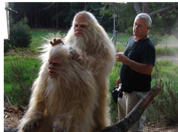
Imagen 25: Simios y Yetis para documentales (Roger Titley)