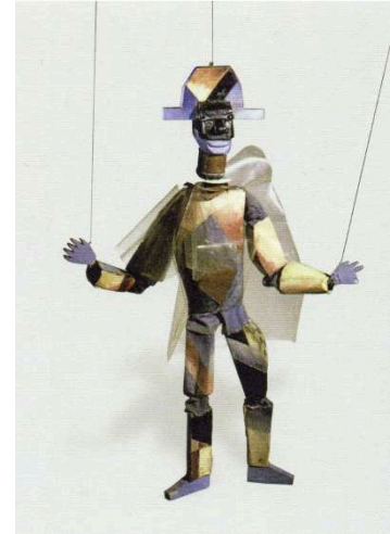
Imagen 14: Arlequín azul (Alexandra Exter, 1926)

Existen diferentes teorías respecto al número de marionetas realizadas por Exter, al igual de las razones por las que fueron diseñadas. Hay catálogos que recogen un total de veinte piezas, otros cuarenta, y en concreto, en el catálogo publicado en el año 1980, Alexandra Exter: Marionettes and Teatral desingns , recoge un total de hasta sesenta marionetas diseñadas por la artista. 30