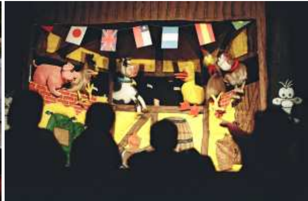
Imagen 8: Teatro de Títeres "Imagina"

Hay que tener en cuenta que, tanto el intercambio de experiencias como la publicación de los resultados obtenidos en ellas, pueden servir de ayuda a otros terapeutas que decidan incorporar el títere en sus procedimientos terapéuticos.