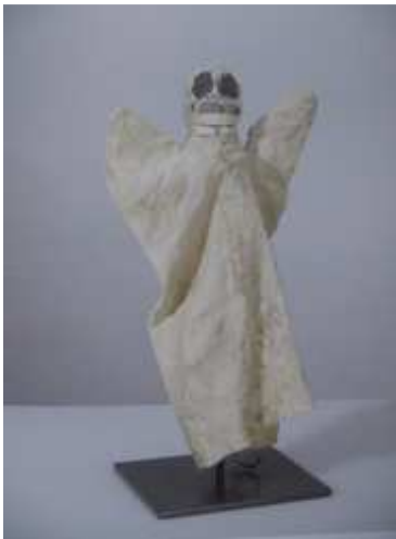
Imagen 9: Señor Muerte (Paul Klee, 1916)

En este último grupo, podemos encontrar, entre otros, Payaso de Grandes Orejas , Espectro Eléctrico , Barbero de Bagdad o Sultán . Estos títeres resultan más provocativos y complejos respecto a los títeres realizados anteriormente, tanto en el diseño como en el contenido, debido a la influencia del entorno académico que sufrió Paul durante este periodo de tiempo. 29