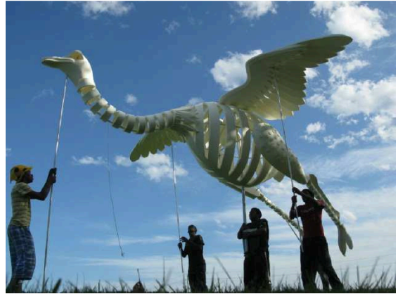
Imagen 23: Avestruz para el festival KKNK, Sudáfrica (Roger Titley)