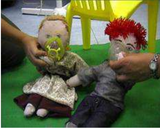
Imagen 3: "Descubriendo el planeta S.O."