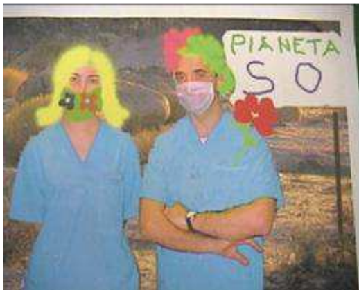
Imagen 1: "Descubriendo el planeta S.O."

Durante la experiencia, el niño es el astronauta, que al entrar en la nave espacial (el quirófano) se encontrará con una multitud de instrumentos especiales y necesarios para el viaje que le espera. Por ejemplo, la máscara de oxígeno le permitirá respirar en el planeta al que se dirige; con las agujas, el astronauta podrá medir su fuerza; el monitor del quirófano, es la televisión del nuevo planeta; y los electrodos, le permitirán al astronauta comunicarse con el resto de habitantes del planeta. 23