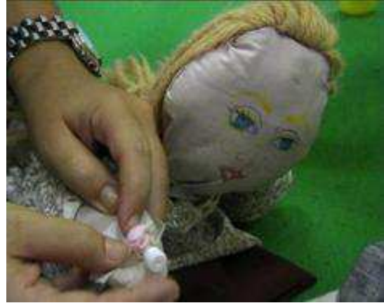
Imagen 4: "Descubriendo el planeta S.O."