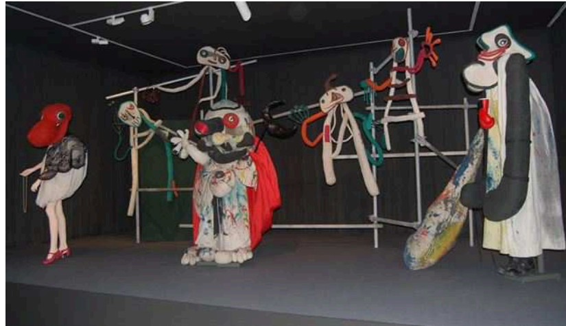
Imagen 21: Títeres de Joan Miró en el Museo de Arte Contemporáneo de Alicante

Recientemente, en una de las salas de exposiciones del Museo de Arte Contemporáneo de Alicante, se han expuesto por primera vez, desde 1980, los títeres y decorados diseñados por Joan Miró. Personajes tales como El Merma , La Dona y El Ministro , junto a cuatro hurones, dos baúles, fotografías, folletos, y dibujos, han completado la muestra expuesta en la MACA. 33