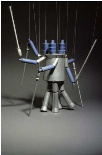
Imagen 15: Centinela (Sophie Taeuber-Arp, 1918)

Estas marionetas se conservan en el Museo de Diseño Bellerive de Zúrich, y son la contribución más original de Sophie al movimiento Dadá. 31