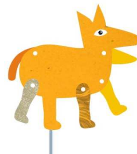
Imagen 35: Títere de varilla