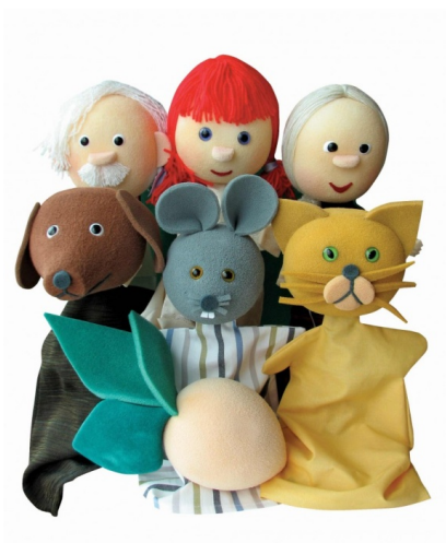
Slika 1. Ginjol lutka

Lutka se na ruku stavlja tako da kažiprst drži i upravlja lutkinom glavom dok su na srednjem ili na malom prstu i na palcu lutkine ruke. Ukoliko mičemo rukom i sagibamo je u ručnom zglobu i lutka izgleda kao da se sagiba i miče.