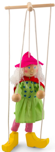
Slika 3. Marioneta