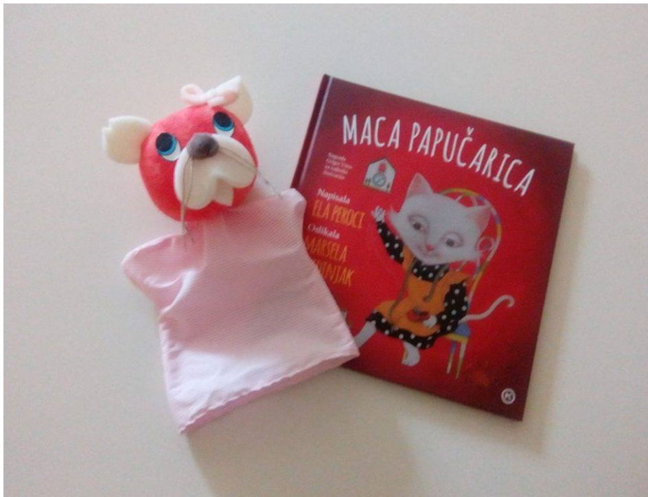
Slika 10. Ginjol lutka Maca Papučarica i istoimena slikovnica

Tako upotrebljavajući lutku, prema Hiceli, odgojitelji najčešće žele uspostaviti i održati pozitivnu komunikaciju s djecom, te poticati razvoj kulturno-higijenskih i radnih navika djece. Lutka zaokuplja te usmjerava pažnju djeteta, najavljuje ponašanje koje se očekuje od djeteta u određenoj situaciji. (Hicela, 2010.) Na taj način lutka postaje dio svakodnevnne stvarnosti u vrtiću, poseban prijatelj u igri i iskustvu djeteta.