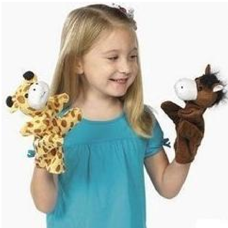
Slika 9. Lutka, partner u igri