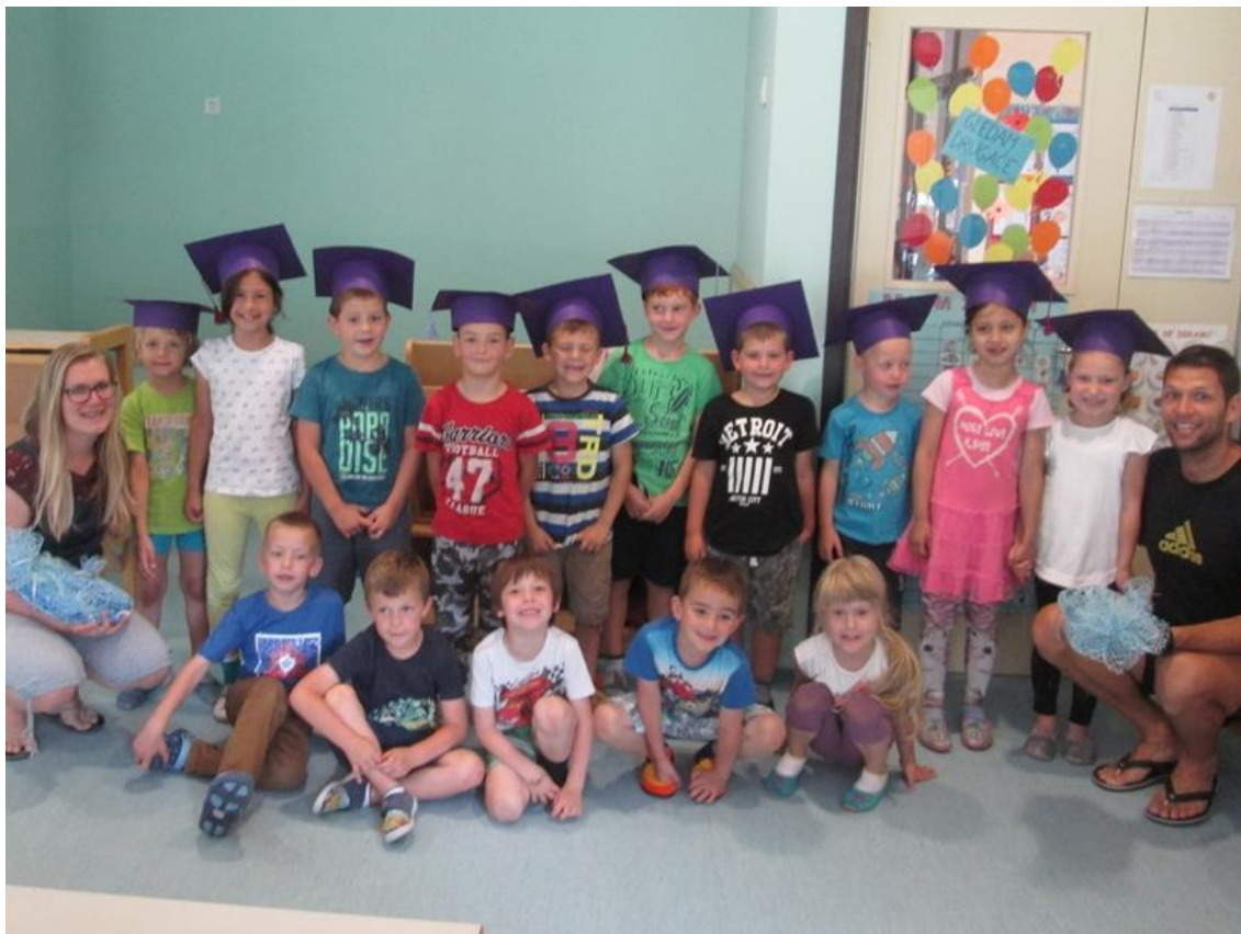
Slika 60: Zaključno fotografiranje