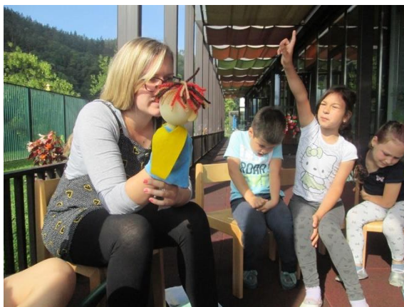
Slika 24: Delitev nalog

Lutka je vodila pogovor o tem, kako bi si razdelili naloge. Deček M. je ugotavljal, da bi se lahko tako kot po navadi primagnetili. To pomeni, da si vsak otrok za svoj znak, v enem od koticikov, poišče prost magnet. Tako bi vsak urejal kotichek, v katerem je. Otroci so razmišljali, da nekateri koticiki ne bodo očiščeni, če se vanje nihče ne primagneti. Odločili smo