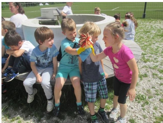
Slika 34: Igra na igrišču v Planici

drug drugemu prirejali kratke predstave, o tem, kaj bo Bučko naredil, ko bo zagledal Bedanca. Ustvarjanje otrok je bilo malo omejeno, saj so morali biti pripeti, prav tako so bila naslonjala sedežev visoka. Na ta način so otroci predelovali svoje strahove in preizkušali možnosti izpeljave dogodkov.