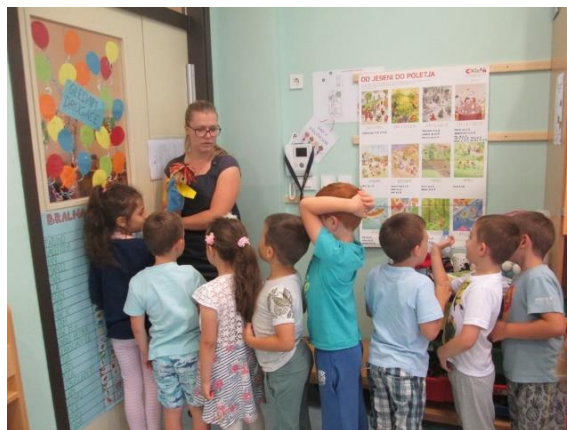
Slika 27: Podajanje navodil

Tokrat smo se v jutranjem krogu skupaj z Bučkom pogovarjali o četrtkovem izletu v Kekčevo deželjo. Pogovorili smo se, kdo je Kekec in kje živi, pogledali smo nekaj fotografij Kekca, Pehte, Bedanca, Mojce in