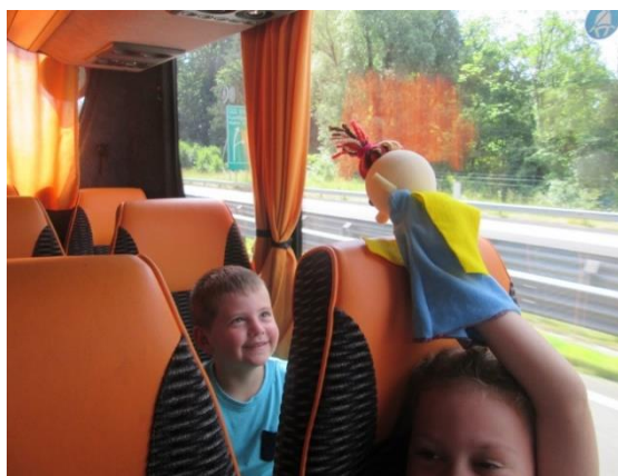
Slika 33: Mini predstave

Vstopili smo na avtobus in se skupaj z lutko odpravili na Gorenjsko. Bučko je otrokom krajšal čas med vožnjo, z njim so se pogovarjali, mu delali frizure, se slikali in igrali. Vsak od otrok je komaj čakal, da Bučko pride tudi do njega. Zanimivo je bilo, kako zelo je lutka otroke zamotila, saj so me le redki vprašali, kdaj bomo na cilju. Z Lutko smo na avtobusu