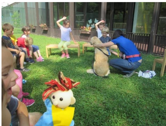
Slika 43: Otroci pristopajo do psa