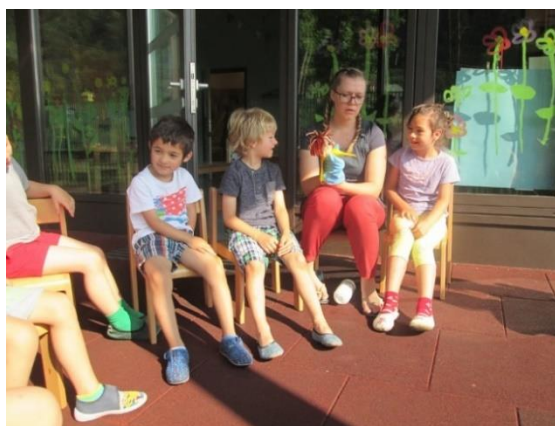
Slika 4: Spoznavanje Bučka

Menim, da sem lutko uspešno pripeljala nazaj in da so otroci začutili energijo, ki sem jo poskušala preliti v lutko. Lutki smo na podlagi videza in moje animacije oblikovali tudi njeno osebnost. Bučka sem si zamislila kot zelo prijaznega, pogumnega, poštenega in malo nagajivega fantiča. Na začetku sem imela kar nekaj treme, saj me je bilo malo strah, ali mi bo to sploh uspelo in ali se bodo otroci obračali name ali na lutko. Otroci so lutki