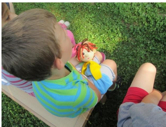
Slika 45. Bučko v naročju