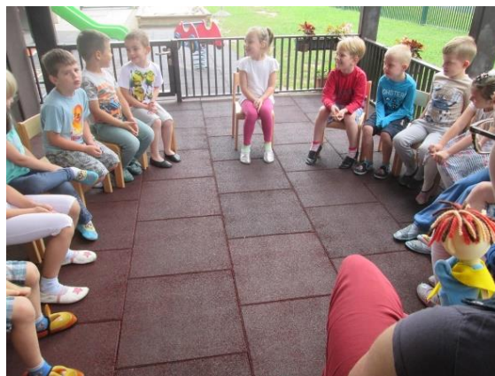
Slika 10 Načrtovanje Bučkovega kotička