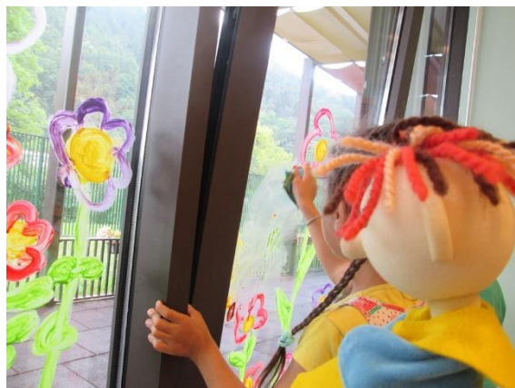
Slika 25: Čiščenje oken

Pogosto so ga namreč poklicali in mu povedali, kdo noče poslušati in kaj je kdo naredil, na način, ki ni bil obtožba določenega otroka, kot običajno otroci svoje težave predstavijo meni, ampak v obliki prošnje, naj jim pomaga, ker ga nekdo drug noče poslušati, ga ubogati.