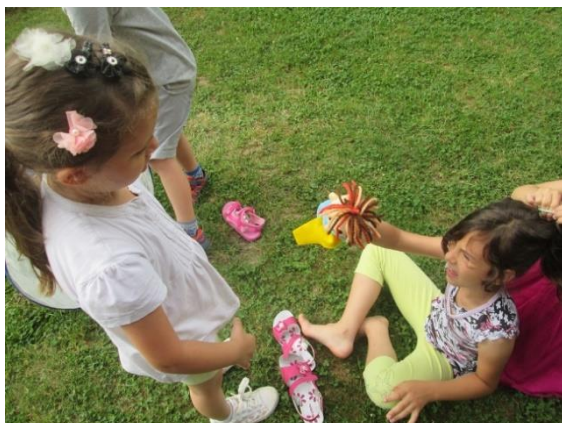
Slika 40: Ponavljanje deklamacije pri igri na igrišču

Po igri v kotičkih smo sedli na teraso, kjer nas je Bučko naučil novo deklamacijo z naslovom Že od jutra si prepevam , avtorice Anje Štefan. Pri učenju pesmi smo si pomagali tudi z različnimi gibi, s katerimi so si otroci besedilo hitreje zapomnili. Otroci so Bučka pri učenju pozorno poslušali in ponavljali za njim. Med dejavnostjo se deček, ki ima lažje vedenjske motne, ni mogel umiriti, zato sem ga poklicala k sebi, da sta z lutko skupaj ponovila pesem, na ta način se je pomiril in lažje osredotočil na besedilo. Tako je uspelo, da smo se v grobem pesem naučili vsi. Presenetilo me je, da so jo otroci želeli še in še ponavljati, saj se navadno učenja pesmi hitro naveličajo.