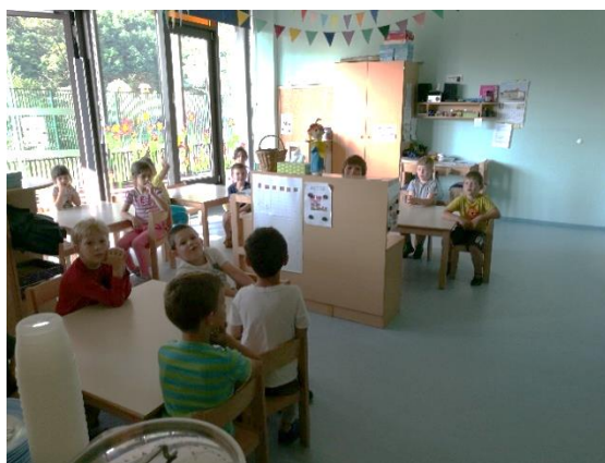
Slika 2: Pospravljena igralnica