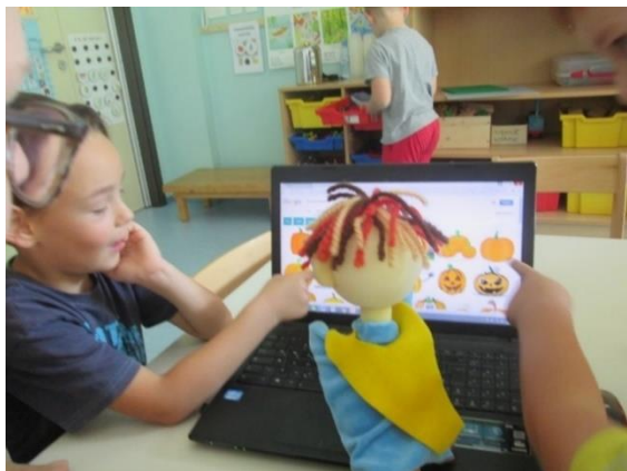
Slika 16: Izbira Bučkovega znaka