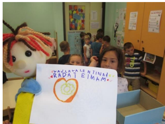
Slika 55: Bučko se zahvali deklici