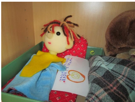
Slika 54: Prijazno sporočilo za Bučka

bila kar malo ganjena. Bučko se je deklici seveda zahvalil in se pridružil pogovoru za mizami.