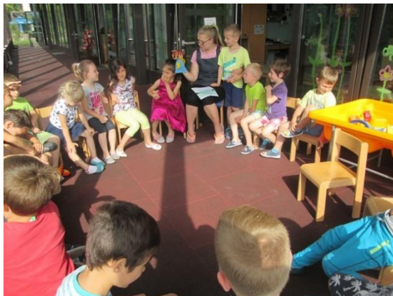
Slika 38: Učenje deklamacije

temu, da sem bolj osredotočena na otroke tudi v času proste igre otrok. Največja sprememba, ki sem jo opazila, pa je znižana glasnost med prosto igro. Menim, da je k temu pripomogla tudi moja pogostejša vključenost v njihovo igro, ki jo od mene zahteva lutka. Otroci so lutko vzeli za svojo, zanjo lepo skrbijo, se z njo pogovarjajo, igrajo in jo vsepovsod vzamejo s seboj. Bučko je postal ljubljenec naše skupine.