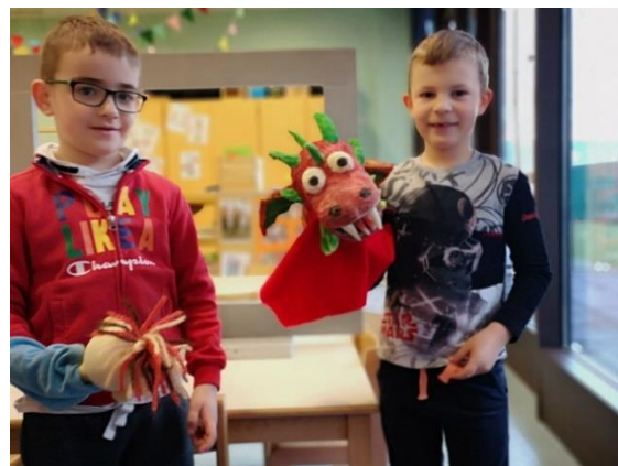
Slika 47: Priklon

Otrokom sem s tem omogočila dramsko ustvarjanje skozi igro. Otroci so se sprostiti in sploh niso opazili, da nastopajo. Dejavnost ni stremela k perfekcionizmu, zato so bili pri njej uspešni vsi otroci. Sledili so lahko intuiciji in idejam, ker pa so nastopale lutke, so si upali bistveno več. Pri igri sem se zabavala tudi jaz, saj so bile nekatere predstave zares dobre. Na začetku sem v predstavah pogosto sodelovala, ker je otroke vleklo v vsebine risank, ki imajo pogosto tudi neprimerno, nasilno tematiko. Pozneje, ko sem z lastnim animiranjem in vzorom otrokom pokazala drugačne možnosti izvedbe in tematike, sem v kotičku ostala le kot gledalka.