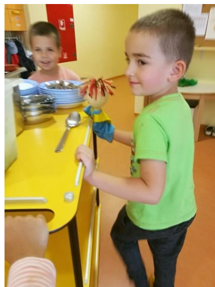
Slika 15: Priprava na zajtrk

Otrokom sem omogočila, da z lutko ustvarjajo in si izmišljujejo dogodke. To so otroci z veseljem storili in me pogosto presenetili. Trudila sem se, da bi se otroci ob lutki počutili čim bolj svobodno v besedi in dogajanju. Dogodke sem prekinila le v redkih primerih, ko so Bučka animirali na neprimeren način, ali pa so se z njim neprimerno pogovarjali z drugimi otroki. Takrat sem jih opomnila, da je Bučko zelo prijazen. Želela sem doseči, da bi Bučko postal pozitiven lik, ki bi otroke spodbujal k sodelovanju, kompromisom in k dobrim odnosom. Pri animiranju lutke sem se nekoliko sprostita, saj so otroci zapopadli v resničnost Bučka.