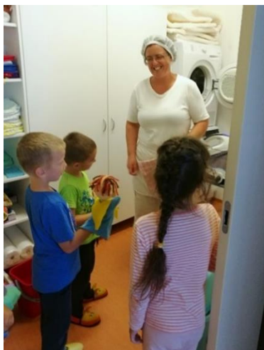
Slika 5: V pralnici

misli pa so bile predane dejavnostim, ki sem jih z njo izvajala. Z lutko sem poskušala biti kar se da odzivna, prav tako pa sem se trudila, da bi res ves čas gledala lutko in ne otroke, kar pa je bil zame tudi poseben zalogaj. Otroci so namreč potrebovali odziv lutke in mene kot vzgojiteljice. Od mene so pričakovali zavzetost, pa tudi prilagodljivost, saj sem se držala pravila, da kar Bučko v mojih rokah obljubi, to tudi naredi.