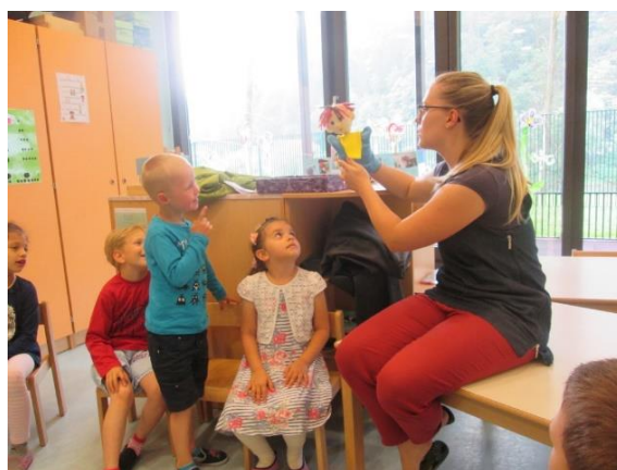
Slika 26: Jutranji krog

Po zajtrku sem otroke povabila v jutranji krog. Opazila sem, da otroci zelo hitro pripravijo za seboj in se pripravijo na srečanje z Bučkom. Med tem je manj preprirov, prav tako hitreje pridejo iz umivalnice. Lutka je pripomogla k hitrejšemu in mirnejšemu prehodu med dnevno rutino. Otrok ne potrebujem toliko opozarjati in nadzirati. S tem se je izboljšalo moje razpoloženje in sproščenost skupine.