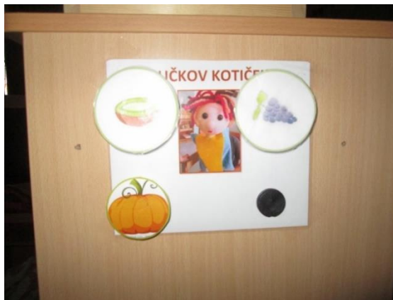
Slika 17: Urejanje table