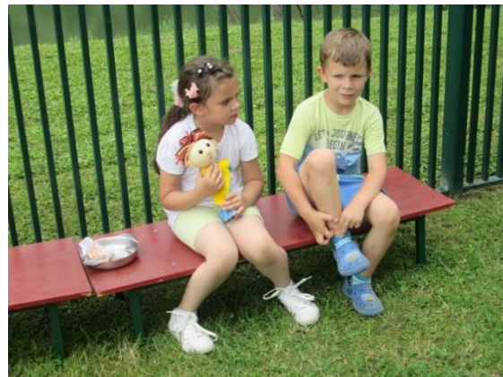
Slika 23: Pogovor deklice in dečka s pomočjo lutke

Otroci so lutko v tem tednu zelo lepo sprejeli kot novega člana skupine. To smo dosegli z novim kotičkom, z Bučkovim znakom, z novim magnetom na igralni tabli, ki označuje otroke Modre skupine. To smo dosegli s tem, da za lutko veljajo enaka pravila kot za vse druge otroke. Bučko mora poslušati, ko drugi govorijo, se postaviti v kolono, ne sme goljufati pri namiznih igrah, biti mora prijazen do ostalih otrok ... Lutka je otrokom zelo všeč in je zato tudi zaželena kot igralni partner pri različnih igrah. Lutki je uspelo, da so se ji otroci odprli, ji povedali, kdo so in kaj imajo radi, nekateri bolj in drugi malo manj, vendar so z njo želeli komunicirati vsi. Opazila sem, da so komaj čakali, kdaj jo bom vzela v roke in si želeli vsakega trenutka z njo. Proti koncu tedna sem se v igri z lutko sprostila tudi sama in opazila sem, da so se prav tako sprostiti otroci. Naloga, ki sem si jo zadala, pa tudi animacija lutke, je povzročila, da sem otroke začela še bolj opazovati in razmišljati o njihovih interakcijah. Prav tako sem se v tem tednu veliko več igrala z otroki in se z njimi pogovarjala, zato sem otroke še bolj spoznala. Vse to je povzročilo, da se je vzdušje v skupini z vsakim dnem bolj spreminjalo.