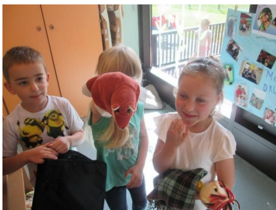
Slika 13: Izbiranje drugih lutk in igrač