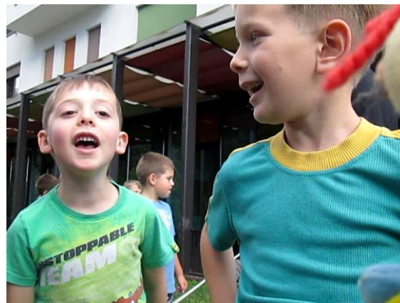
Slika 31: Sestanek ekipe