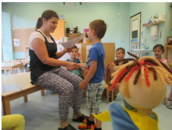
Slika 56: Podelitev priznanj

Petek je bil za otroke in za Bučka zaključek vrtca in druženja. Nekateri otroci so se namreč s prihajajočim mesecem izpisali, nekateri pa so odhajali v združena varstva v druge enote vrtca.