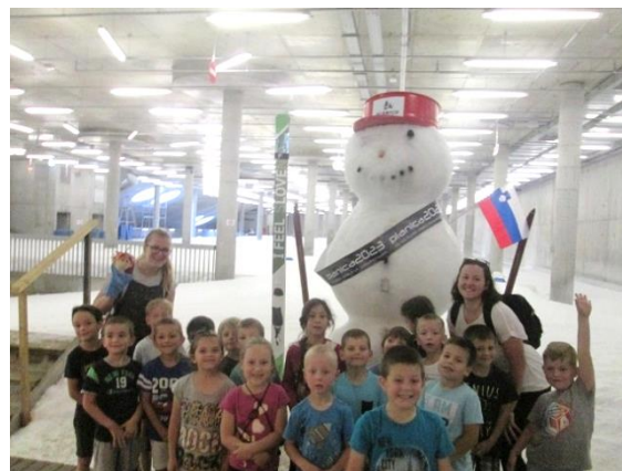
Slika 35: V Nordijskem centru