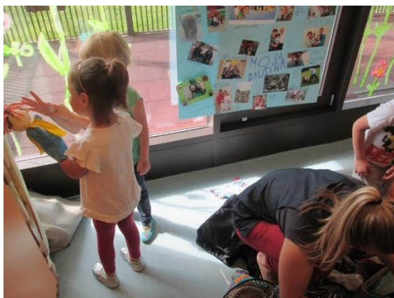
Slika 11: Urejanje kotička