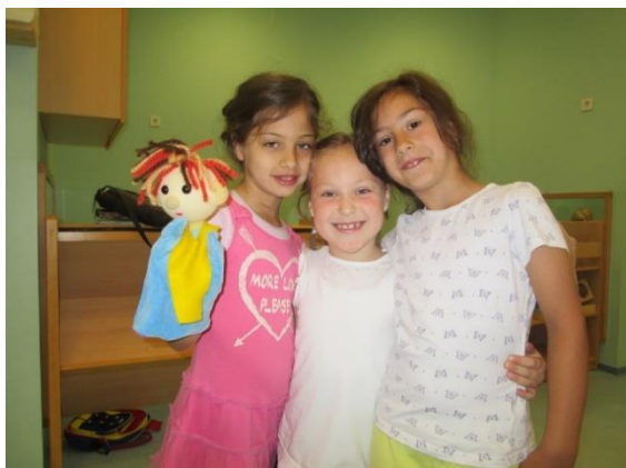
Slika 58. Fotografiranje z Bučkom

Bučko je otroke na koncu še fotografiral. Otroci in starši so za delavce enote pripravili majhne pozornosti in se jim s tem zahvalili za skupne trenutke.