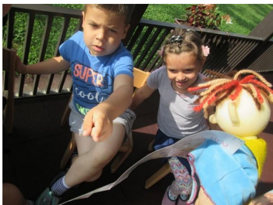
Slika 48: Razmišljanje o dejavnostih s pomočjo fotografij