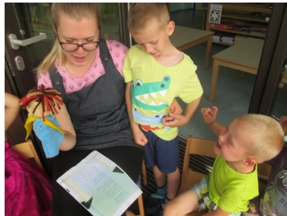
Slika 39: Bučko in deček skupaj ponovita pesem

Po igri v kotičkih smo sedli na teraso, kjer nas je Bučko naučil novo deklamacijo z naslovom Že od jutra si prepevam , avtorice Anje Štefan. Pri učenju pesmi smo si pomagali tudi z različnimi gibi, s katerimi so si otroci besedilo hitreje zapomnili. Otroci so Bučka pri učenju pozorno poslušali in ponavljali za njim. Med dejavnostjo se deček, ki ima lažje vedenjske motne, ni mogel umiriti, zato sem ga poklicala k sebi, da sta z lutko skupaj ponovila pesem, na ta način se je pomiril in lažje osredotočil na besedilo. Tako je uspelo, da smo se v grobem pesem naučili vsi. Presenetilo me je, da so jo otroci želeli še in še ponavljati, saj se navadno učenja pesmi hitro naveličajo.