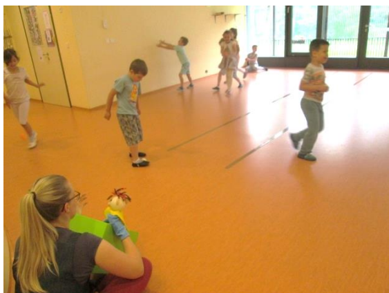
Slika 28: Gibalne naloge ob igranju kahona

Bučko nas je nato povabil v telovadnico in nam pokazal nekaj telovadnih vaj, ki se jih je naučil v šoli. Otroci so ga pozorno poslušali in aktivno sodelovali. Otroci so se postavili v kolono, kjer je lutka podala prva navodila. Otroci so se morali razdeliti v dve enako številčni skupini in sestiti k stenama. Naloga jim je odlično uspela, saj so se pri deljenju dogovarjali, se preštevali in se zelo hitro dogovorili, katera skupina bo sedla h kateri steni. Navadno, jim takšnega navodila ni uspelo izvesti, ali pa so zato potrebovali dalj časa, saj se med seboj niso poslušali, s tem pa je bilo tudi nekaj slabe volje. Lutka je bila za vse takšna motivacija, da so zanjo nalogo želeli opraviti vsi. Bučko je njihovo hitro sodelovanje pohvalil, kar jim je vlilo še dodatno motivacijo.