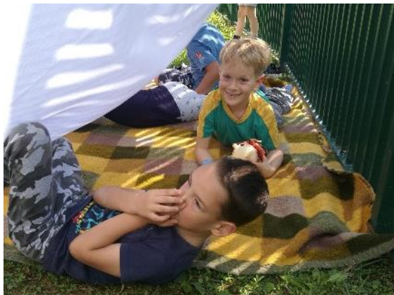
Slika 22: V "Bučkovem šotorčku"

običajno ni uporabljala. Lutko je uporabila kot posrednika za komunikacijo. Otroka sta bila zato bolj suverena v svojem govoru in sta zato mnogo več komunicirala kot bi sicer.