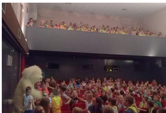
Slika 53: Obisk Tačka po predstavi

Po počitku so otroci popoldan preživeli nekoliko drugače kot po navadi. Zdelo se je, da jih je jutranji pogovor malce pretresel. Namesto da bi se igrali kot po navadi, so sedeli za mizo in se pogovarjali, kam bodo šli in koga vse bodo pogrešali. Zdelo se je kot da se med seboj poslavljajo. Nekateri otroci so narisali risbice in jih podarili svojim prijateljem. Ko sem prišla v Bučkov kotiček, sem ob Bučku našla sporočilo zanj. Ob darilu deklice sem