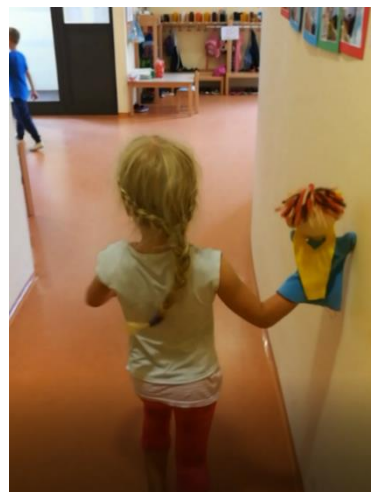
Slika 7: Z Bučkom po vrtcu