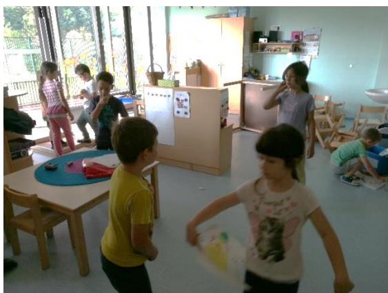
Slika 1: Prihod v igralnico

V jutranjem krogu je Bučko sodeloval kot enakovreden član, vsi otroci so se mu predstavili, na koncu pa se je predstavil tudi on, otroci so ga imeli priložnost izprašati o vsem, kar jih je zanimalo o njem. Najbolj jih je zanimalo, kaj je Bučko počel v šoli in kje je spal, ko je bil tam. V nadaljevanju smo se igrali v koticčkih. Otroci so Bučku razkazali igralnico in vse koticčke.