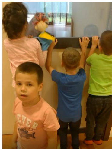
Slika 6: Soba z žogicami