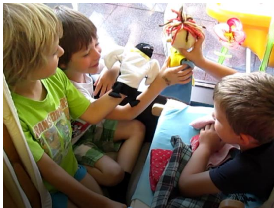
Slika 18: Igra v Bučkovem kottičku

Otroci so Bučka povabili v različne kотиčke. Največ se je igral v Bučkovem kottičku, kjer so trije dečki razvili zelo zanimivo igro med različnimi lutkami, Bučkom in njimi. Na začetku igre so določili pravila: kje je morje, kje je dom in kje severni tečaj, vsem lutkam so tudi določili imena. Nato so se tako kot pri igri Muca Copatarica, ki smo jo igrali v prejšnjih mesecih, klicali med seboj in se obiskovali. Lutka je bila v tem delu spodbuda za sociodramsko igro ter obogatitev pri oblikovanju zgodb. K igri z lutko sem spodbujala tudi tujejezične otroke, saj sem opazila, da so pri komunikaciji skozi lutko bolj sproščeni.