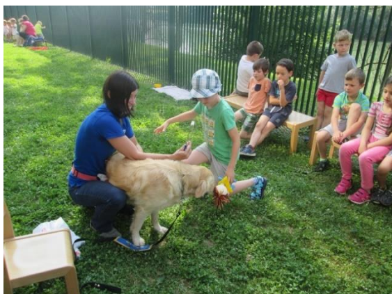
Slika 44: Deček s pomočjo lutke premaga strah