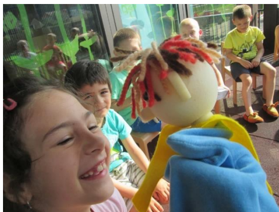
Slika 49: Deklica opiše njen najljubši trenutek z lutko

Na ta način smo se spomnili dogodkov prejšnjih tednov in evalvirali, kaj je bilo otrokom najbolj všeč in kaj jim je ostalo v spominu. Ob spominjanju vsega doživetega sem se počutila zelo dobro, saj sem z lutko skupino uspela povezati. Lutka je za nas postala vezni člen. Dejavnosti so postale bolj zaželenne s strani več otrok kot prej. Prek nje sem se z otroki povezala in nekatere tudi bolj spoznala. S pomočjo igre z lutko in dejavnosti, ki sem jih izvajala, sem ugotovila tudi to, da se z nekaterimi otroki redkeje pogovarjam in jih zato tudi manj poznam. To sem poskušala skozi tedne ozavestiti in spremeniti. Spoznala sem tudi igrive plati otrok, ki je običajno ne pokažejo v neposrednem komuniciranju z menoj. Lutka je vse to omogočila. Otroci so se sprostili v odnosu z