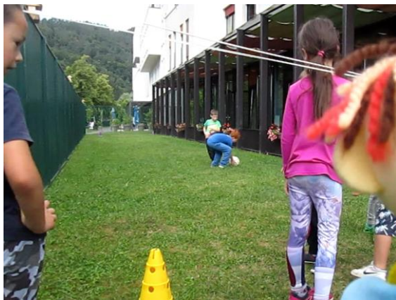
Slika 30: Na nogometnem igrišču