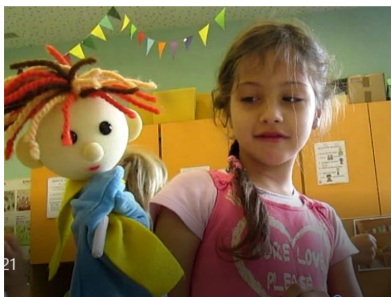
Slika 19: Bučko v ustvarjalnem kottičku

Opazila sem tudi, kako je deklica A. v ustvarjalnem kottičku skupaj z Bučkom prijela flumaster in vadila različne črke. Z igro je pritegnila tudi ostale deklice, da so ponavljale to, kar je napisala z lutko. Zanimivo je bilo, da deklica A. ni bila užaljena ali jezna na ostale, saj se je običajno pritoževala, kadar je katera od njih ponavljala za njo, z lutko ji je bilo to celo všeč. Z lutko je tako zmogla preseči samo sebe in se tako učila novih socialnih veščin.