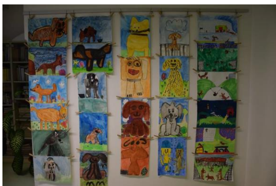
Slika 52: Razstava otroških del

Po jutranjem krogu smo obiskali Tačkov festival, kjer smo si v Knjižnici Litija ogledali razstavo otroških del, nato pa smo si ogledali predstavo z naslovom Bodi moj prijatelj, Društva za boljši svet. Po predstavi pa je otroke obiskal Taček. Otroci so pred dvorano srečali tudi pse vodnike. Bili so ponosni, saj so sedaj vedeli, kako ravnati ob srečanju s psom. Z nami je v svojem nahrbtniku šel tudi Bučko.