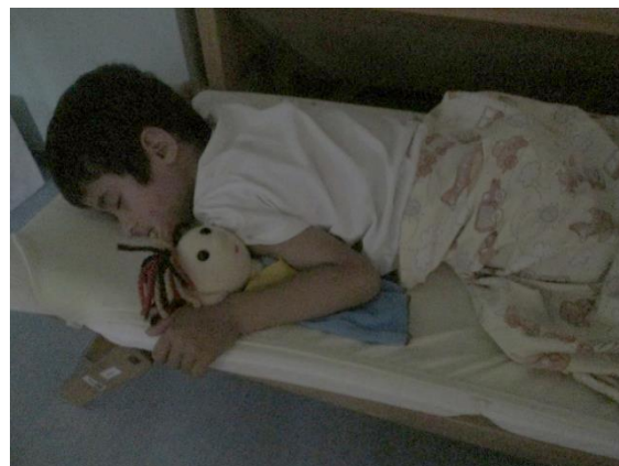
Slika 41: Bučko pri počitku