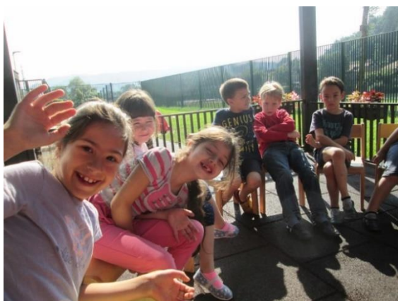
Slika 3: Jutranji krog