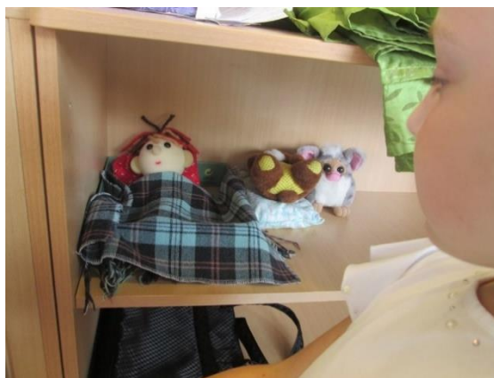
Slika 12: Bučkov kotiček