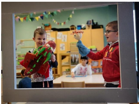
Slika 46: Mini predstava Bučkovega rojstnega dne

Opazila sem, da imajo nekateri otroci težavo pri izmišljanju svoje zgodbe, zato je bilo dobro, da so si lahko pri iskanju z zamisli pomagali s knjigami.