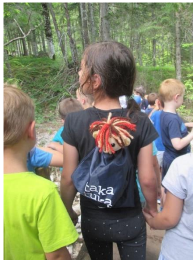
Slika 37: Po Kekčevih poteh

Po razburljivem doživetju smo se z avtobusom odpeljali proti domu, kjer je veliko otrok zaspalo in tako je z dečkom M. zaspal tudi Bučko. Zanimivo je bilo, da mu budni otroci niso želeli vzeti lutke, ker se z njo ne igra, ampak so govorili: »Psst, tiho, Bučko spi,« kar se me je še posebej dotaknilo. Lutka je v tem dnevu otroke povezovala in jih spodbujala k prijaznosti in obzirnosti drug do drugega. Krajšala je čas med vožnjo na avtobusu in med čakanjem na Bedančev avtobus. Pomagala jim je prebroditi strahove.