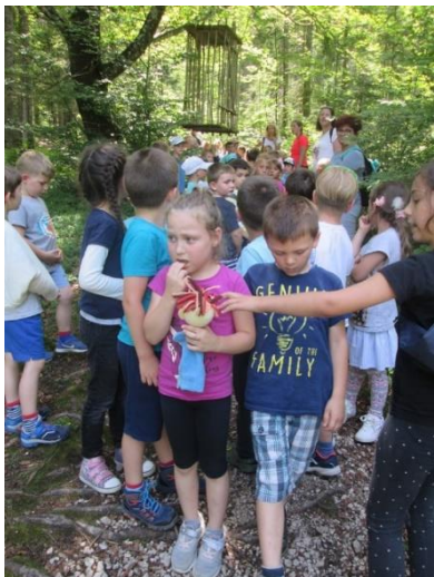
Slika 36: Premagovanje strahu s pomočjo lutke

opazila sem tudi, da so si lutko pogosto izmenjali sami, brez moje animacije lutke, kar pomeni, da so Bučkovo osebnost spoznali do te mere, da so razumeli, da si Bučko želi biti pri vsakemu otroku po malo.