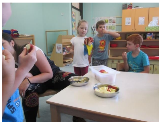
Slika 14: Pri sadni malici

Deklica E. z Bučkom v roki: »Mmm, kako je dobro jabolko, L., zakaj pa ti nič ne ješ?«