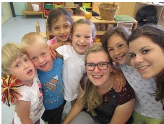
Slika 59: Druženje in ples

V nadaljevanju smo imeli skupno rajanje, na katerem smo zavrteli glasbene želje otrok. Kasneje smo se igrali namizne igre, se fotografirali in družili. Med dejavnostmi je bilo čutiti veliko povezanost in zadovoljstvo med otroki. Bilo mi je malo hudo, saj sem se poslavljala od svoje prve generacije otrok. Bučko je otroke povezal na različnih ravneh. Postal je avtoriteta, ki so si jo sami izbrali, njihov vzor, od katerega so se učili prosocialnega vedenja. Bučko je bil skozi tedne motivacija, ki je prej niso imeli. Bučko mi je pomagal pri izvedbi dejavnosti, ki so zaradi njegove prisotnosti za otroke postale zanimivejše. Meni kot pedagogu pa je olajšal samo izvedbo. Otroci so bili pozornejši, vztrajnejši in dejavnejši. S tem smo uspešno zaključili dejavnosti in se poslovili.