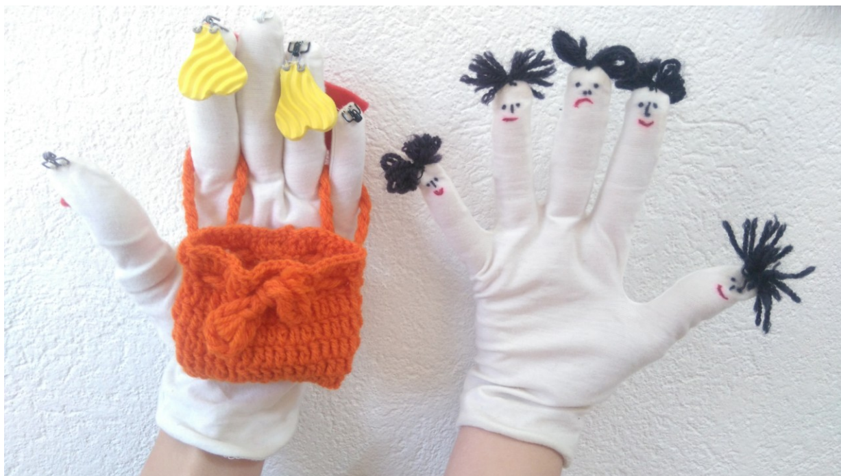
Slika 26: Prstni lutki: drevo in glava - igralci