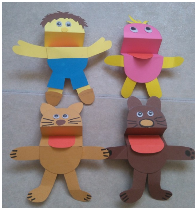
Slika 33: Prstne lutke: dedek, biba, muca, kuža