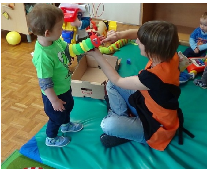
Slika 8: Izvajanje bibarije Gosenica