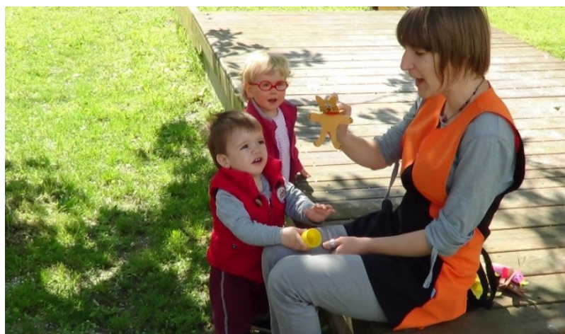
Slika 35: Izvajanje bibarije