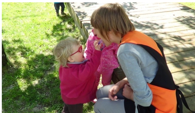
Slika 25: „...drugega pa mala miš