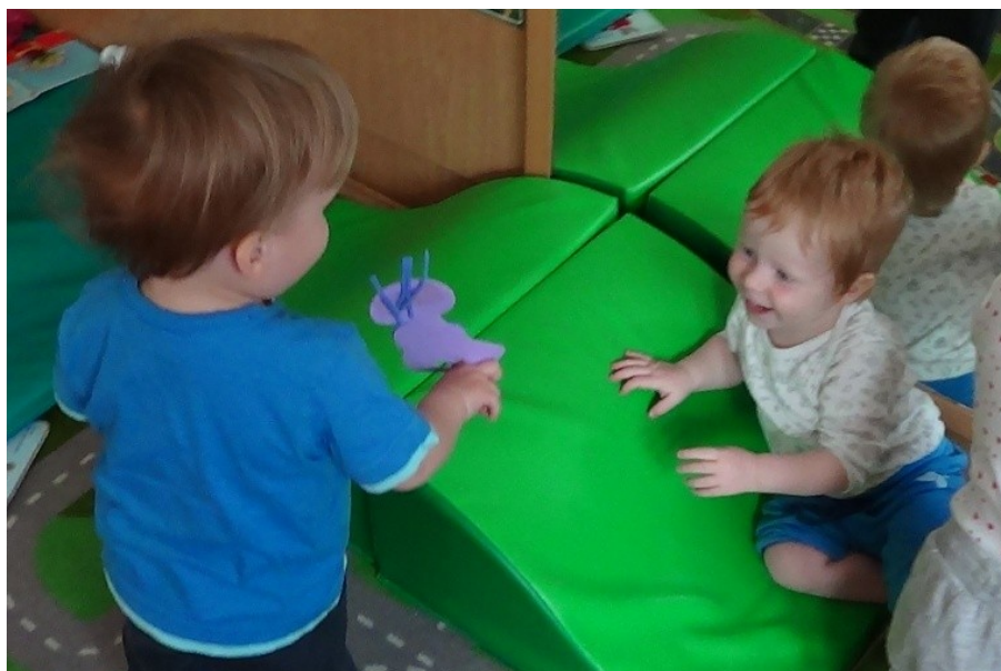
Slika 22: Fantek preko lutke vzpostavi komunikacijo