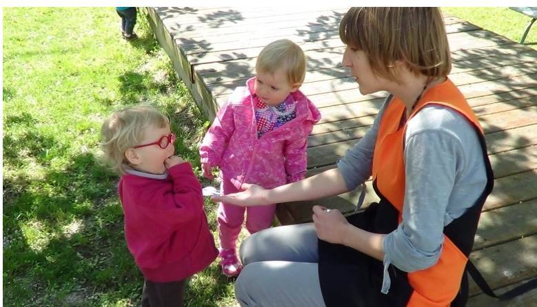
Slika 24: En kos ti dobiš,