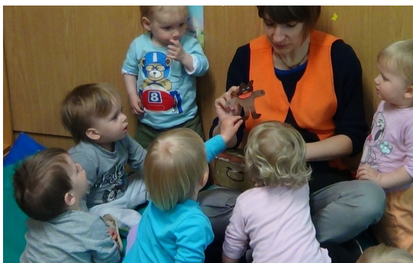
Slika 37: Le kaj se skriva v škatli?