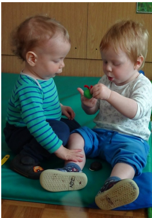
Slika 9: Igra z gosenico

Gosenico, narejeno iz nogavice, so otroci zelo radi sami natikali na roko (sebi ali pa drugim otrokom) in zraven izgovarjali besedilo. Sprva ob moji pomoči, kasneje pa vedno bolj samostojno.