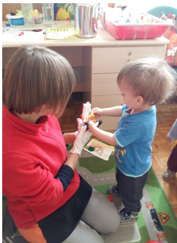
Slika 32: Hruške iz vreče