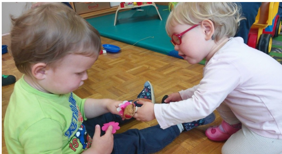
Slika 15: Fantek in deklica se igrata s prstnimi lutkami