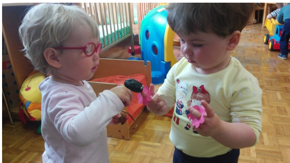
Slika 18: Deklici se igrata s prstnimi lutkami