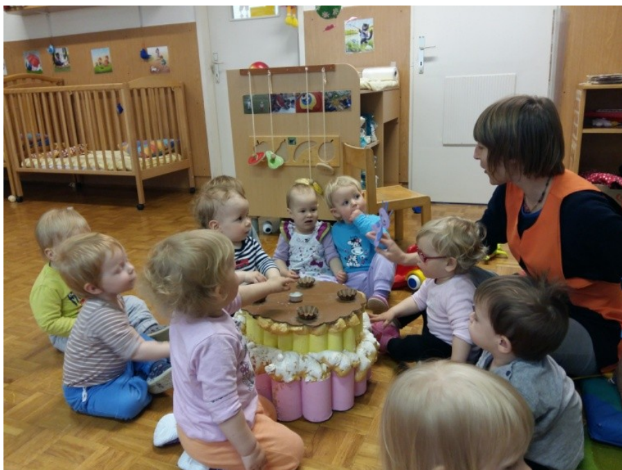
Slika 20: Izvajanje bibarije Biba torto meša

Enemu izmed fantkov je bila bibica Živa celo tako všeč, da je vsakič, ko se je spomnil nanjo, kazal na vrečko, v kateri sem imela shranjene lutke, in govoril: »Biba, biba.« Ko se je igral z njo, je hodil k drugim otrokom in zraven govoril:« Njam, njam, njam« in s tem povedal, kako biba torto je.