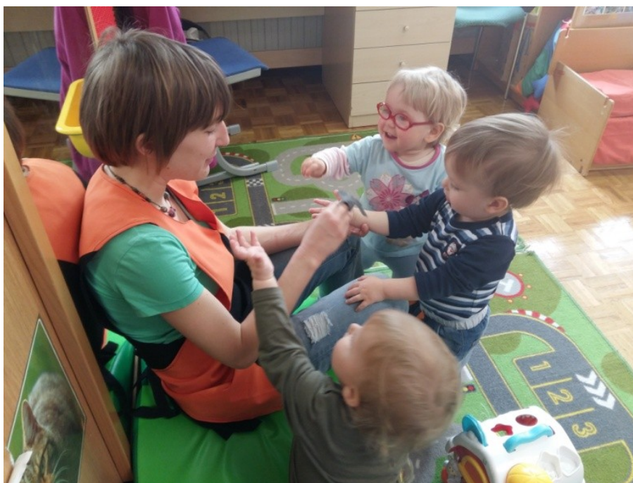
Slika 3: Bibarija: Miš iz luknje je pritekla