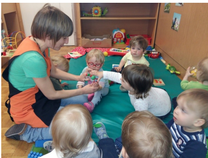
Slika 7: Izvajanje bibarije Gosenica

K enemu fantku pa, ko si je gosenico natikal na prst, je pristopil mlajši fantek in ga z zanimanjem opazoval. Med njima je stekla neverbalna komunikacija (mimika obraza, dotikanje) in tako sta si kar nekaj časa izmenjavala informacije. Lutka ju je povezala.