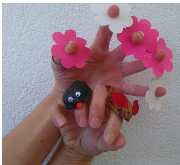
Slika 11: Prstne lutke: miška in krt, rožice