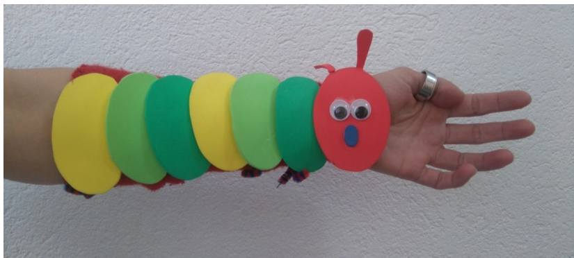
Slika 5: Lutka: gosenica

Gosenica je lezla, na mojo dlan prilezla. Je palček obiskala, kazalček požgečkala, sredinčku je požugala, prstancu zapela, mezinček pa objela.