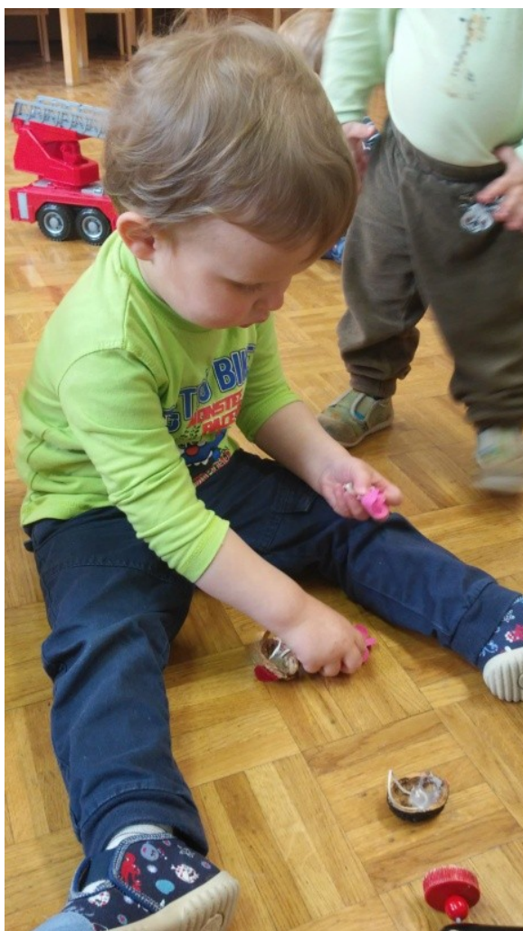
Slika 12: Igra fantka z lutkami miška in krt, rožice

Po večkratni uporabi lutke so otroci tudi sami začeli uporabljati le te. Igrali so se med sabo (eden je imel na prstih miško in krta, drugi rožice), spet drugi so na prste natikali samo rožice in z gibi izvajali bibarijo na svoji roki, nekateri pa so z lutko (krt ali miška) pristopili do mene. Zanimivo jih je bilo opazovati, kako prek lutk vzpostavljajo komunikacijo. Nekateri so pri tem že uporabljali besede (vrta, vrta, miška, krt, ninaj, nianj), spet drugi samo s kretnjami ali z različnimi glasovi (uuu, aaa).