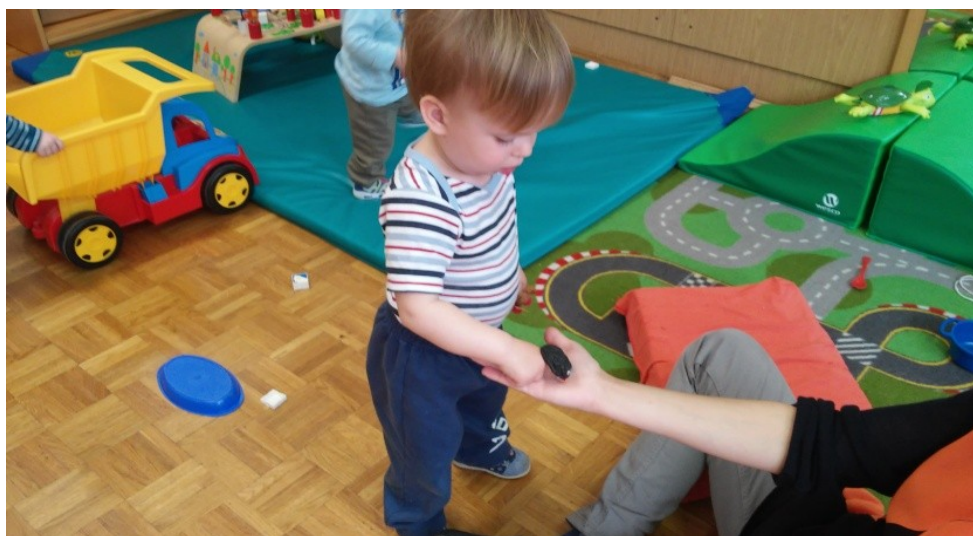
Slika 17: Fantek z gibanjem izvaja bibarijo na moji roki