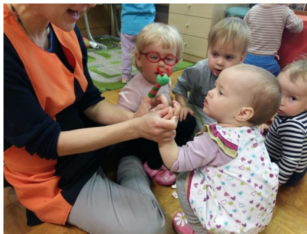
Slika 10: Izvajanje bibarije Gosenica