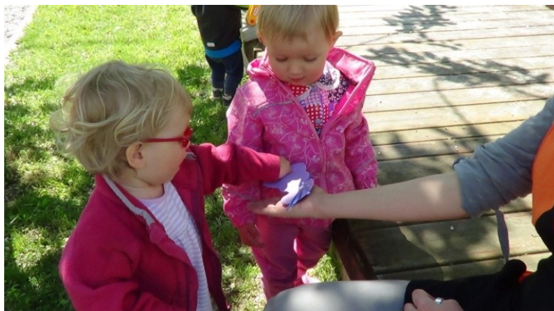
Slika 23: Biba torto meša