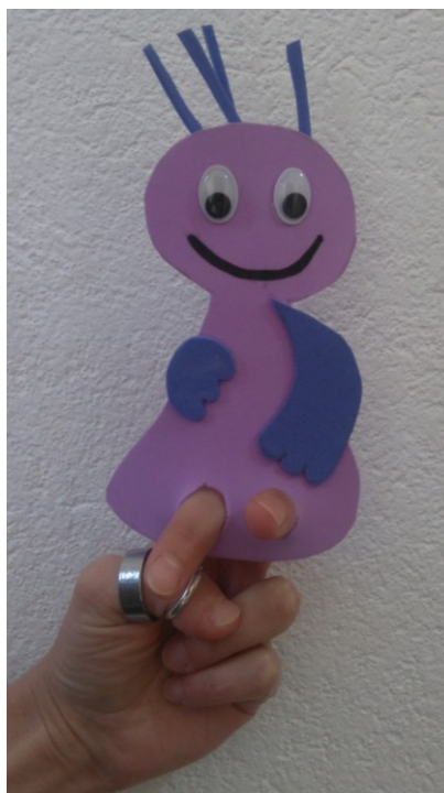
Slika 19: Prstna lutka: bibica Živa

En kos torte ti dobiš, drugega pa mala miš.