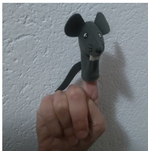
Slika 2: Prstna lutka: miška