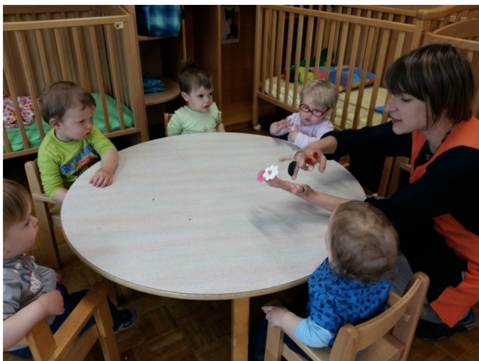
Slika 14: Izvajanje bibarije Miška in krt