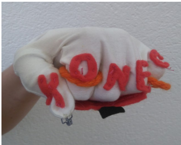
Slika 28: Leva rokavica z napisom