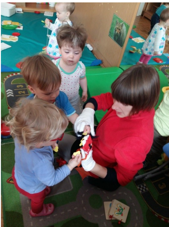
Slika 31: Hruške v vrečo