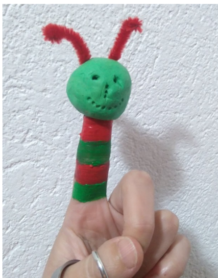
Slika 6: Prstna lutka: gosenica

Pri tej lutki je prst (kazalec) pobarvan s prstnimi barvami (rdeča, zelena), glava gosenice je izdelana iz plastelina, tipalke pa so iz kosmate žice.