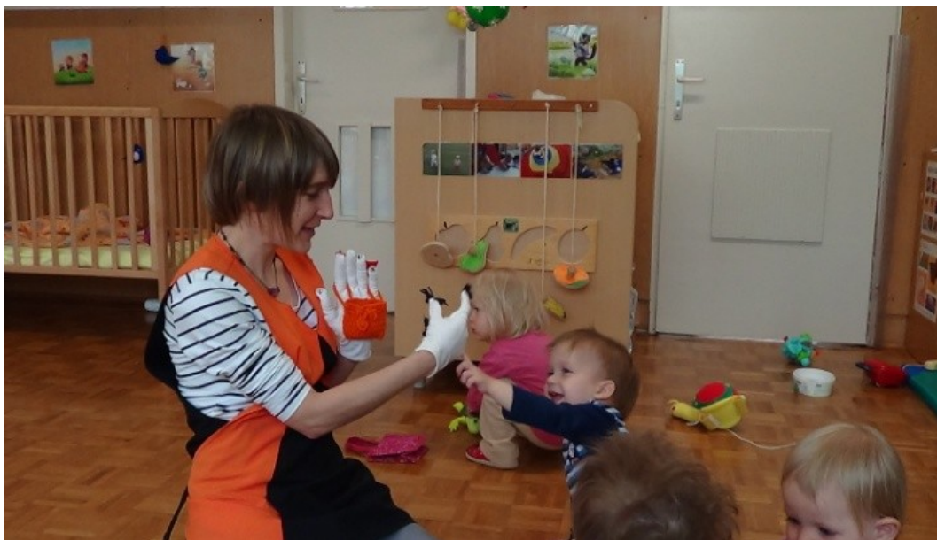
Slika 29: Ta z drevesa hruške stresa