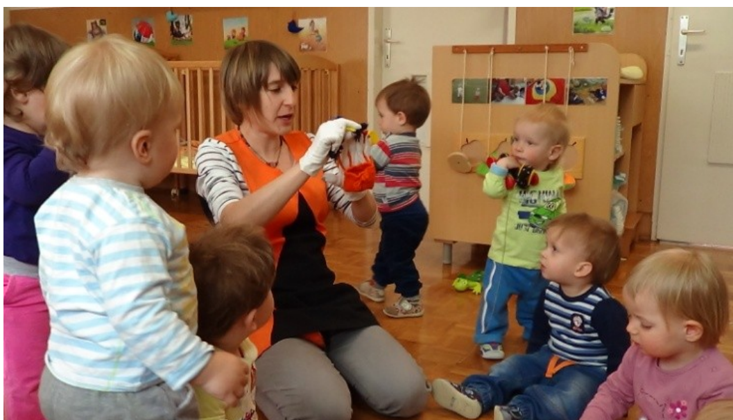
Slika 30: Ta jih meče v prazne vreče