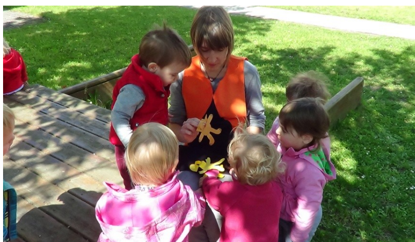
Slika 36: Otroci raziskujejo lutke