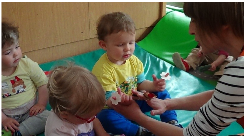
Slika 13: Izvajanje bibarije Miška in krt