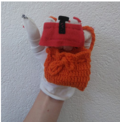
Slika 27: Leva rokavica