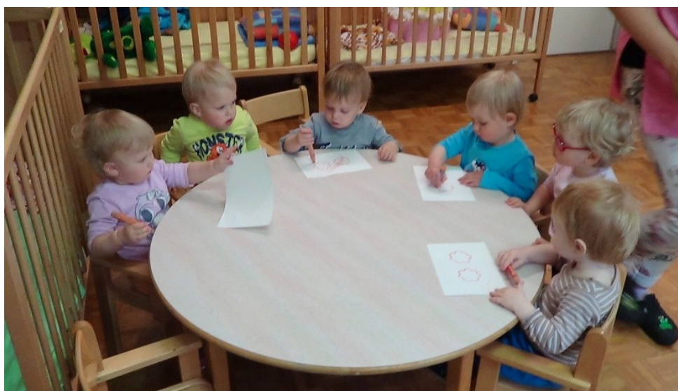
Slika 16: Barvanje rožic z barvicami