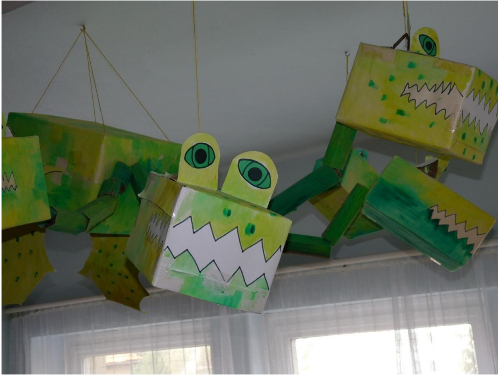
Velká loutka - drak z papírových krabic vytvořený s pomocí dětí.