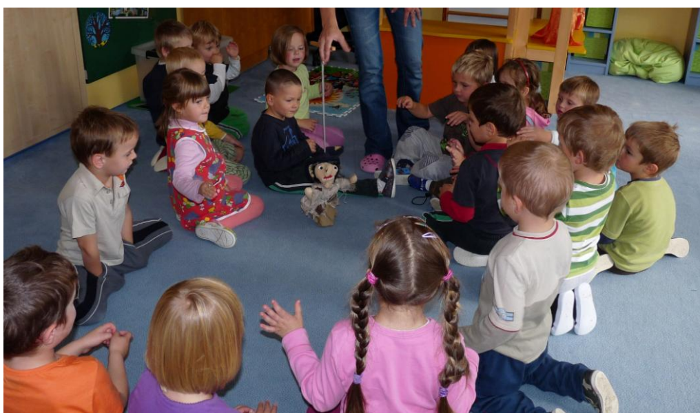
Povídání s pohádkovou ježibabou o jejích čarových dovednostech odráží v projevech dětí jistý odstup od loutky a zároveň tak ukazuje přijetí fiktivnosti, v podobě obav z jejích magických schopností.