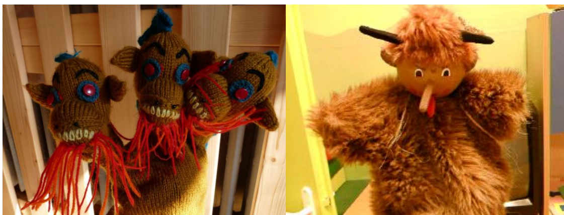
Kouzlo ručně vyrobeného maňáska draka a čerta.