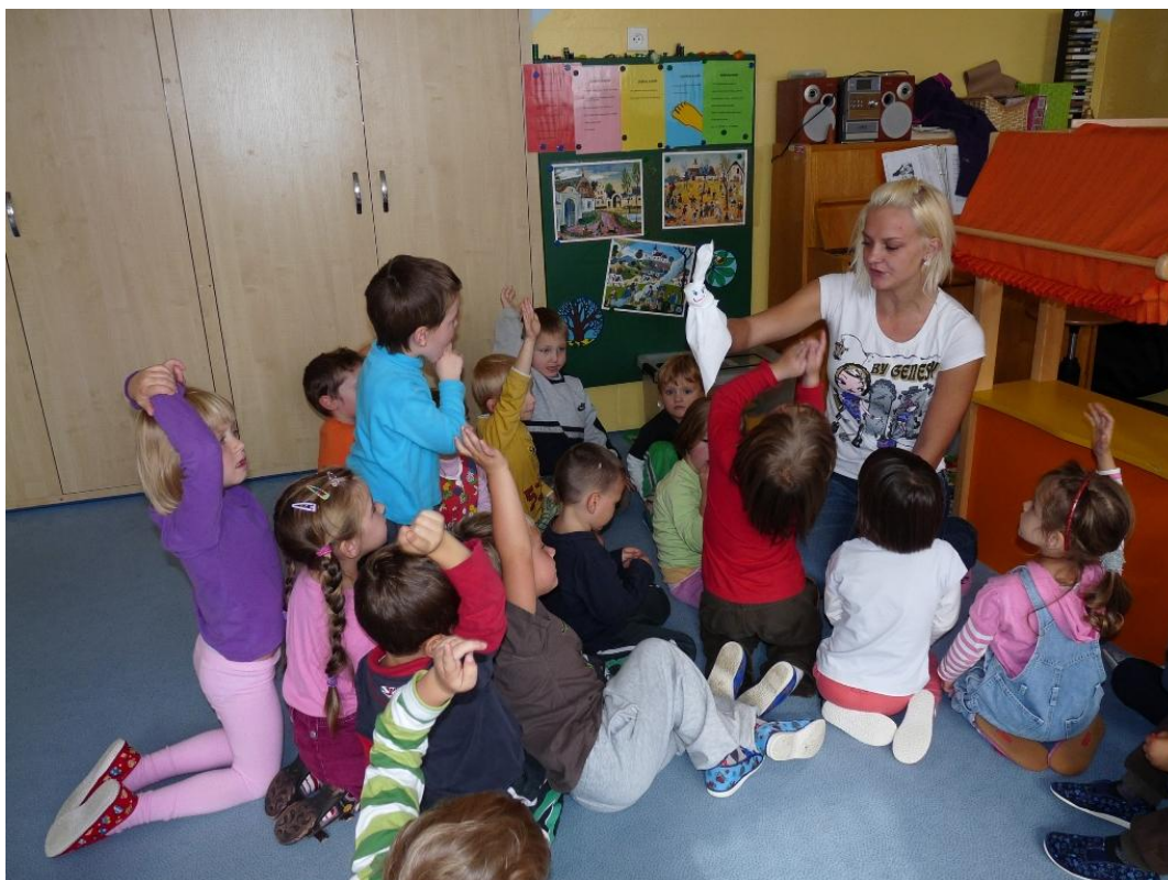
Strašidýlko z plátna jako improvizovaná loutka.