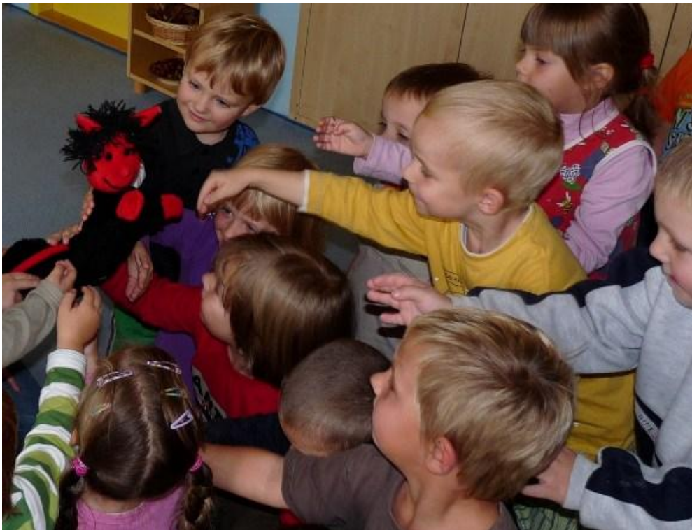
Logopedické hry s čertíkem.