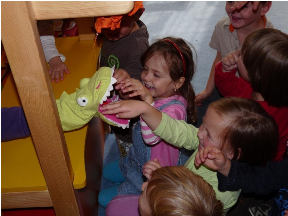
Nadšení dětí při činnosti s maňáskem s otevírací pusou.