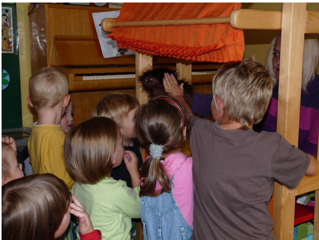
Loutkový ježek láká děti svým chlupatým kožíškem, představujícím bodliny, k pohlázení.