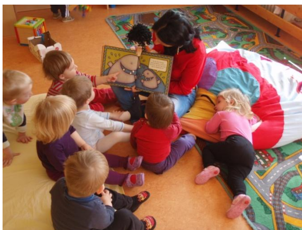
Slika 19: Sodelovanje otrok.