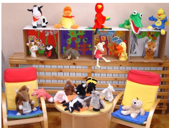
Slika 31: Urejen lutkovni kotiček.