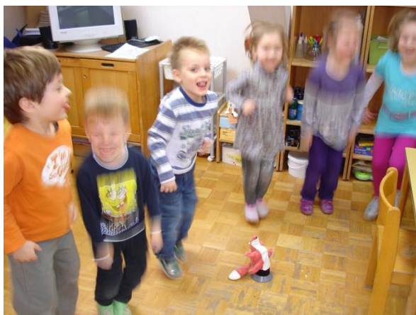
Slika 40: Poskoki.