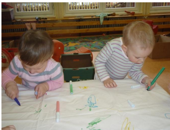
Slika 2: Slikanje na blago.

V oddelek smo prišli ob 6.30 uri. Odločili smo se, da si bomo skupaj z otroki izdelali svojo lutko. Otrokom smo na mizo razgrnili velik kos blaga, katerega so porisali s flomastri. Poslikano blago smo odnesli v sosednjo igralnico, kjer nam je ena od vzgojiteljic ukrojila obleko in jo sešila. V kroglo iz stiropora, ki smo jo vzeli za glavo, smo naredili luknjo in vanjo potisnili tulec iz kartona. Iz volne smo naredili lase, jih prilepili na glavo. Nanjo smo prilepili tudi oči in usta, ter s črnim flomastrom narisali nos. Tako smo dobili lutko fantka, ki smo ga poimenovali Miha. Miha je nastajal skozi vse dopoldne. Otroci so pri nastajanju fantka lepo sodelovali. Ta dan so se otroci z Mihom spoznavali, rokovali.