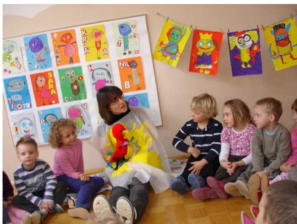
Slika 26: Lumpa pripoveduje.