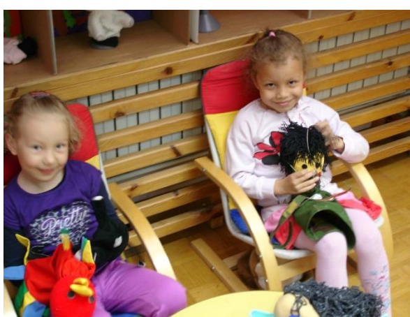
Slika 37: Sproščena igra z lovcem in Lumpo.