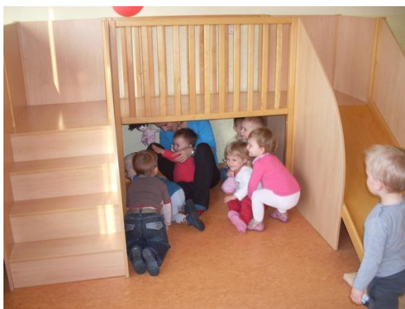
Slika 24: Miha se je skrila skupaj z otroki.