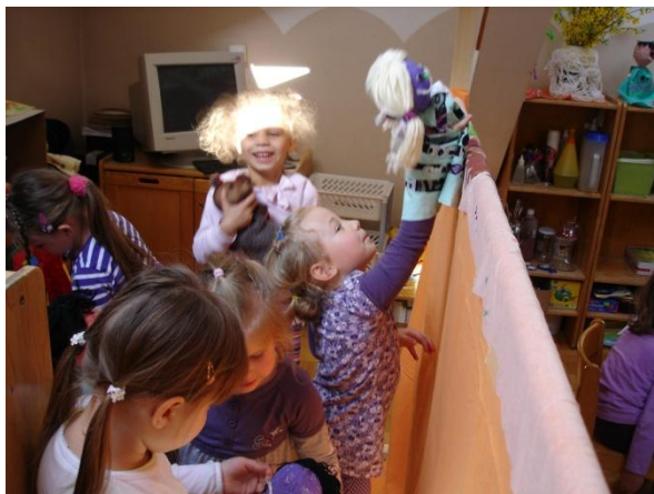
Slika 47: Deklice za sceno.

se okrog njega dogaja, saj je natanko vedel vsebino zgodbice. V skupini drugače ne daje takega občutka, saj je vedno kot bi bil čisto odklopljen od stvari, ki jih počnemo. Dan je bil naporen, a kljub temu zelo pozitiven, saj smo dosegli več, kot smo si zadali.