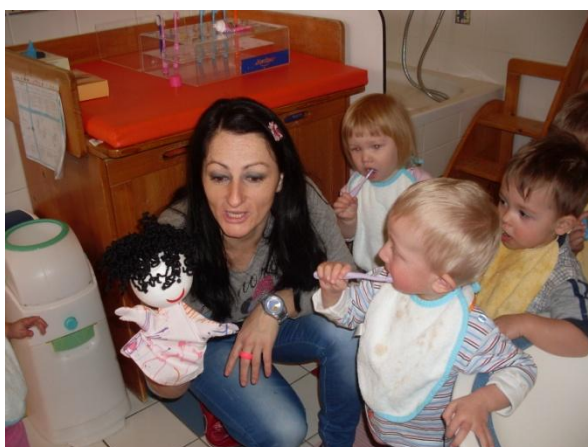
Slika 8: Spodbujanje otrok pri umivanju zob.