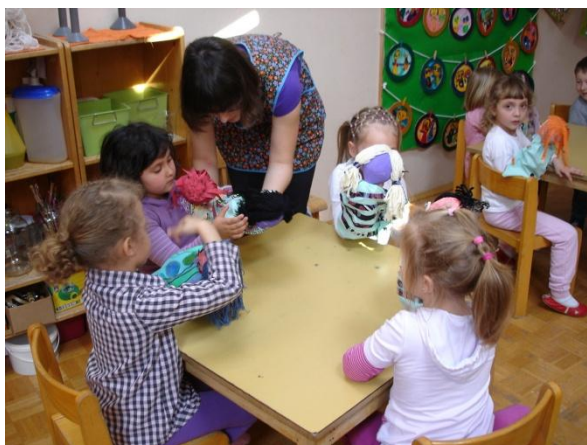
Slika 49: Razporejanje prstov.