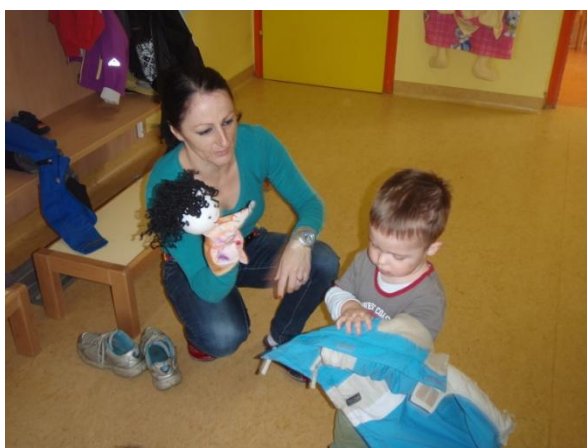
Slika 13: Spodbuda pri slačenju.