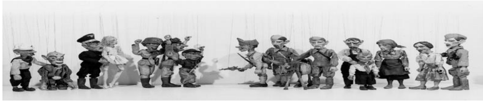
Slika 1: Lutke iz satiričnega programa PLG – 31.12.1944

( http://www.lgl.si/index.php/zgodovina_lutke povzeto dne 22.1.2012 ob 12.58)