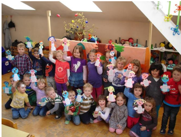
Slika 50: Izdelali smo vabila.