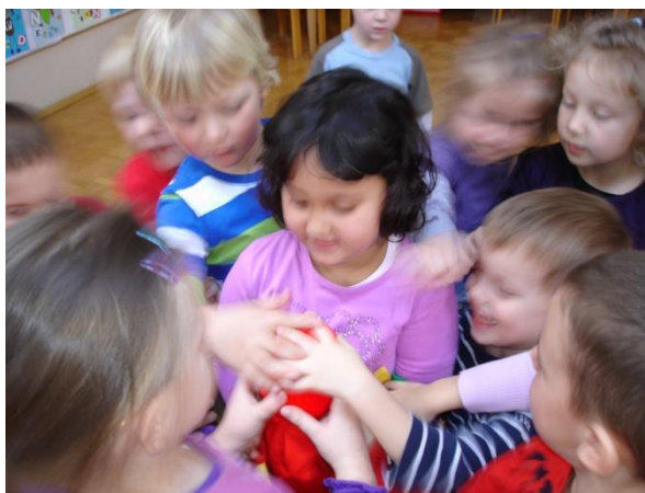
Slika 33: Božanje in tolažba Lumpe.

drugega dobro pogledali. Vsak otrok bi si izbral prijatelja, ki bi ga naslikal. Otroci so bili takoj za to in so že iskali drug drugega. Tisti otrok, ki je slikal, je sedel, drugi pa stal ob mizi, da ga je prijatelj dobro videl. Pri delu so bili otroci zelo ustvarjalni in zanimivo jih je bilo opazovati, kako so gledali drug drugega. Ko so otroci do konca ustvarili, smo to izrezali in skupaj pritrdili na našo tablo. Otroci so bili zadovoljni, ko so videli, kaj nam je uspelo. Lumpa je danes sodelovala pri kosilu. To smo izkoristili zato, ker smo imeli ravno obrok, kjer smo uporabili ves pribor. Celo leto se že trudimo, da bi otroci pravilno razvrstili vilice, nož in žlico, a nekateri imajo še težave. Zato je bila danes Lumpa tista, ki jim je pri tem pomagala. Z njeno spodbudo so skoraj vsi imeli pravilno razporeditev. Za nami je bil naporen dan, zato so pri poslušanju pravljice nekateri tudi zaspali, vključno z Lumpo.