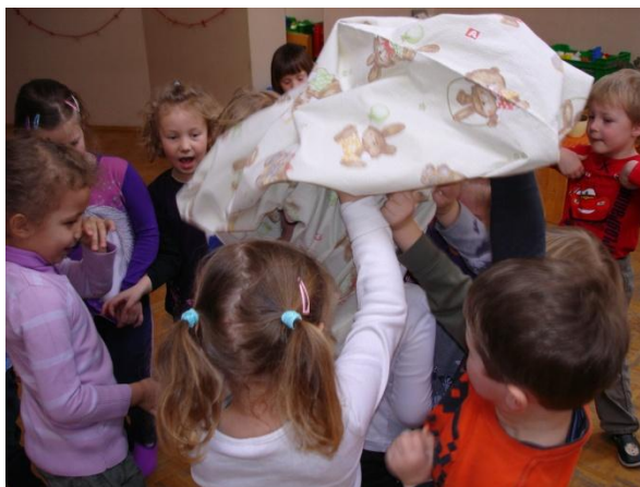
Slika 35: Pa pogledjmo, kdo je pod rjuho.