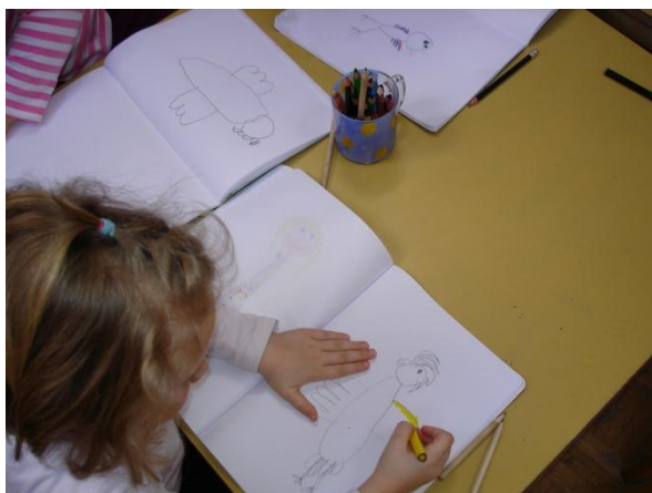
Slika 29: Slikanje Lumpe.