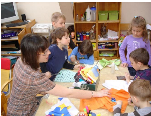
Slika 42: Dokončevanje oblekic.