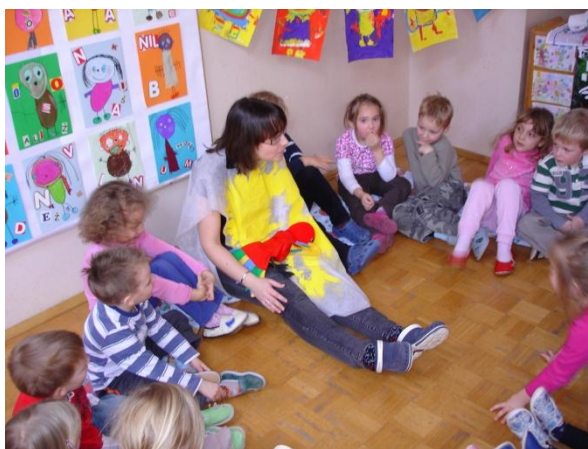
Slika 27: Lumpa od utrujenosti zaspi.