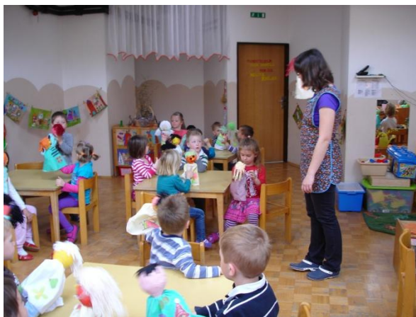
Slika 48: Tehnologije ročne lutke.

bila že mnogo boljša kot prvič. Otroci so že govorili bolj korajžno in glasno. Deklica N. zelo dobro obrača lutko sem in tja, medtem ko oni še ne razumejo, da lutka nastopa gledalcem, ne pa igralcem.