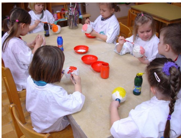
Slika 41: Barvanje glav.

najlažje, če v tulec potisnejo prst in glavo tako držijo. Na ta način se jim glava ni kotalila sem in tja po mizi in pobarvali so lahko celo glavo. Ko so vsi končali z delom, smo skupaj pospravili in otroci so umili posodice ter čopiče. Dan nam je hitro minil in vsi smo bili zadovoljni.