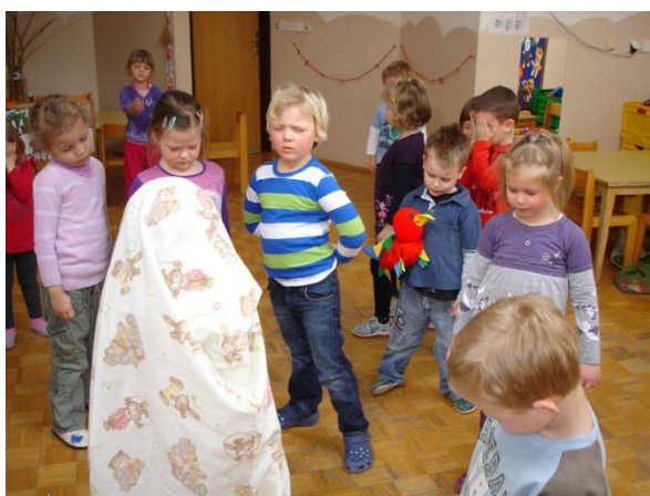
Slika 34: Igrica »Koga pogrešamo?«.

ga je zagledal. Nekaj otrok je Lumpo med igro božalo in sami so si jo podajali iz roke v roko, da jo je vsak imel nekaj časa ob sebi. Kadar se niso mogli sami zmeniti, kdo jo bo imel, smo jo sami prijeli in Lumpa je poletela do naslednjega otroka. Najbolj smešno jim je bilo, ko smo sami zlezli pod rjuho in ko so odprli oči, nas ni bilo v igralnici. Zanimivo jim je bilo tudi, kadar smo prekrili dva otroka. Takrat so imeli več težav z ugibanjem, koga pogrešajo. Za eno osebo so ugotovili takoj, za drugo smo jim morali dati malo namigov. Nekateri so se znašli in so malo pokukali, kakšne copate ima obute otrok. Tudi ko smo prekrili Lumpo, so jo takoj pogrešali. Otrokom je bila igra nasploh všeč in smo se jo igrali več kot pol ure. Preden smo odšli ven, so otroci pili sok. Lumpa jih je spodbudila, da so si sami nalivali sok z zajemalko. Pri tem so bili kar uspešni, eni bolj, drugi manj, ampak vaja dela mojstra. Nato je Lumpa otrokom pripovedovala, da je ugotovila, da drugi otroci v vrtcu tudi pojejo. Vprašala jih je, če tudi oni znajo kaj zapeti. To jih je tako motiviralo, da so zapeli kar nekaj pesmi in so ji tudi deklamirali.