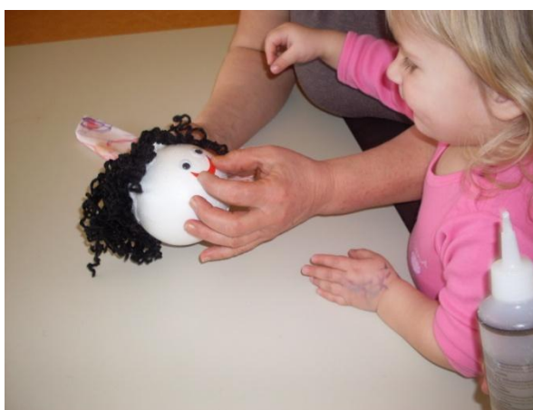
Slika 3: Sestavljanje glave.