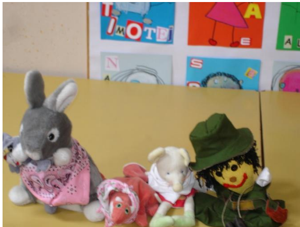
Slika 38: Ročne lutke za pomoč pri petju.

pesem. Vendar smo tokrat lutke z mize odstranili. Ko so otroci stopili v igralnico, smo samo rekli, če se razporedijo po prostoru, da bomo lahko zapeli pesem »Potovanje v deželo Balalaj«. Deček A. je takoj povedal otroku, ki je stal poleg njega, da je to tista pesem, ki so jo včeraj pele lutke in tisti lovec. Ko smo otrokom rekli, če se še spomnijo te pesmi, so rekli da se. Nato so kar sami pričeli peti. Vsak je začel malo drugače, z različnim tempom, višino, a čez čas so se uskladili. Prvo kitico so odpeli brez težav, nato pa niso vedeli, katera kitica sledi. Ena deklica je začela peti kar o lovcu, ostalim se to ni zdelo prav, zato so ji povedali, da lovec pride na vrsto šele na koncu. Med njimi se je vnel prepir, katera je druga kitica. Ker niso vedeli, ali je miška ali lisica, smo jim samo namignili, naj pomislijo, katera je bila druga žival, ki je prejšnji dan pokukala iz rjuhe. Začeli so vsak pri sebi razmišljati, nato so še enkrat povedali, da sta bila prva zajčka, po nekaj trenutkih tišine, so tudi ugotovili, da je bila druga lisica, tretja miška in na koncu še lovec. Tako je tudi tej skupini uspelo zapeti celo pesem. Čez dan, ko so se otroci igrali in ustvarjali pri mizi, je bilo vmes zaslišati, kako so si nekatere punce prepevale pesem. Dan je minil hitro in realizirano je bilo, kar smo si zadali.