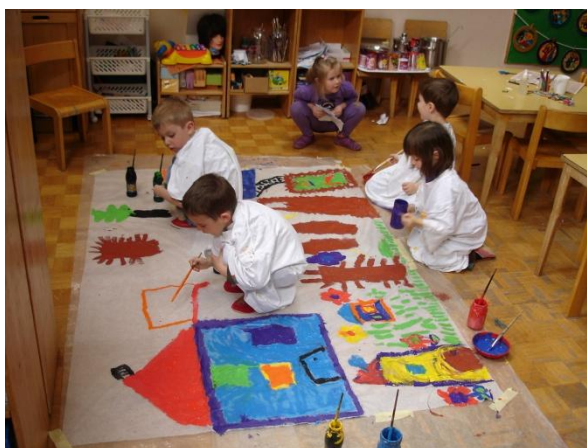
Slika 46: Slikanje scene

Po zajtrku so se otroci usedli nazaj na stole, da smo se dogovorili, na kakšen način bomo poslikali sceno. Povedali smo, da bomo na tla položili zaščitno folijo, na njo pa »vrteks«, ki smo ga zjutraj pripravili. Nato bo vsak povabljen, da nekaj naslika in na ta način bomo ustvarili naša skupno sceno, o kateri smo se pogovarjali en dan prej. Otrokom smo razložili tudi, da ne bomo mogli vsi naenkrat slikati, zato se bomo razporedili tudi k igračam. Preden smo začeli, smo preverili, če so otroci ohranili besedo scena. Ko smo začeli, smo ugotovili, da bo dobro, če »vrteks« malo prilepimo na zaščitno folijo, da se ne bo tako premikal sem in tja. To smo tudi storili in potem je bilo otrokom malo lažje slikati. Delo je potekalo v prijetnem vzdušju, tisti, ki so se igrali so ves čas hodili opazovat, kaj nastaja. Paziti smo morali, da ni slikal samo eden in da smo vključili in povabili res vse otroke. Vsi so bili seveda tudi veseli in so komaj čakali, da lahko pridejo delat. Ko so otroci videli končni izdelek, so se med sabo pogovarjali, kako lepo jim je uspelo. Deček N. je vabil otroke in jim kazal, poglej, to sem naslikal jaz. In tako so začeli še ostali. Drug drugemu so želeli pokazati njihov delček, ki je pripomogel k skupnemu delu. Otroci so bili vztrajni, delo je potekalo do odhoda ven. Po kosilu smo lončke od barv umili in počistili. Scene nismo pritrdili na stojalo, ker še ni bila dovolj suha.