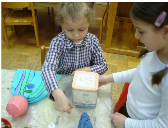
Slika 45: Navijanje volne.