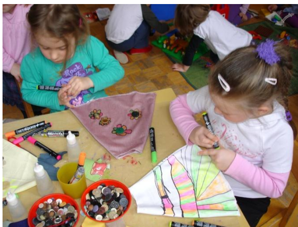
Slika 43: Delovna vnema.