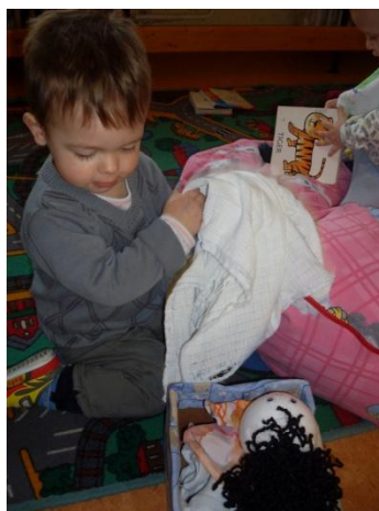
Slika 7: Mihcu smo naredili posteljo.