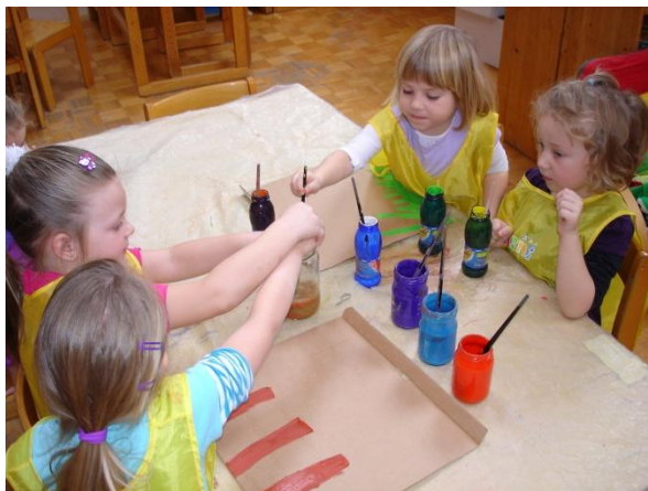
Slika 30: Slikanje na pokrov škatle.

dne ni umila krempljev. Deček si je roke tako umival, da smo ga morali iti iskat v umivalnico, ker je bil tam pet minut in ves čas ribal roke. Upajmo, da se bo tudi vsak naslednji dan spomnil Lumpe in si bo začel spontano umivati roke.