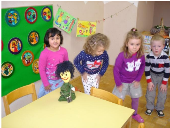
Slika 39: Drgnjenje po stegnih.

kako so med sabo komunicirali in razmišljali, kaj naj naredijo. Lumpa pa je bila tista, ki je pri vsaki skupini dala namig, kako bi lahko prišli do spremljave za pesem. Opaziti je bilo, da ko je ena skupina nekaj odkrila in to poskusila s telesom izvesti, so ostale skupine to posnemale. Nato smo otroke povabili, da zapojemo našo novo pesem in jo spremljamo z lastnimi instrumenti. Povedali smo, da ko bo kitica v pesmi z njihovo lutko, začnejo z izvajanjem na lastne instrumente, vsi ostali pa pojemo. Otroci so navodila dobro razumeli, le njihovo petje tokrat ni bilo tako dobro, ker so se bolj posvečali izvajanju. Pri dejavnosti so otroci uživali, nato smo se igrali še dalje. Skupine so krožile od lutke do lutke tako, da je vsaka skupina bila pri vsaki lutki. Nato smo s petjem prenehali in smo izvajali samo zvoke. Najprej ena skupina, nato druga in tako naprej. Nato smo skupine združevali in na koncu smo bili vključeni vsi. Otrokom motivacija v večini ni padla, bili so zainteresirani za dejavnost. Opaziti je bilo, da so to radi počeli, ker je vse potekalo tako sproščeno in je bilo razgibano, saj otroci na primer niso rabili samo sedeti ali samo stati. Gibali so se po prostoru in zraven ustvarjali s svojim telesom. Njihova aktivnost nas je pozitivno presenetila.