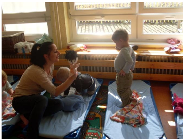
Slika 16: Spodbujanje pri slačenju hlač.

Ta teden smo dali velik poudarek pripravi na počitek. Prav je, da se tega lotimo počasi, da ne hitimo, si vzamemo dovolj časa za vsakega posameznega otroka. Seveda pa je pri vsem tem glavno vlogo imel Miha. Po kosilu smo otroke umili v umivalnici, jim zamenjali plenice in jim pripravili ležalnike. Otroke smo spodbujali, da si sezujejo copate, slečejo hlače, saj želimo, da storijo čim več sami, kar že zmorejo, seveda pa smo jim vseskozi v pomoč. In da je počitek ter sama priprava na počitek postala zanimivejša, bolj vesela, smo za motivacijo in spodbudo uporabili lutko. Bila jim je tudi v pomoč. Lutka jih je pokrila, jim razdelila dude ter jih pobožala. Po prebrani pravljici si je ena od deklic zaželela, da bi Miha spal zraven nje. Tako so tudi v naslednjih dneh otroci izražali isto željo. Tako je bilo vseh pet dni, Miha jim je razdelil dude, jim pomagal pri slačenju, jih pokrtil, pobožal. Otrokom počitek predstavlja nujo, Miha pa je poskrbel, da je postal to del dneva, ki ga imajo otroci radi.