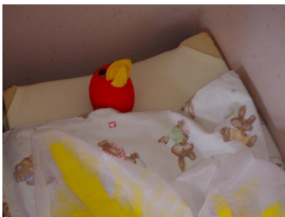
Slika 28: Otroci Lumpo položijo na ležalnik.