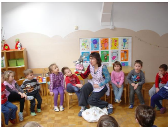
Slika 36: Zajec pripoveduje.