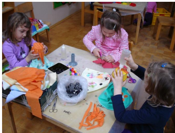
Slika 44: Urejanje glav.

in delal cel dopoldan. Ko smo imeli zajtrk je rekel, da bo po zajtrku nadaljeval. Enako je bilo, ko smo odšli k vadbeni uri. Sam je imel toliko volje in energije za delo, da nismo mogli verjeti, saj drugače ni tako vztrajen. Med delom je govoril, da se bo potrudil in bo lepo naredil. Po zajtrku so ostali otroci pričeli z lepljenjem las, oči, nosa in ust na glavo lutke. Ko so lepili lase, so sprva uporabljali volno, nato pa je ena deklica rekla, da bi lase izrezala kar iz blaga. To idejo smo seveda upoštevali. Tega so se posluževali kasneje tudi drugi otroci in tako so nastale še bolj zanimive ter različne frizure. Koščke blaga so lepili vsakega posebej na glave. Delo je potekalo umirjeno, otroci so bili ustvarjalni. Nekateri še posebej radi lepijo, zato so nalepili tudi več koščkov blaga. Tisti, ki so za lase izbrali volno, so jo navili na škatlo. Ko jim je to uspelo, smo jim pomagali sneti in zavezati s koščkom volne. Nato smo na eni strani volno prerezali in tako je nastala lasulja za lutko. Kdor je želel, je lahko lutki lase še ostrigel oziroma povedal kakšno frizuro si želi za svojo lutko. Čas je hitro mineval, cilji so bili realizirani. Najlepše pa je bilo pogledati otroku v obraz, ko je videl svojo dokončano ročno lutko. Bili so vidni nasmeški na ustih, iskrice v očeh. Nekateri so takoj, ko so lutko končali že tudi začeli z dialogom oziroma pogovorom. To je bilo največ, kar smo si lahko želeli.