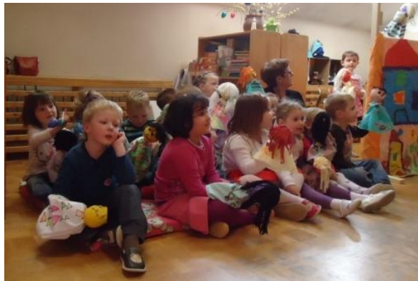
Slika 51: Nastopali smo za starše.