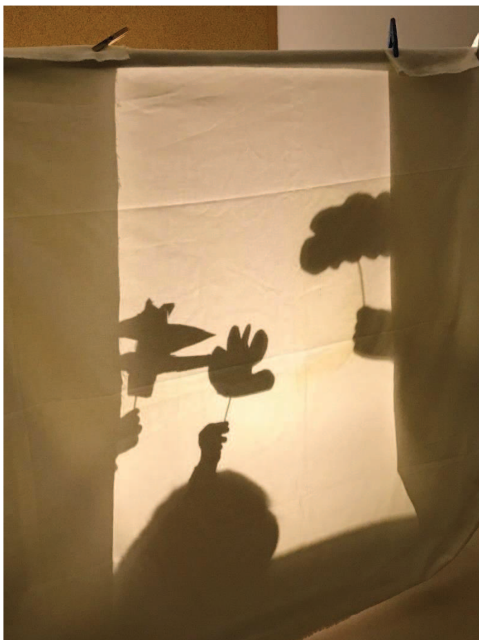
Slika 12: Preizkušanje senčnih lutk