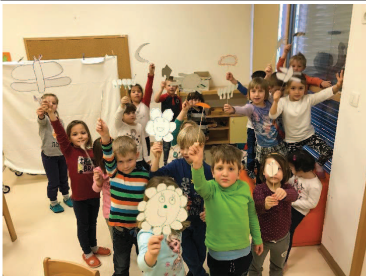
Slika 11: Otroci s svojimi senčnimi lutkami