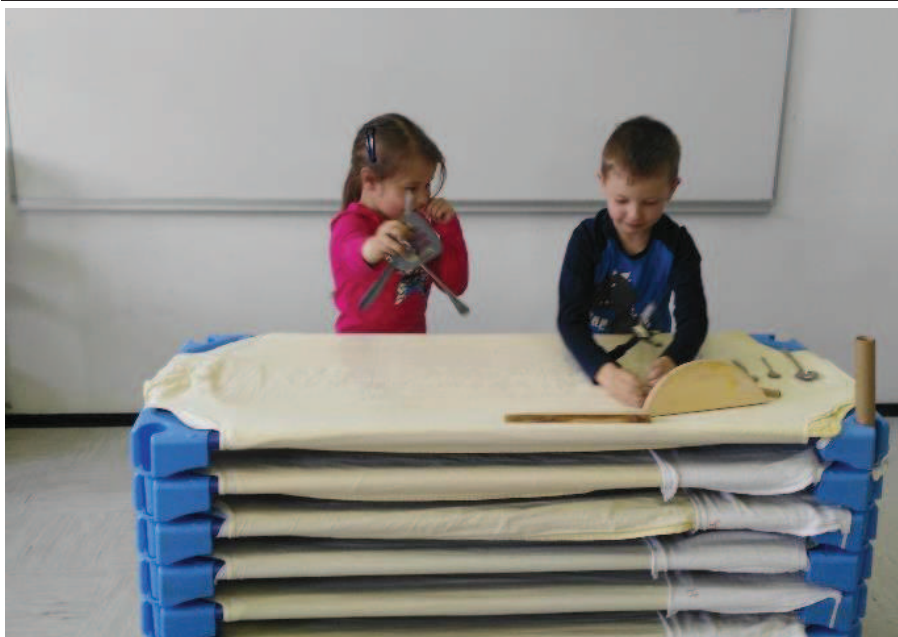
Slika 5: Predstava na temo izumrtje dinozavrov