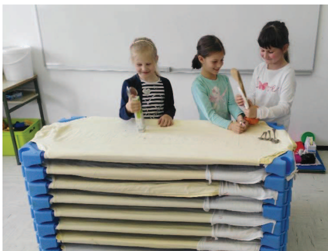
Slika 4: Igranje prizorov z lutko

Čez čas sem prosila otroke, da se razdelijo v manjše skupine, lahko tudi v pare, in skupaj razmislijo o tem, kakšno predstavo bi pripravili ter kasneje predstavili ostalim otrokom. Poiskali so si udoben kotichek in pričeli ustvarjati. Nekaj predmetov so deklice poiskale tudi v koticčku Dom. Otroci so se med seboj dogovarjali in tudi sodelovali. Tematike za lutkovno igro so iskali v dogodkih iz vsakdanjega življenja pa tudi v pravljicah in zgodovinskih dogodkih (izumrtje dinozavrov). Obdržali smo oder iz ležalnikov, gledalci so sedeli na stoli. Nastale predstave so bile zelo različne, nekatere so vključevale tudi preprosto sceno in rekvizite. Prisotni so bili tako človeški kot živalski liki. Nekateri so se izražali bolj neverbalno, drugi pa so bili verbalno nekoliko bolj spretni. Ena skupina je v svojo predstavo vključila tudi igranje na improviziran instrument. Vsaka predstava je bila posebna, lutkarji pa so bili zelo ponosni nase po končnem aplavzu.