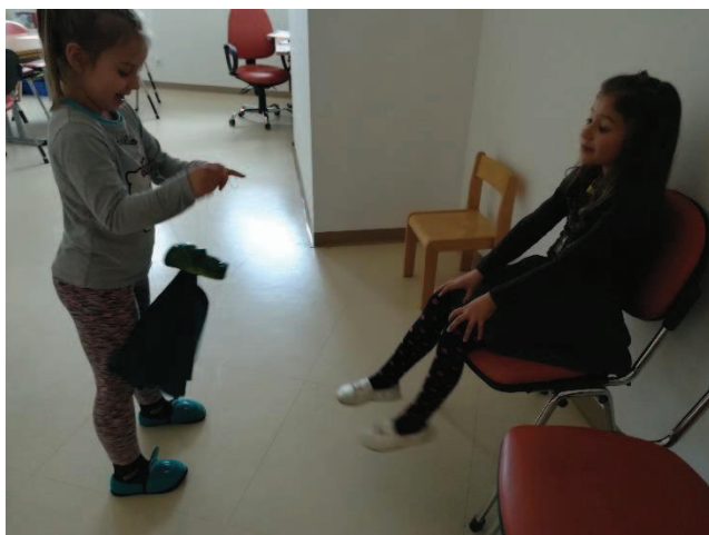
Slika 13: Pripovedovanje v paru