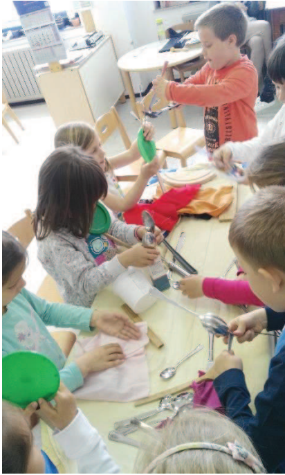
Slika 1: Raziskovanje materialov in spontana igra z lutkami