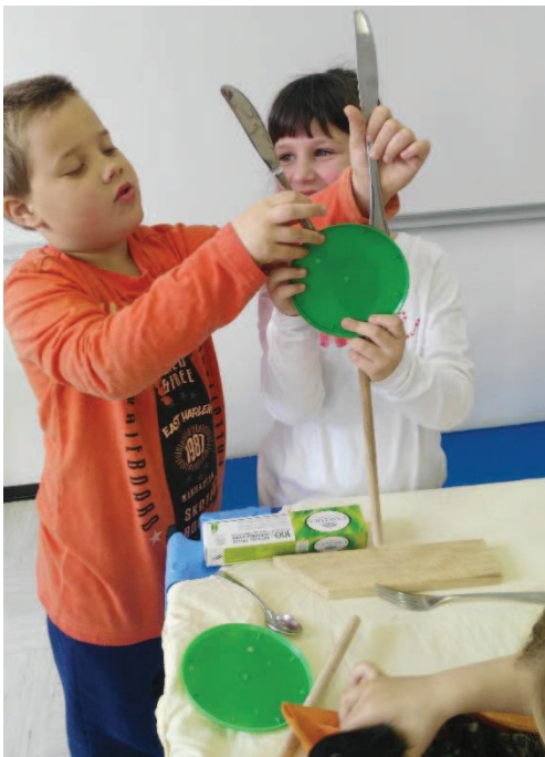
Slika 2: Animacija lutke v paru