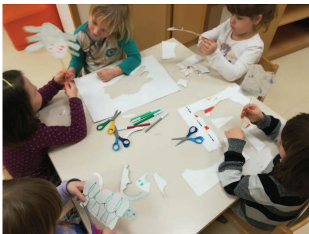
Slika 10: Deklici s končanima lutkama ustvarjata prve dialoge