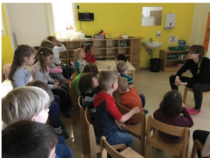
Slika 7: Pogovor po predstavi