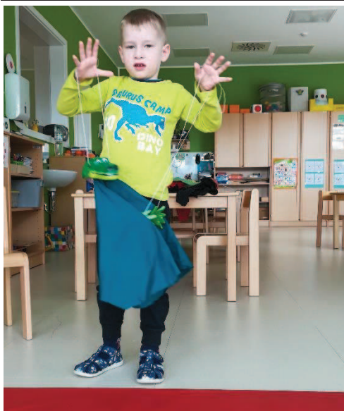
Slika 14: Pripovedovanje vzgojitelju

Drugo dejavnost sem izvedla naslednji dan. Temeljila je na metodi pogovarjanja z lutko. Izbrala sem pogovor na temo strah, saj je ta tematika povezana tudi s pravljico prejšnjega dne. Pogovarjali smo se v manjših skupinah po tri in štiri. S skupino otrok smo se iz igralnice umaknili v drugi prostor, kjer smo se lahko mirno pogovarjali brez motečih dejavnikov. Otroke sem vprašala: