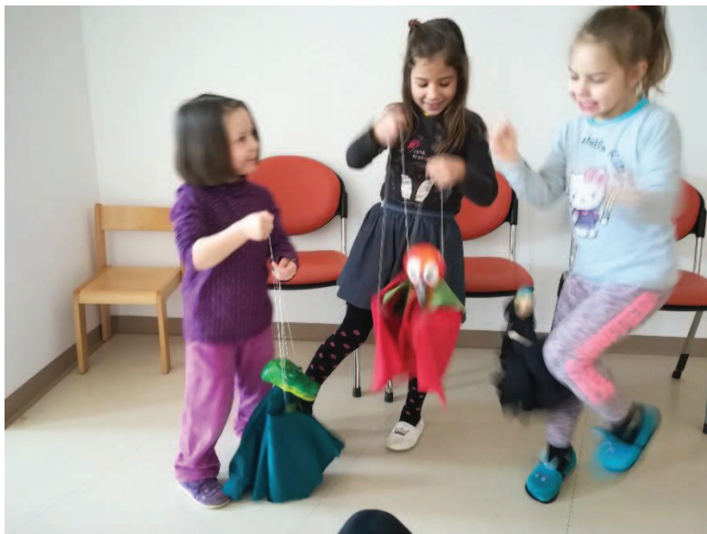
Slika 15: Pogovarjanje z lutkami