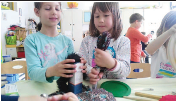
Slika 3: Deklici med igro s svojima lutkama

Čez čas sem prosila otroke, da se razdelijo v manjše skupine, lahko tudi v pare, in skupaj razmislijo o tem, kakšno predstavo bi pripravili ter kasneje predstavili ostalim otrokom. Poiskali so si udoben kotichek in pričeli ustvarjati. Nekaj predmetov so deklice poiskale tudi v koticčku Dom. Otroci so se med seboj dogovarjali in tudi sodelovali. Tematike za lutkovno igro so iskali v dogodkih iz vsakdanjega življenja pa tudi v pravljicah in zgodovinskih dogodkih (izumrtje dinozavrov). Obdržali smo oder iz ležalnikov, gledalci so sedeli na stoli. Nastale predstave so bile zelo različne, nekatere so vključevale tudi preprosto sceno in rekvizite. Prisotni so bili tako človeški kot živalski liki. Nekateri so se izražali bolj neverbalno, drugi pa so bili verbalno nekoliko bolj spretni. Ena skupina je v svojo predstavo vključila tudi igranje na improviziran instrument. Vsaka predstava je bila posebna, lutkarji pa so bili zelo ponosni nase po končnem aplavzu.