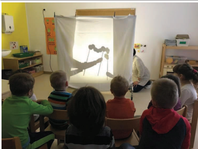
Slika 6: Predstava o zelo lačni gosenici