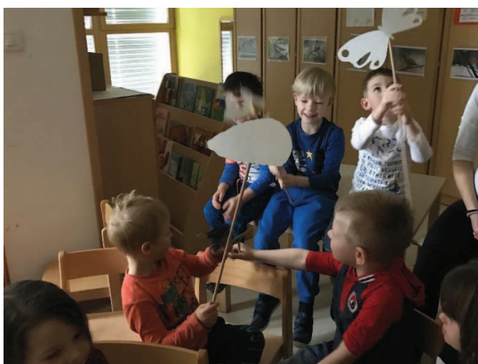
Slika 8: Spoznavanje senčnih lutk iz predstave