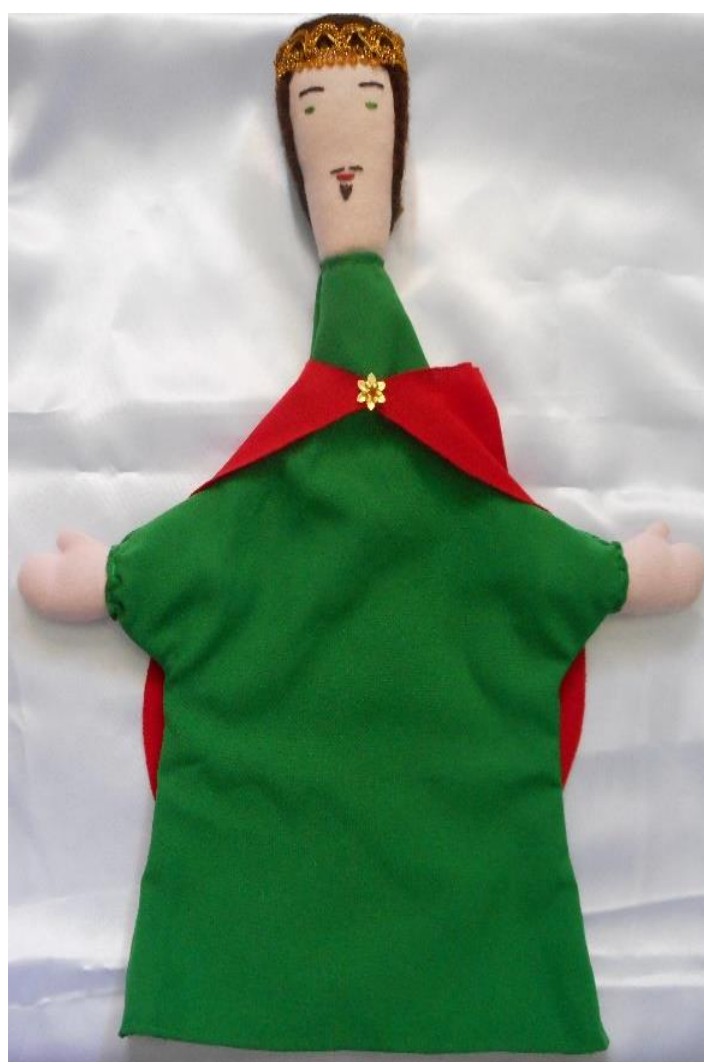
Figura nº 21: Boneco para o personagem Príncipe (2016)

Então, esse boneco apresenta em suas proporções as seguintes medidas: 36cm de comprimento e 30cm de largura. Sua cabeça e mãos foram produzidos com tecido de cor clara. Os cabelos foram feitos com lã da cor marrom. Na cabeça, uma fita dourada foi fixada para representar uma coroa. Os olhos e boca costurados a linha verde e vermelha, respectivamente. Seu figurino apresenta um vestido verde e uma capa vermelha, conforme observa-se na figura nº 21: