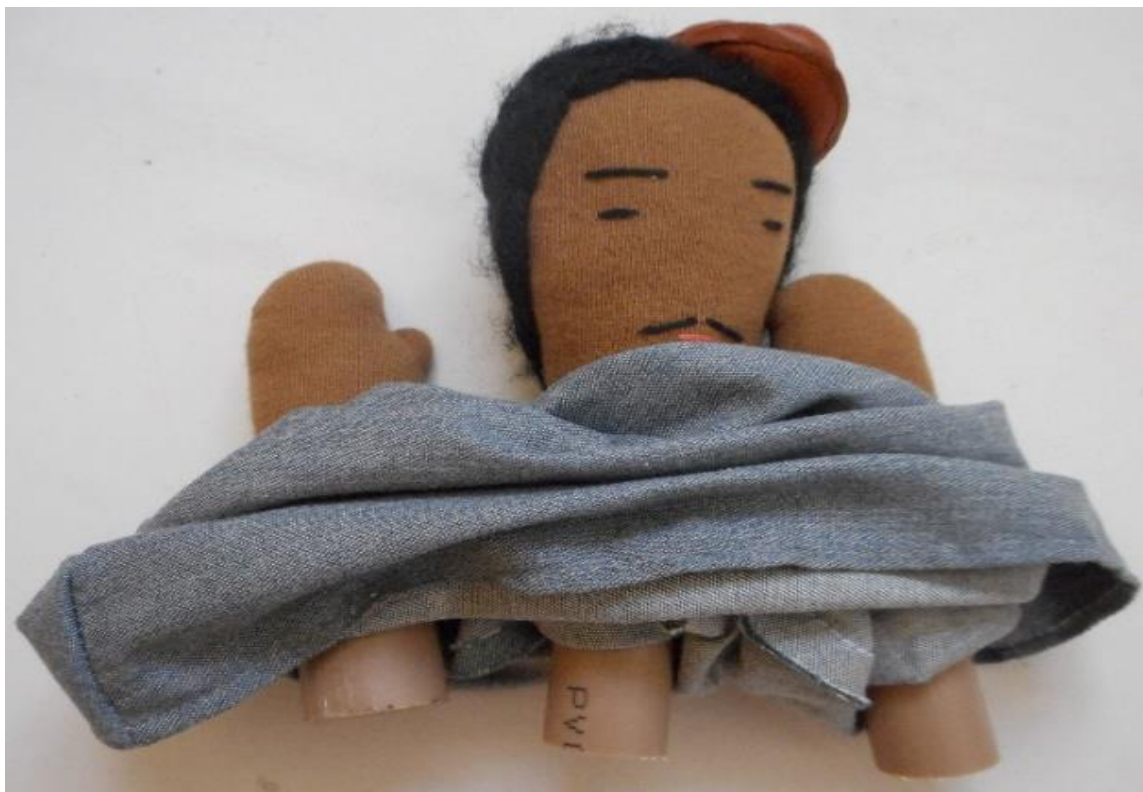
Figura nº 19: Estrutura em PVC para o encaixe dos dedos para a manipulação (2015)

A Morte nesta história apresenta um aspecto assustador por retirar a vida das pessoas, porém, como ao longo do enredo ela é enganada algumas vezes pelo personagem Homem, acaba se tornando uma figura boba e apática. Acerca da personagem Morte, um educando argumentou que: “A Morte é pra ser toda preta, pra assustar os boy” .