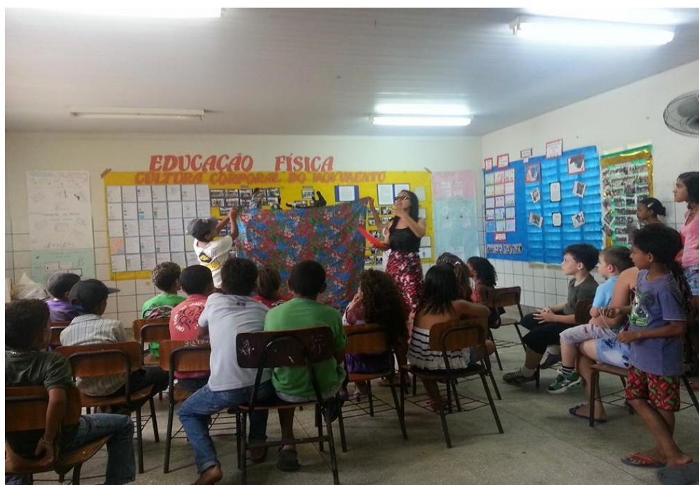
Figura nº 23: Apresentação da cena “O Compadre da Morte” no evento Feira do Livro em 2013

Em uma das últimas aulas, foram construídos com os alunos os seguintes acessórios para a cena: a cama e as velas. Os alunos trouxeram as caixas de fósforos e a Escola disponibilizou materiais como papel ofício, papel laminado, cartolina, cola e tesouras. A turma foi dividida em grupo, após minhas instruções, e iniciaram a construção dos acessórios. O acabamento ficou sob minha responsabilidade.