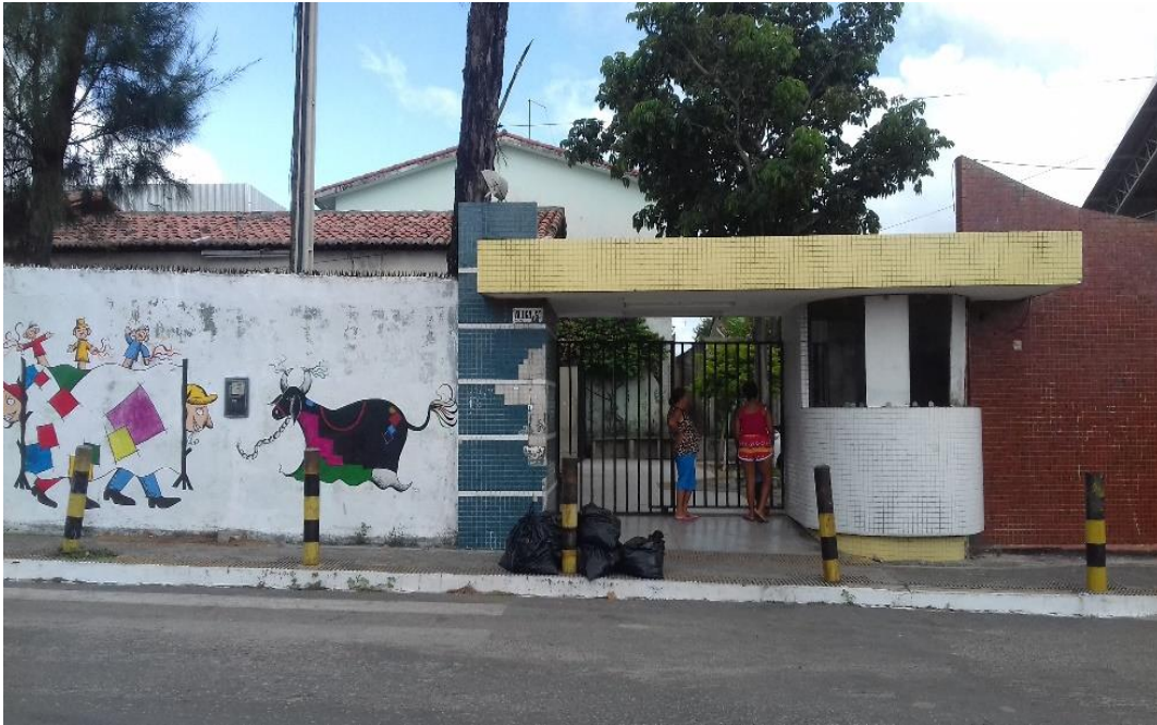
Figura nº 7: Fachada da Escola Municipal Djalma Maranhão (2016)

O prédio da EMDM foi reformado e reestruturado à época da criação, possuindo hoje doze salas de aula, uma biblioteca, uma sala de multimeios, uma sala de informática, uma sala dos professores, duas secretarias, uma cozinha, dois depósitos, uma quadra de esporte e um pátio coberto.