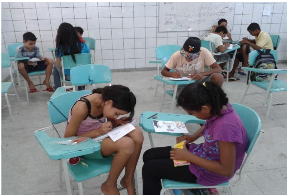
Figura nº 12: Alguns alunos da turma do 4º ano “H” (2013)

O 4º ano “H” era uma turma diferenciada, pois ela era composta por alunos, em sua maioria, que apresentavam um histórico de reprovações; alguns destes estavam cursando o 4º ano pela terceira vez. Já uma minoria estava nivelada, ou seja, se encontrava no período normal para cursar o 4º ano, não possuindo distorção na idade/ano.