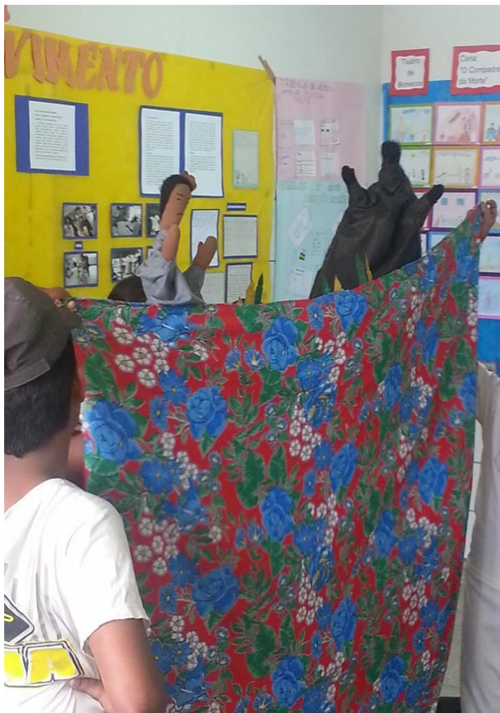
Figura nº 24: Alunos da turma do 4º ano “H” encenando seus respectivos personagens e outros sustentando a cortina. (2013)