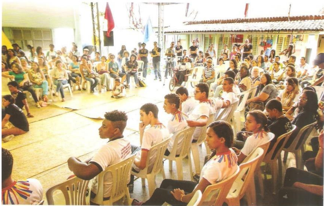
Figura nº 4: Roda de Prosa 10 na Escola Municipal Djalma Maranhão

O interesse pela perpetuação das manifestações artísticas presentes na cultura popular do bairro de Felipe Camarão está também nos ideais de alguns