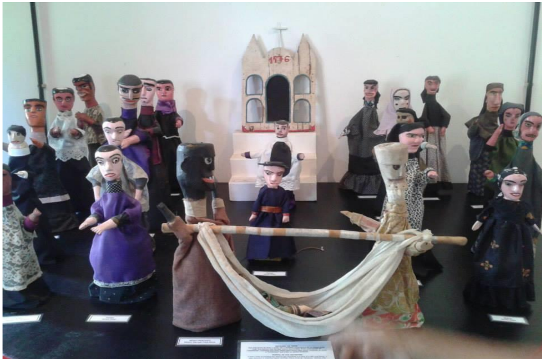
Figura nº 13: Acervo do Museu do Mamulengo Espaço Tiridá – Olinda, Pernambuco (2014).

A manipulação desses bonecos acontece da seguinte forma: o dedo indicador se prende a um espaço vazio que o direcionará para a cabeça, e o dedo polegar e o médio manipulam os braços.