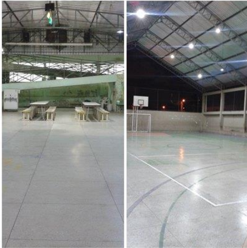
Figura nº 8: Pátio e Quadra Poliesportiva (2015)