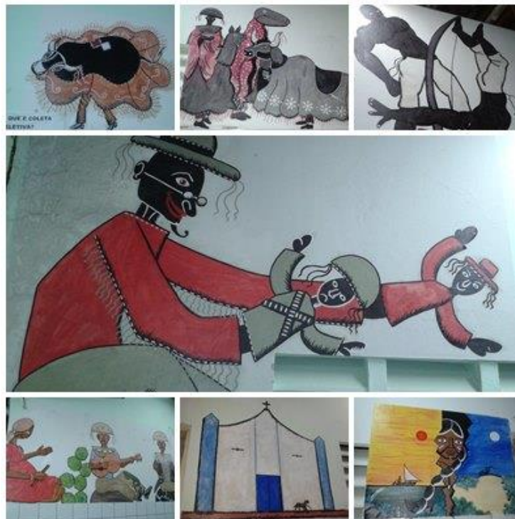
Figura nº 11: Pinturas nas paredes da EMDM (2015)