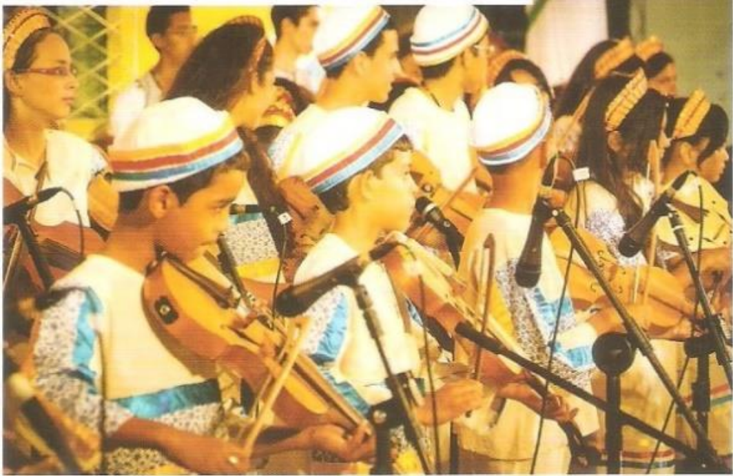
Figura nº 3: Rabequeiros do Conexão Felipe Camarão Fonte: Acervo Conexão Felipe Camarão. 2013.