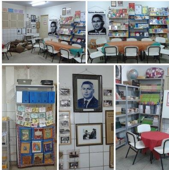
Figura nº 10: Biblioteca (2015)