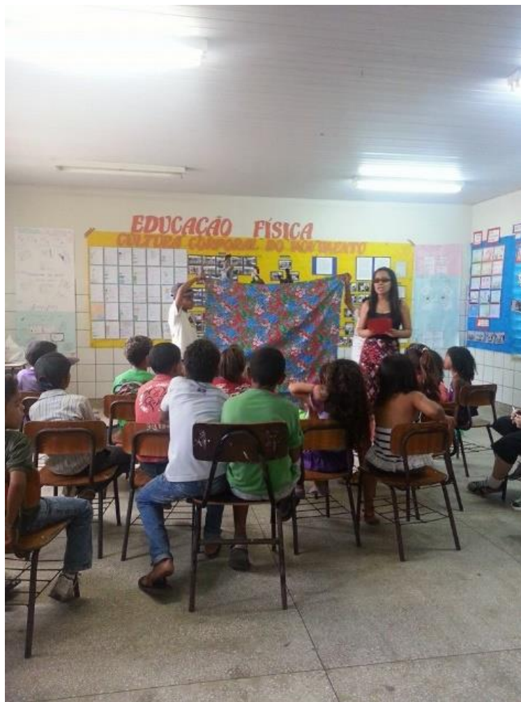
Figura nº 25: Agradecimentos ao final da apresentação da cena (2013)

Acerca dos ensaios, foram realizados quatro e um geral. No primeiro, aconteceu uma leitura entre os alunos para o entendimento de como ficou o produto final da adaptação do texto. A partir do segundo, os alunos-atores já estavam com as falas memorizadas e, nesta ocasião, decidi por trabalhar com eles as entonações de suas vozes para os personagens. Esta tarefa foi difícil, pois os discentes estranharam o modo como seriam produzidas essas vozes, ficando como exercício a procura por uma melhor entonação para as vozes dos papéis do Homem e da Morte. Essa busca não foi solucionada, uma vez que os educandos não conseguiram, por meio de suas habilidades vocais, encontrar uma entonação vocal para os dois personagens, os interpretando com suas vozes normais. Depois de muita tentativa, puderam transformar um pouco as suas vozes e atribuir entonações razoáveis para os seus personagens.