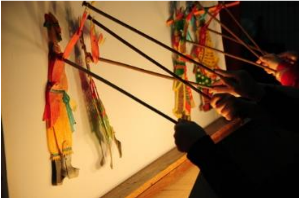
Figura nº 16: Teatro de Sombras