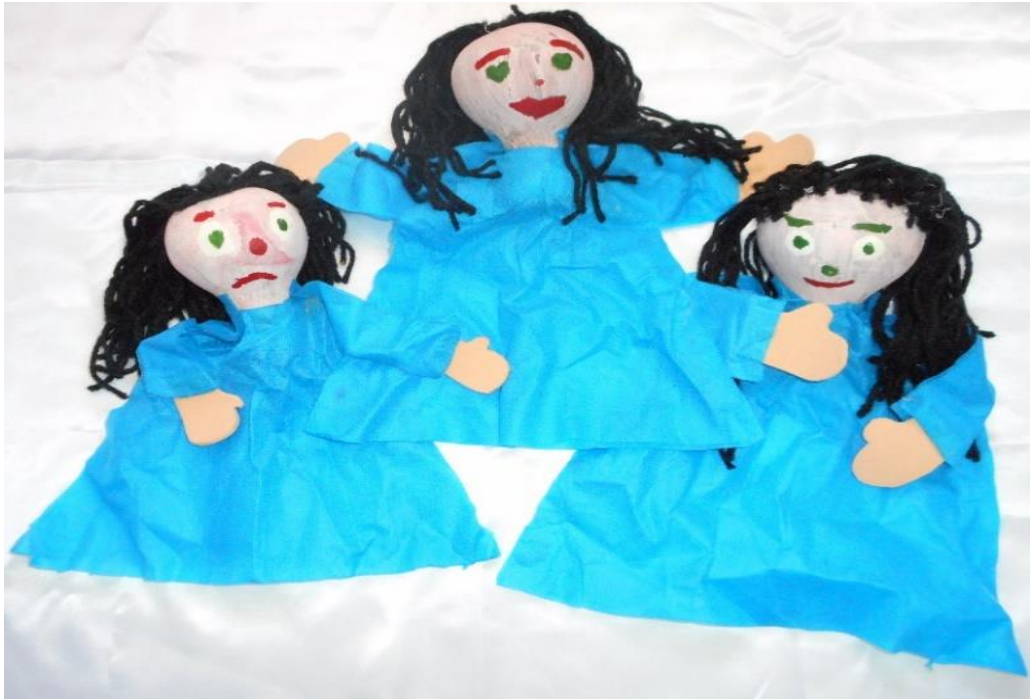
Figura nº 17: Bonecos produzidos pelos alunos (2013)

Para a concretização dessa atividade, os educandos foram divididos em grupos e cada um pode pintar as cabaças com tinta guache e também o formato dos olhos, nariz e boca. Em outro momento, por meio de moldes do formato da roupa e das mãos, os alunos recortaram as vestimentas com TNT e as mãos com o material EVA. Na realização desse trabalho prático, ocorreram momentos em que a atenção oscilou, porém, apenas dois alunos não conseguiram concluir a atividade.