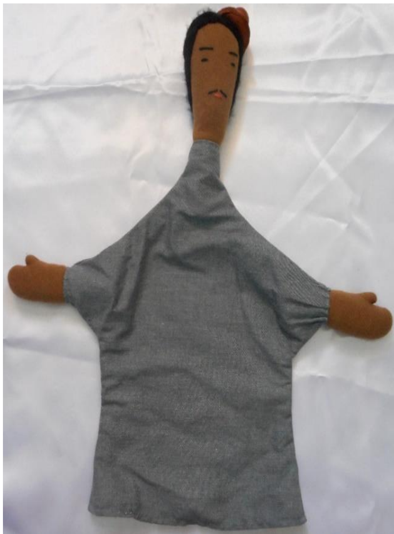
Figura nº 18: Boneco produzido para representar o personagem Homem (2016)

Para os alunos-atores encaixarem os dedos foram colocados pedaços de canos do material PVC na cabeça e nas mãos dos bonecos.