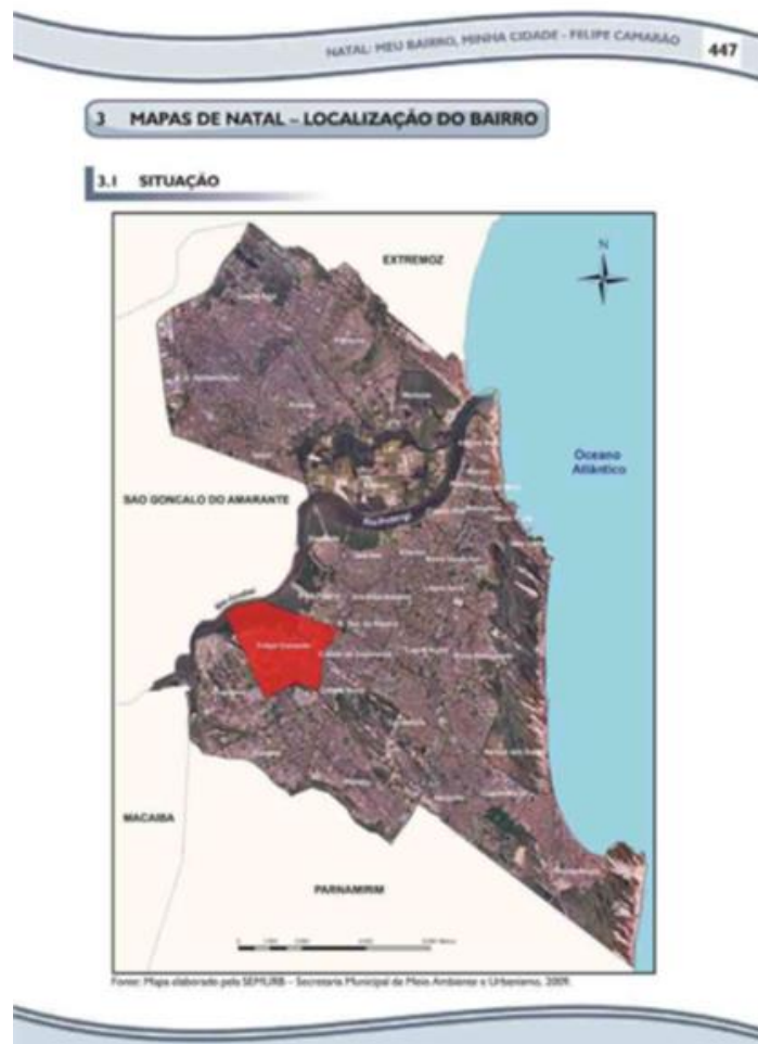
Figura nº1: Mapa do bairro de Felipe Camarão

O bairro pertence à Região Administrativa Oeste e estabelece os seguintes limites: ao norte, o bairro de Bom Pastor; ao sul, Guarapes; ao leste, Cidade da Esperança e Cidade Nova; ao oeste, o município de São Gonçalo do Amarante.