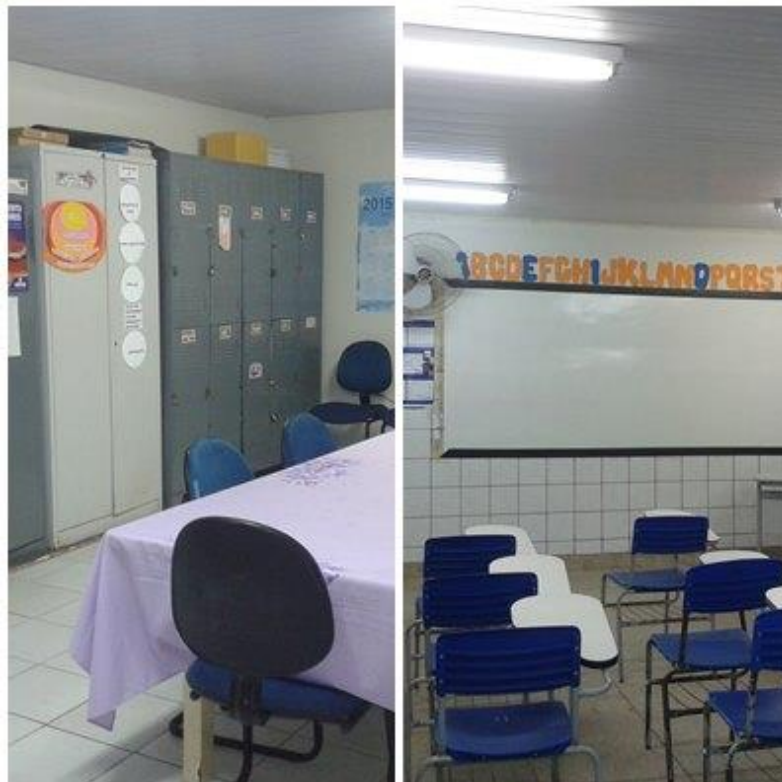
Figura nº 9: Sala dos Professores e Sala de Aula (2015)