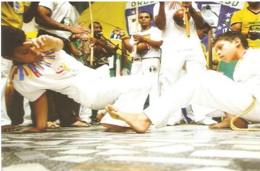
Figura nº 2: Encontro de Capoeira 9

Como exemplo de ONG que atua no referido bairro, pode-se destacar o Conexão Felipe Camarão. Essa organização busca realizar intervenções que atuem no processo de valorização, preservação e difusão da cultura de tradição oral do bairro, levando em consideração seus patrimônios imateriais. O Conexão Felipe Camarão iniciou suas atividades em 2005, trabalhando com crianças, adolescentes e jovens através de oficinas ministradas por músicos, professores e Mestres da tradição. Elas se configuram em oficinas de tradição de Boi de Reis e Capoeira, além da formação e qualificação musical em rabeca, percussão, metais e flautas. A ONG também realiza eventos e mostras culturais no bairro, com debates sobre temas de interesse coletivo e apresentações, além de atuar com reflexões acerca da cultura e educação pelo Brasil.