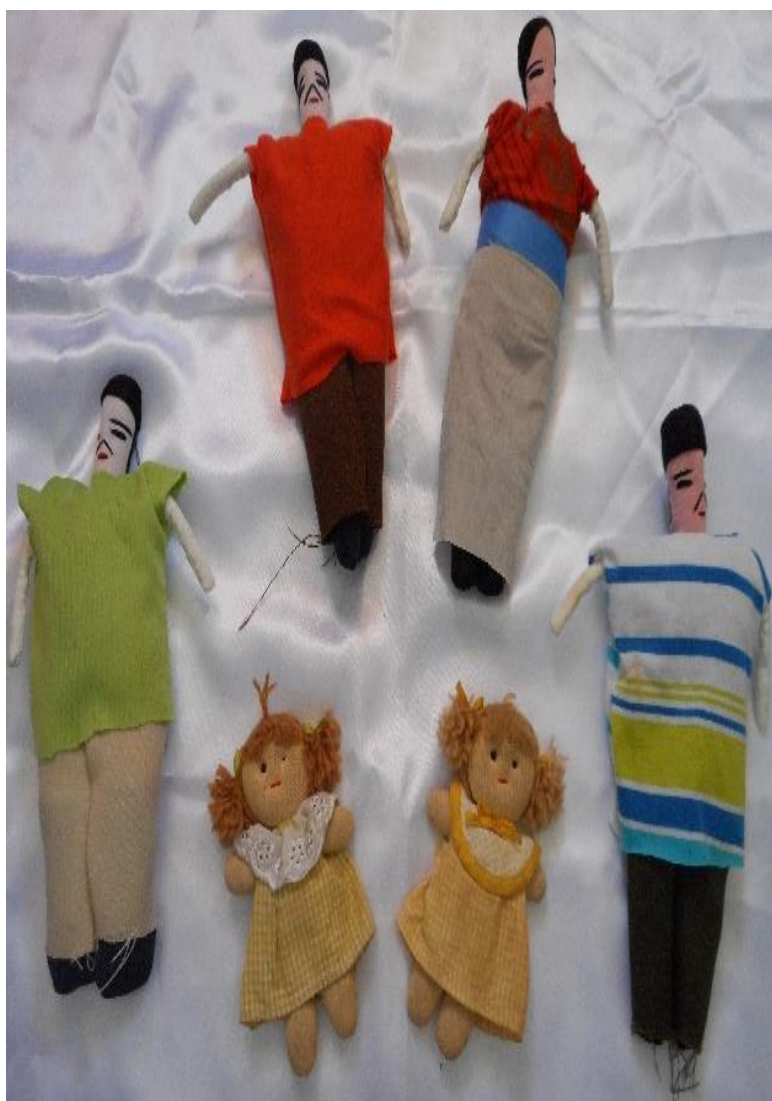
Figura nº 22: Bonecos para os personagens da família do Homem

Dentre esses cinco bonecos, existem duas mulheres e dois homens, não se diferenciando no formato das cabeças e braços e também na composição do figurino, que se caracteriza por blusas e saias para as mulheres e camisetas e calças para os homens. Esses bonecos medem 22cm de comprimento por 16cm de largura.