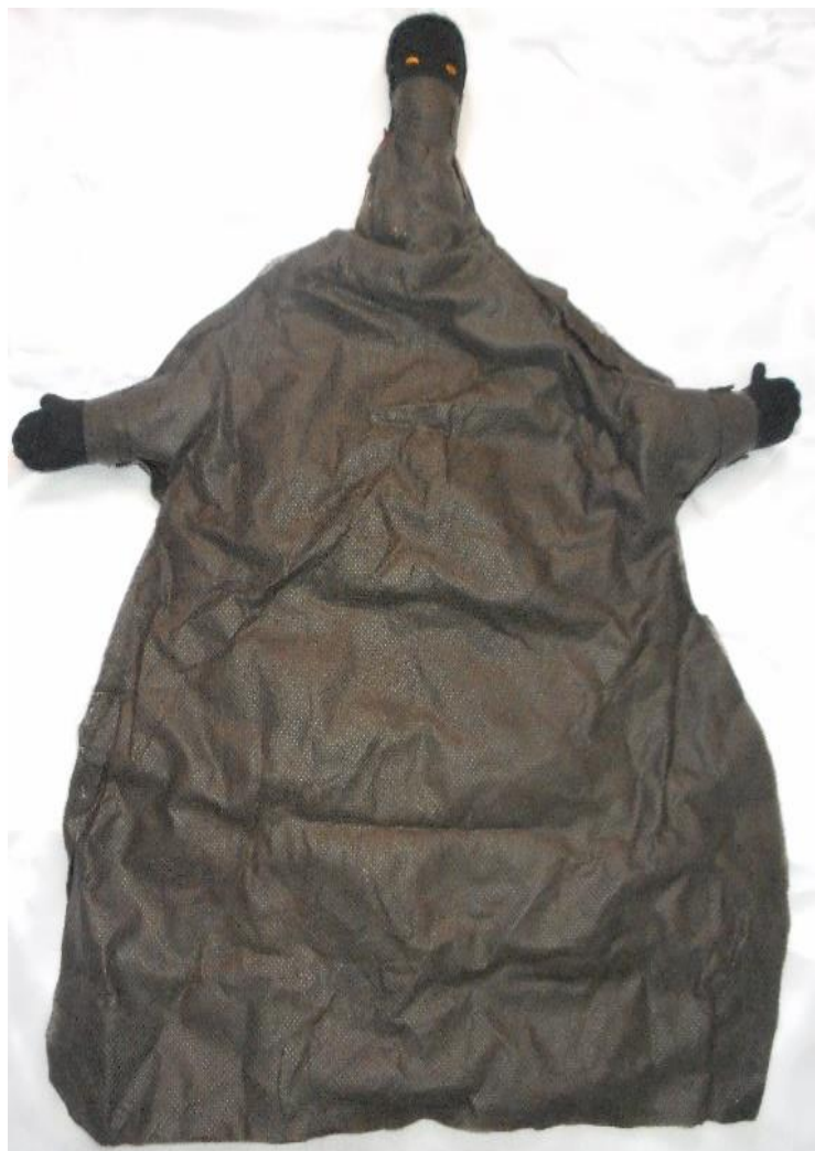
Figura nº 20: Boneco para a personagem Morte (2016)

A professora de Educação Física conversou mais uma vez em outra oportunidade com os discentes para a construção do boneco para o personagem Príncipe.