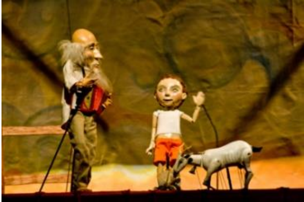
Figura nº 15: Espetáculo “João e o Pé de Feijão” do grupo Fabulosa Cia. de Bonecos – Foto: Pedro Miranda (2010).

Fonte: https://www.flickr.com/photos/portabelohorizonte/5842685687/