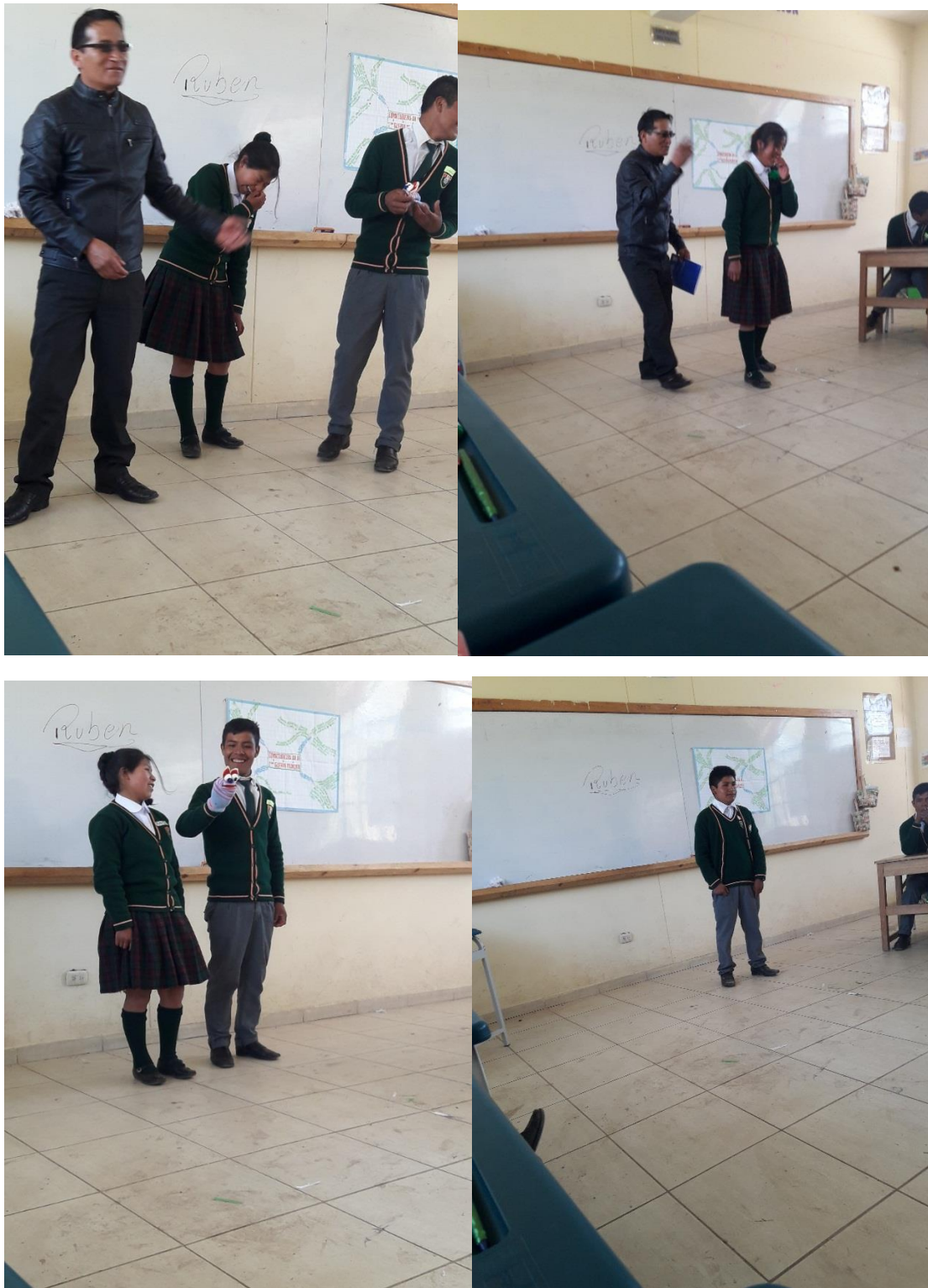
Figura 3. Haciendo improvisación 2 de julio del 2018

Fotografía en la cual todos participan con la improvisación de los estudiantes de 4to grado de secundaria