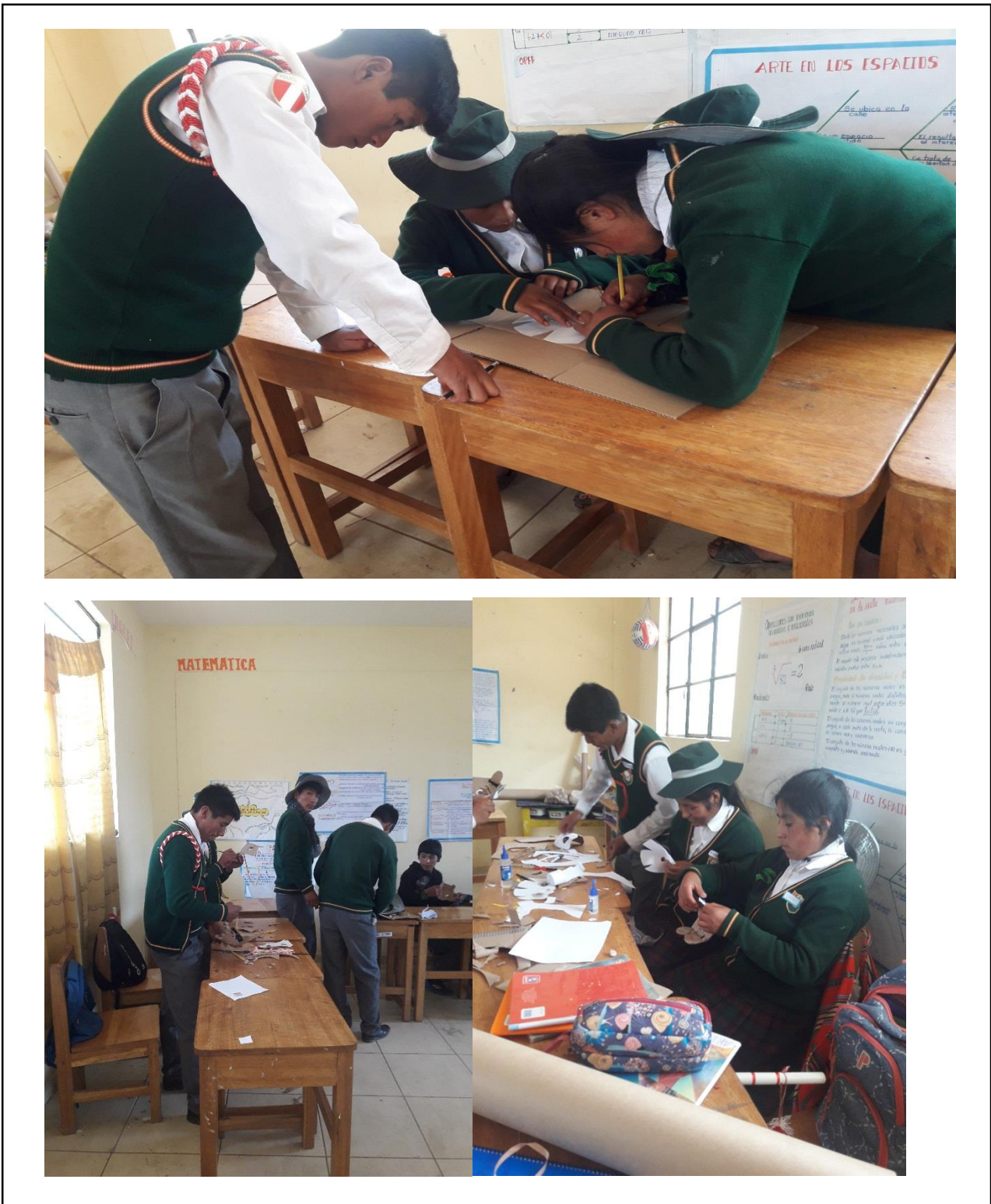
Figura 2 trabajo grupal 25 de junio 2018

Fotografía en la cual los estudiantes están concentrados en la elaboración de su trabajo