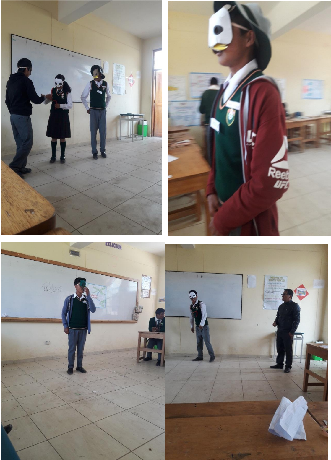
Figura 4. Un poco de arte 9 de julio del 2018

Fotografía en la cual cada uno se expresa libremente utilizando algunos mascararas.