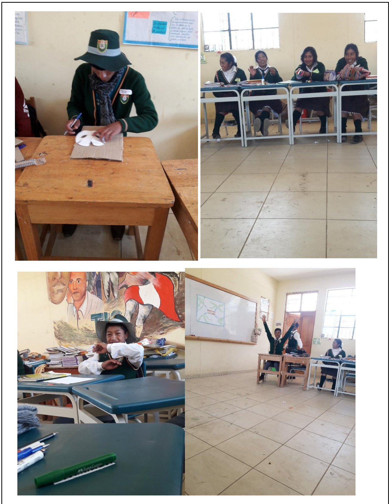
Figura 5. Momentos de la convivencia y oportunidades de la expresión y libertad durante la clase de arte.