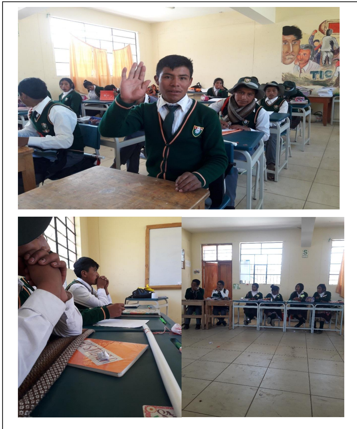
Figura 1 encuesta a estudiantes del 18 de junio del 2018.

Encuesta desarrollada en el proceso de investigación para la estrategia en la enseñanza de una representación teatral.