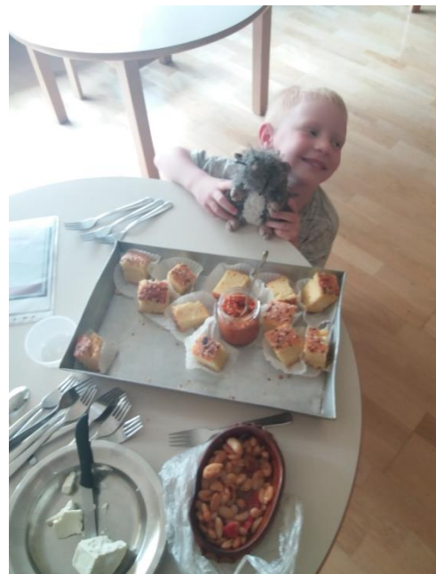
Sliki 36 in 37: Makedonske jedi