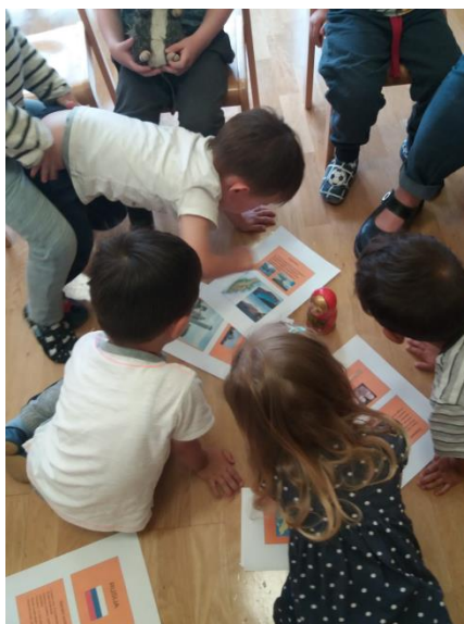
Slika 40: Spoznavanje značilnosti Rusije