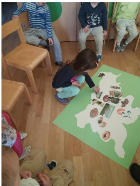
Slika 14: Izdelovanje plakata Slovenije

Pri dejavnosti so otroci zelo dobro sodelovali, saj jim je slikovni material ostal v dobrem spominu. Zanimivo je bilo, da so si zapomnili tudi, kje živijo babice in dedki od prijateljev. Otroci so poimenovali stvari in nato povezali z dedki in babicami, ki živijo v tistem okolju. Tudi igra jim je bila zelo všeč in so jo hitro osvojili ter se jo igrali tudi med prosto igro.