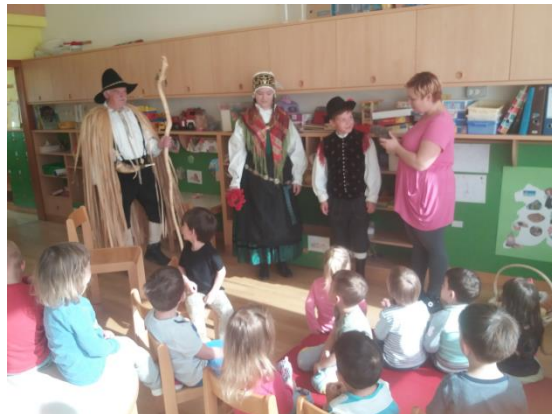
Slike 17, 18 in 19: Predstavitev značilnosti Slovenije