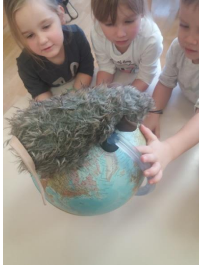
Slika 48: Iščemo Mehiko