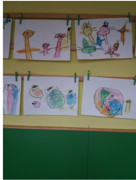
Slika 8 in 9: Risbe družin