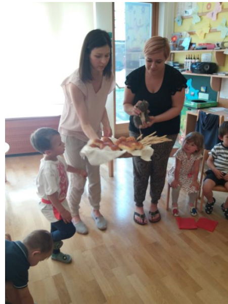
Sliki 44 in 45: Predstavitev značilnosti Rusije