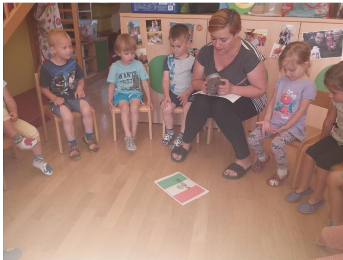
Slika 49: Pogovor o Mehiki

Zanimivo je bilo raziskovati, kje leži Mehika. Otroci so med dejavnostjo večkrat pogledali Angelco, ki jih je spretno motivirala in izražala moč lutke med dejavnostjo. Opazila sem, kako otroci sledijo njenim namigom in vprašanjem. Otroci z lutko res uživajo in raziskujejo. Videti pa je bila tudi velika razlika med našimi priseljenci. Najbolj odprt za sodelovanje med dejavnostjo je bil prav Leo.