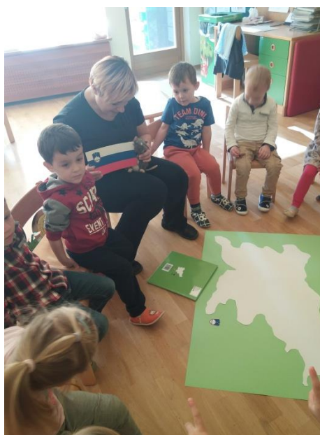
Slika 12 in 13: Plakata Slovenije