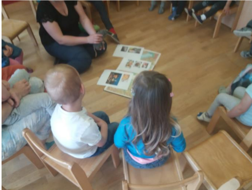
Slika 23: Spoznavanje značilnosti Bosne in Hercegovine