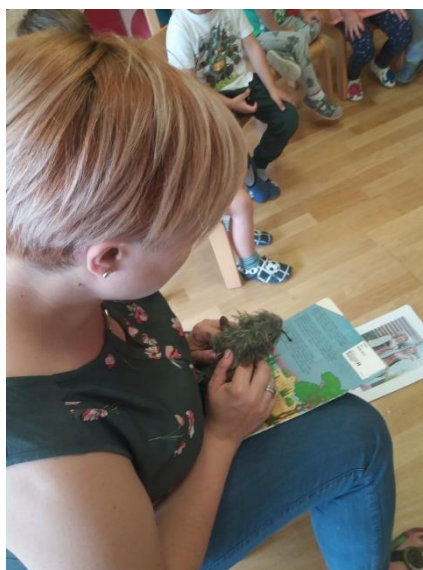
Slika 41: Spoznavanje Babuške