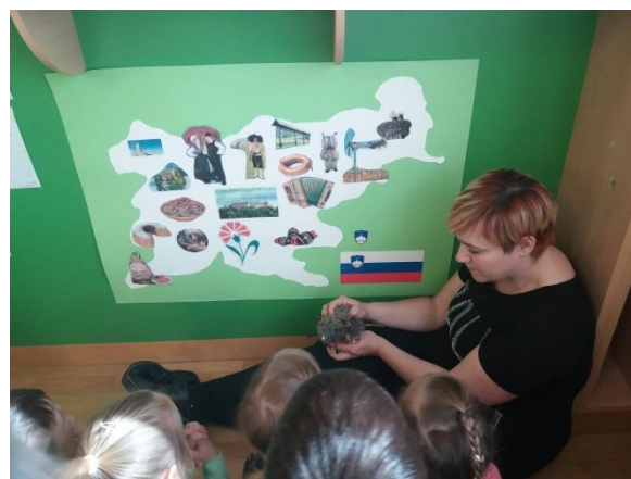
Slika 15: Slovenski kotiček