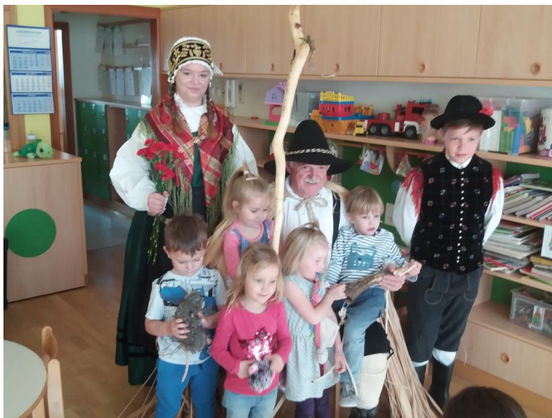
Sliki 20 in 21: Druženje ob predstavitvi Slovenije

Predstavitve je potekala odlično. Otroci so bili pri planšarju previdni, saj so ga videli prvič. Večina je bila kar pogumna, le nekaj otrok se ga je malo prestrašilo, zato so bili še bolj previdni. Opazila sem, da najbolj poznajo kranjsko klobaso, saj so jo tudi poskusili. Otroci so se zabavali in na koncu tudi zaplesali.