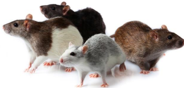
Slika 7: Podganja družina

sestavlja njihovo družino. Nekatere izjave so bile res izvirne in zanimive, zato sem jih zapisala – npr. »Družina je, da smo skupaj doma in se stiskamo.« »Da smo vedno skupaj jaz, oči, Vid in mami.« Razmišljanje o družini sva z Angelco podkrepili z vprašanjem, kako zelo imajo radi očke in mamice. Izjave so bile čudovite – »Rad jih imam enkrat do dvakrat.« »Jaz jih imam rad do stropa pa nazaj.« »Do lustra pa nazaj.« Otroci so pri spoznavanju oblik družin in opisovanju svojih res zelo uživali. Na čisto preprosti način so prišli do velikih spoznanj. Saj so ugotovili, da imajo tudi živali oblike družin in da družine včasih nimajo obeh staršev. Vsa živa bitja imamo neko obliko družine, ki nas sestavlja in oblikuje in daje popotnico za življenje skozi katerega se prebijamo.