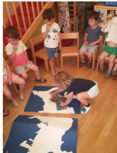
Slika 42 in 43: Izdelovanje zemljevida Rusije