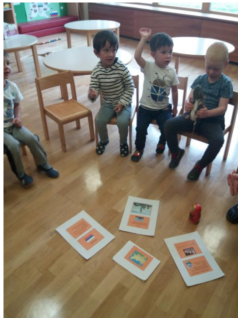
Sliki 38 in 39: Spoznavanje Rusije