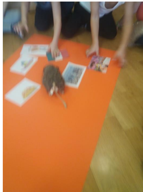
Sliki 51 in 52: Izdelovanje plakata Mehike