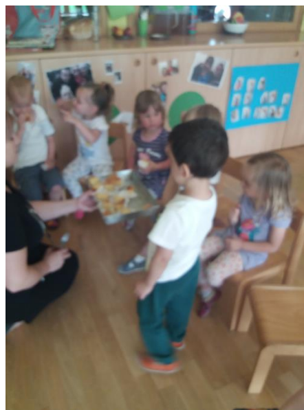
Sliki 34 in 35: Predstavitev Makedonije