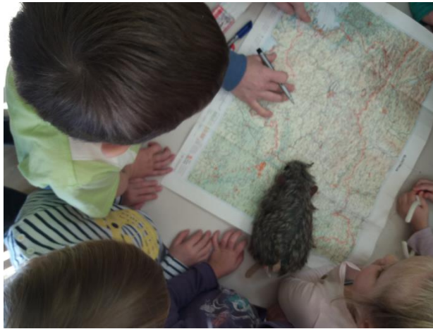
Slika 10: Razdalje med različnimi mesti