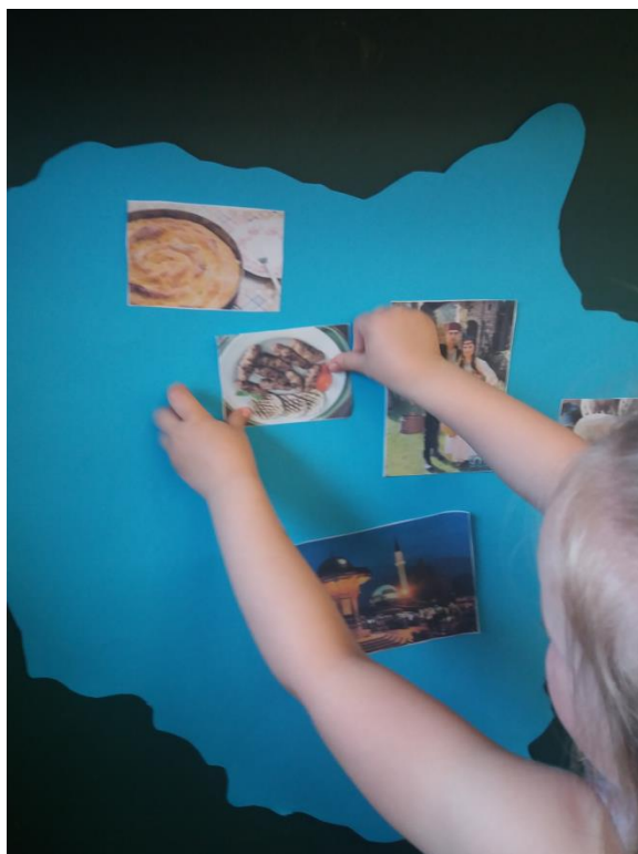
Slika 24: Izdelovanje zemljevida Bosne in Hercegovine