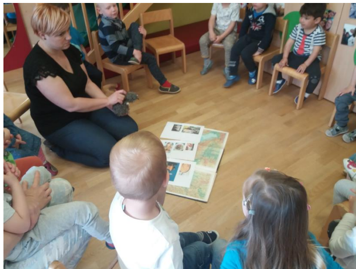
Slika 22: Spoznavanje Bosne in Hercegovine