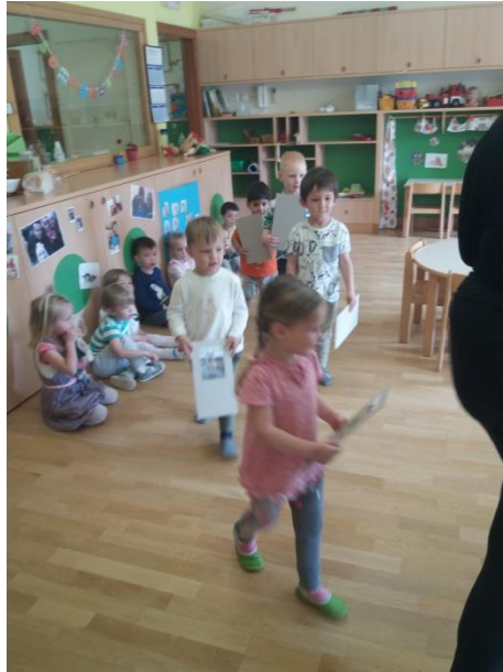
Slika 16: Igra Potujemo po Sloveniji in kdo gre z nami