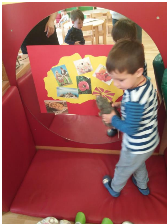
Slika 33: Makedonski kotichek