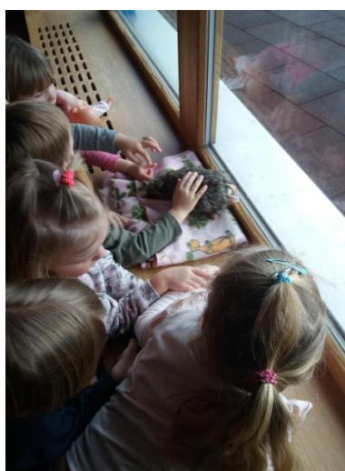
Slika 3 in 4: Priprava prostora za Angelco