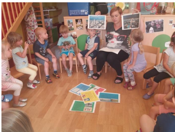
Slika 50: Poimenovanje značilnosti Mehike