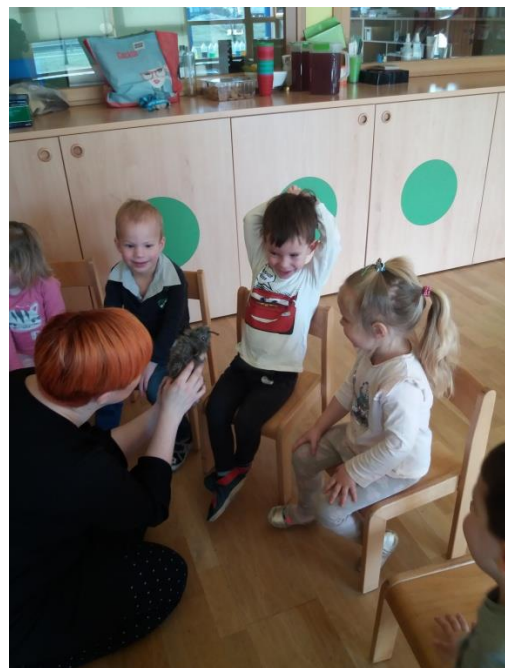
Slika 1 in 2: Uvajanje lutke v skupino