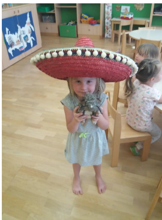
Sliki 55 in 56: Uživanje v Mehiškem dnevu