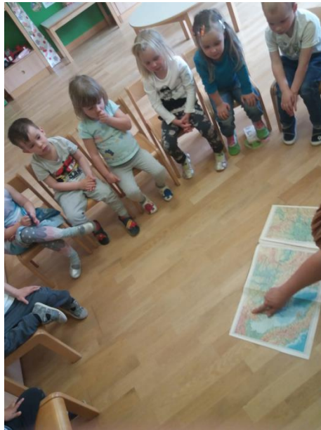
Slika 30: Spoznavanje Makedonije

Otrokom skupaj z Angelco zopet pripraviva zemljevid južne Evrope. Po predhodnem dogovoru z očkom našega dečka, ki prihaja iz Makedonije, dobimo slike nekaterih značilnosti države. Na zemljevidu poiščemo razdaljo med Slovenijo in Makedonijo ter Bosno in Hercegovino in Makedonijo. Preberemo ime glavnega mesta in pregledamo slike, ki predstavljajo značilnosti države. Te bomo kasneje prilepili na nemo karto.