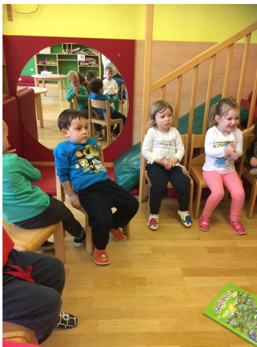
Slika 11: Spoznavamo Slovenijo