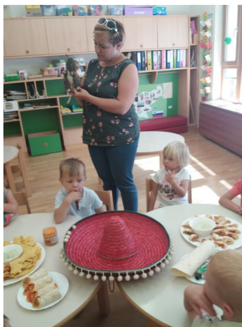
Sliki 53 in 54: Predstavitev Mehike