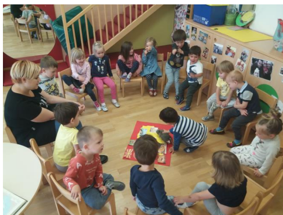
Sliki 31 in 32: Izdelovanje zemljevida Makedonije