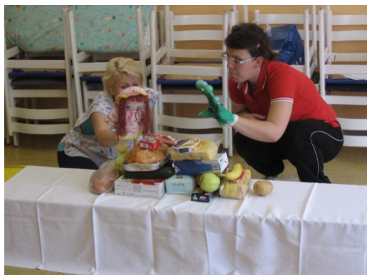
Slika 19: Brokolino dela prehransko piramido

Potem so kuharice prinesle kuhan brokoli. Škrat Brokolino je povedal, da je, preden se je skrtil v košaro, odnesel kuharicam brokoli, da so ga skuhale, da ga bomo lahko zdaj poizkusili. Tako je škrat otrokom ponudil kuhan brokoli. Nekateri so ga z veseljem poskusili, drugi ga niso želeli. Vendar sem bila presenečena, saj ga je poskusil tudi deček, ki po navadi noče poskusiti ničesar novega. Po okušanju brokolija je škrat postal zelo žalosten, ker je osamljen. Ko je otrokom predlagal, da bi naredili take škratke, so bili nekateri tako navdušeni, da so kar poskočili. Potem ne bo več osamljen, saj bo imel veliko družbe. Med igro so po želji nekateri