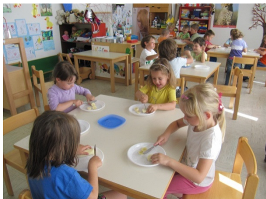
Slika 15: Rezanje banan

Naribana jabolka in narezane banane so otroci sami z žlico zmešali. Dodali smo še malo cimeta, ki so ga otroci prej povohali. Sadno solato so dobili na krožnik ter jo poizkusili. Nekateri so želeli še eno porcijo. Ker se je pripravljanje solat zavleklo, smo stiskanje »oranžnega soka« prestavili na enega izmed naslednjih dni. Otroci so solato, jabolka in banane veliko raje pojedli, ker so jih pripravili sami, kot pa sicer, ko jih dobijo že pripravljene.