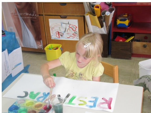
Slika 18: Ime restavracije