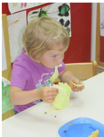
Slika 13: Poizkušanje solate

Po koncu predstav smo sadje oprali, olupili in narezali. Dogovorili smo se, da danes ne bomo delali sadne solate in pomarančnega soka, saj je igra potekala dalj časa, zato sem tokrat sadje le narezala kot po navadi za malico. Eden izmed dečkov pa je vprašal, kaj bomo naredili s solato. Odločila sem se, da jo bomo danes poizkusili samo oprano (ne okisano), naslednji dan pa tudi okisano. Pomočnica vzgojiteljice mi je pomagala in jo odšla oprat. Vsakemu smo ponudili en list solate. Otroci so bili nad njo navdušeni, kar nekaj je bilo takih, ki so jo želeli še.