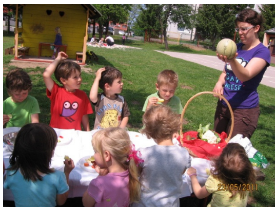
Slika 10: Poizkušanje sadja in zelenjave

Grafoskope sem pustila v igralnici cel teden. Otroci so se tudi naslednje dni še vedno aktivno igrali z lutkami in se vživljali v različne vloge.