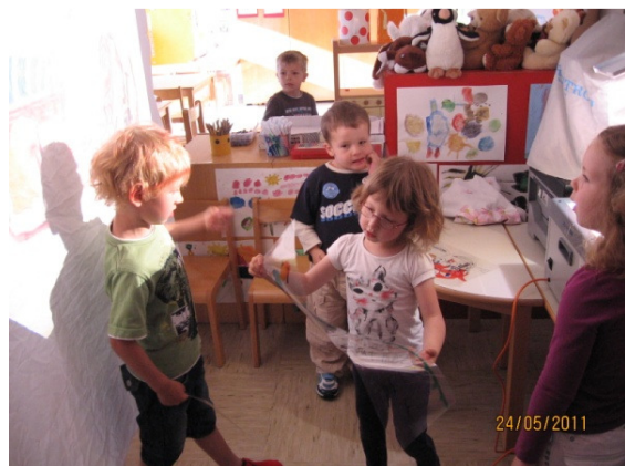
Slika 8: Igranje s senčnimi lutkami