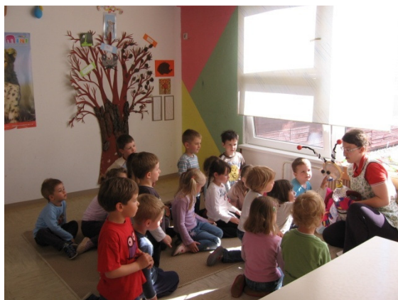
Slika 1: Otroci se spoznajo z vesoljčkom