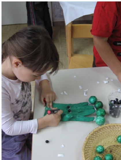
Slika 20: Izdelovanje lutke – Brokolino

Lutka je otroke spodbudila k medsebojnemu pogovaranju o tem, kaj je zdravo in kaj ne. Z ogledom lutkovne predstave in s sodelovanjem v njej so se seznanili s prehransko piramido. Z izdelavo lutke – Brokolina in kasneje igranjem z njo pa so razvijali domišljijско rabo jezika. Lutka jih je močno motivirala k poizkušanju brokolija. Poizkusili so ga prav vsi.