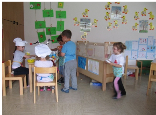
Slika 17: Kuhanje v restavraciji

Otroci so se v koticu igrali celo dopoldne. Zelo so se vživeli v vlogo kuharjev, saj so igrali, da resnično nekaj kuhajo in pripravljajo hrano, saj so do zdaj hrano le prenašali iz enega konca igralnice v drugega ter jo razmetavali.