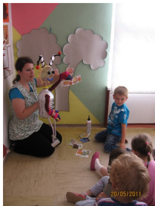
Slika 7: Otroci razvrstijo sličice v drevesni diagram

Ravno danes so zaradi praznovanja 50 let vrtca otroci za malico dobili torto. Veseljček jih je takoj vprašal, ali je torta zdrava, kajti torte ima zelo rad. Povedali so mu, da ne, vendar če jo poješ samo včasih in ne vsak dan, ni nič narobe.