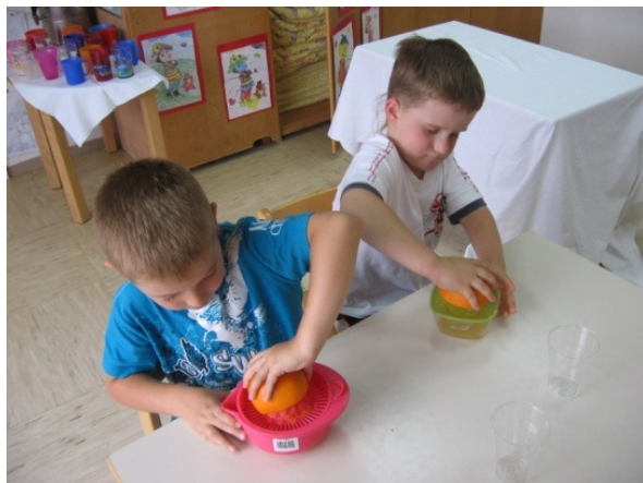
Slika 16: Stiskanje pomaranč

občudovanjem opazovali druge pri delu. Mislim, da jih je najbolj spodbudilo to, da so naredili vse sami, še najbolj pa, da so sok, ki so ga iztisnili, tudi popili. Presenečeni so bili nad luknjo, ki nastane v pomaranči po stiskanju. Te luknje so med seboj primerjali. Preostale pomaranče smo stisnili v sokovniku. Otroci so opazovali, kako priteče sok ter kako in katere odpadke odvrže sokovnik stran. Ker smo imeli še jabolka, smo s sokovnikom stisnili tudi jabolka. Tako da smo najprej poskusili samo pomarančni sok, nato zmešan pomarančni in jabolčni sok in na koncu samo jabolčnega. Otroci so vse sokove zelo radi popili in povedali, da so zelo dobri. Ko smo že hoteli spraviti, je nekdo predlagal, da bi stisnili še banano in naredili bananin sok. Povedala sem jim, da je banana pregosta in ne vsebuje toliko soka, da bi iz nje kaj priteklo. Vseeno smo stisnili tudi banano. Iz nje ni pritekla niti kapljica soka. Videli pa so kam gredo ostanki in stisnjeno banano – mezgo, ki pa ni bila nikomur všeč.