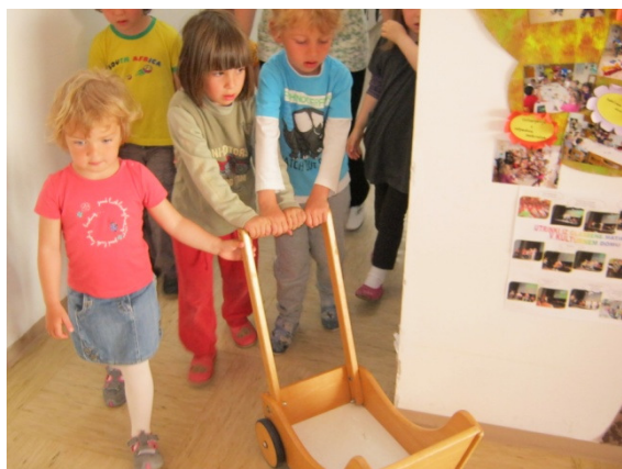
Slika 3: Našli smo voziček za vesoljčka