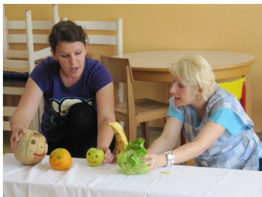
Slika 11: Lutke v predstavi Sadni prepir