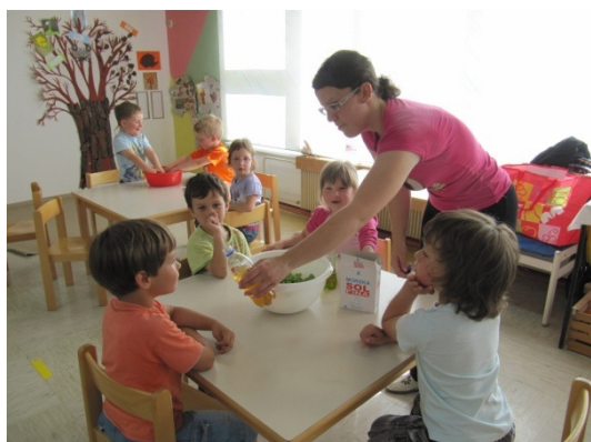
Slika 14: Vohanje kisa

Na koncu smo solato še posolili. Zmešali so jo ravno tako otroci sami. Nato sem vsakemu dala na krožnik solato, ki jo je pripravil. Delali so štirje otroci skupaj, zato so poskusili svojo solato. Poskusili so jo vsi otroci, tudi deček, ki je rekel, da je ne bo in da je ne mara. Pojedel je prav vse s krožnika. Spodbudila sem jih tudi s tem, da sem poudarila, da so naredili drugačno solato, kot jo dobijo v vrtcu, saj jo v vrtcu zmešajo kuharice z vinskim kisom in sončničnim oljem, mi pa smo uporabili jabolčni kis in oljčno olje.