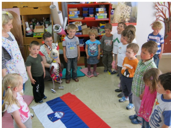
Slika 5: Poslušanje slovenske himne

Otroci so se ob komunikaciji z lutko zabavali in neizmerno uživali. Sami so se lahko odločili in imeli pri tem vsi enake možnosti, da bodo sodelovali z vesoljčkom in mu uredili kotiček. Upoštevali so mnenja drugih otrok, hkrati pa se uspešno dogovarjali in med seboj sodelovali.