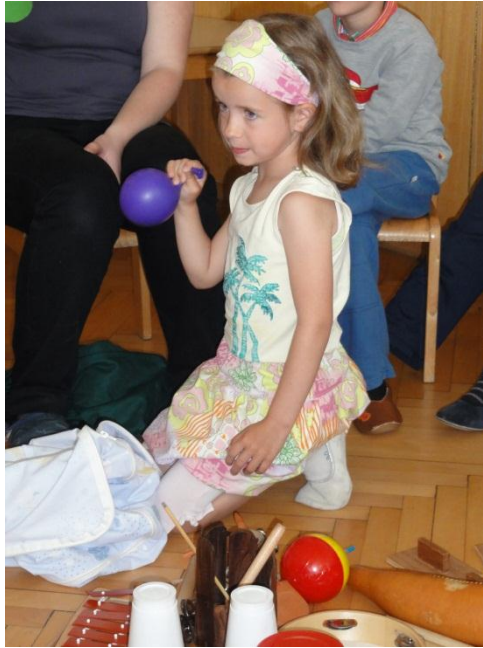
Slika 7: Igranje na male inštrumente.