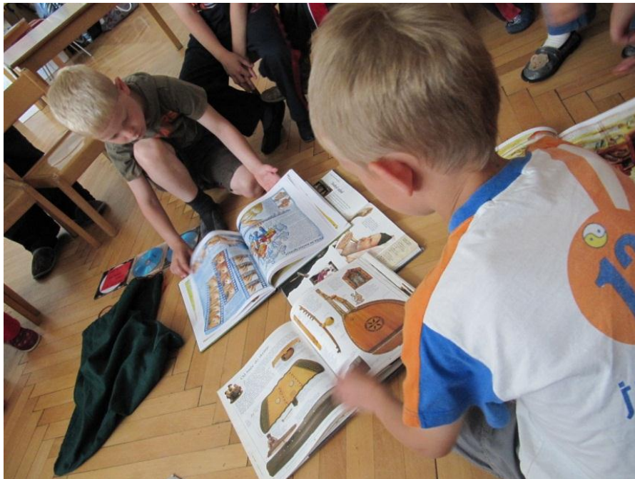
Slika 11: Otroci listajo knjige in prepoznajo inštrumente.

Otroci so spoznali različne medije in preko njih izvedeli kaj novega. Naučili so se, kako poiskati informacije, ki jih želimo. Samostojno so listali knjige in iskali informacije, ki so nas zanimale. Ob glasbenih in video posnetkih so uživali in spoznavali še drugačne oblike medijev.