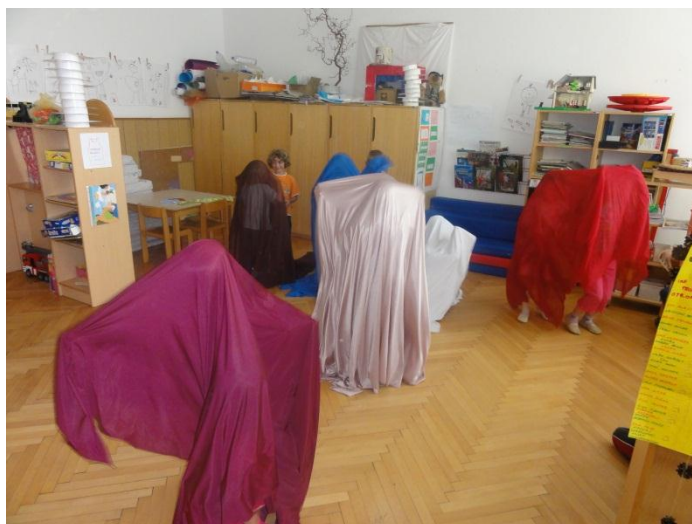
Slika 13: Otroci ustvarjajo z blagom.