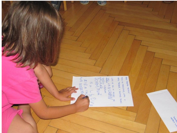
Slika 15: Pisanje pisma škratku Pesmici.

da so sami povedali, kaj vse potrebujemo, da lahko oddamo pismo na pošto. Skupaj smo ga odnesli do pošte in ga vrgli v poštni nabiralnik.