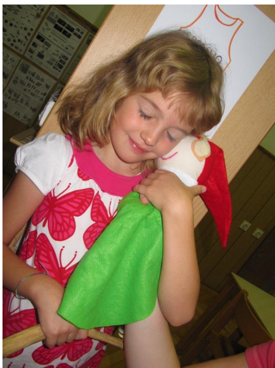
Slika 18: Deklica se posavlja od škratka Pesmice.