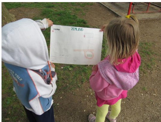
Slika 4: Otroci ugotavljajo, kam nas vodi zemljevid.

Otroci so se seznanili z glasbeno šolo in s tem z novo institucijo v njihovem okolju. Zemljevid, ki jih je pripeljal do nje, pa je v otrocih vzbudil radovednost in željo po raziskovanju.