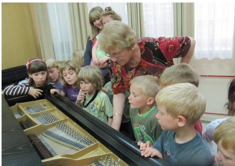
Slika 5: Spoznavanje klavirja.