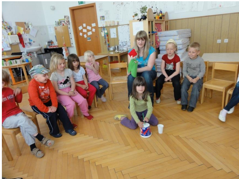
Slika 2: Igranje na drgalni boben.

Škratek je otroke spodbudil k ustvarjanju glasbe in otroci so ob tem uživali in se zabavali. Sam je ob glasbi užival in to je tudi pokazal in povedal otrokom. Njegovo navdušenje je še povečalo motivacijo otrok in brez težav so sedeli v krogu in drug drugega poslušali. Otroci so bili zadovoljni, ker je tudi njim uspelo zaigrati na inštrument, kljub temu da so nekateri potrebovali malo več spodbude in nekaj pomoči. Zvok so proizvedli sami in za svoj ritem dobili pohvalo in aplavz.