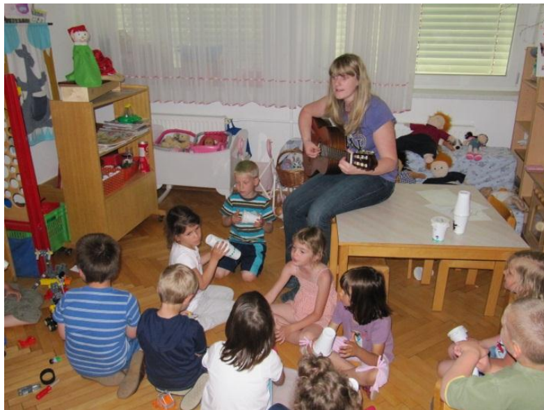
Slika 10: Skupno petje pesmice in igranje na male inštrumente.