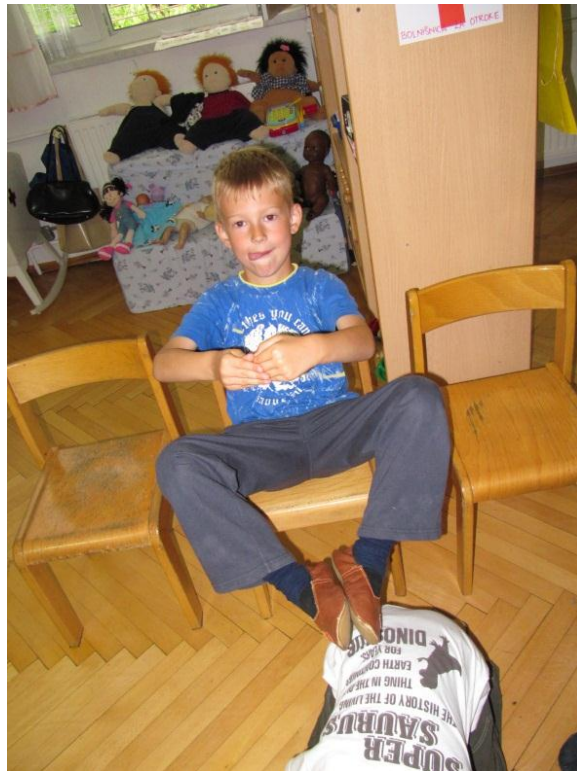
Slika 12: Prikaz bobna z lastnim telesom.

Otroci se vedno znova razveselijo, ko v igralnico vstopi škratek Pesmica. Komaj čakajo, da jim pove, kaj jim je pripravil, in ob tem se umirijo in mu prisluhnejo. V pogovoru z njim uživajo, hkrati pa se sproščajo. S pomočjo kviza so otroci pridobili nekaj novega znanja, si razvijali sposobnost po zvoku prepoznati inštrumente in raziskovali ter eksperimentirali s svojim telesom.