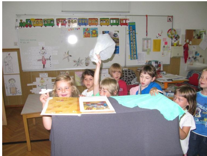
Slika 17: Predstava, pripravljena za škratka Pesmico.

predstavo. Želela sem, da se otroci poizkusijo v animiranju lutk in v igranju glasbene spremljave. Otrok ravno tako nisem opominjala, če je bila izvedba predstave malo drugačna, kot je zgodba v resnici. S tem so se vživeli v domišljjski svet, kar pa se mi zdi pozitivno in pomembno za njihov razvoj. Po končani predstavi je škratek Pesmica otrokom zaploskal, jim povedal, da mu je bila lutkovna predstava všeč in se jim zahvalil za takšno lepo presenečenje. Otroci so prihiteli k njemu in se z njim pogovarjali. Povedali so mu, kaj vse se jim je zgodilo, in škratek jih je z veseljem poslušal in sodeloval v pogovoru. Res je lepo doživljati ta občutek, ko se otroci ne morejo odtrgati od lutke. Z njo bi se pogovarjali neskončno dolgo in ji povedali prav vse, kar se jim dogaja. Izraza na obrazu otrok, ko ga lutka posluša in mu odgovarja, se ne da opisati z besedami. Čarobna moč lutk otroke popolnoma prevzame in jih popelje v domišljjski svet, kjer je vse mogoče. Škratek Pesmica se je nato od njih poslovil. Otroci so ga stiskali k sebi, mu dali poljubček, ga božali, mu pomahali ... Zanimivo je bilo opazovati otroke, kako čustveno so doživljali škratka. Objeli so ga, kot da bi bil resničen, mu govorili kako je lep, da ga bodo pogrešali, naj se ima lepo ... Škratek se je od vseh poslovil in se odpravil nazaj v Deželo glasbe.