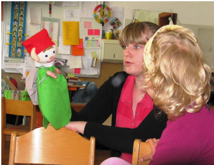
Slika 1: Škratek Pesmica se predstavi.

Otroci so se ob komunikaciji z lutko zabavali in neizmerno uživali. Sami so se lahko odločili in pri tem imeli vsi enake možnosti, da bodo sodelovali s škratekom in mu pomagali krajšati čas. Škratek jih je spodbudil k izražanju glasbe, pri tem so bili otroci veseli in zadovoljni.