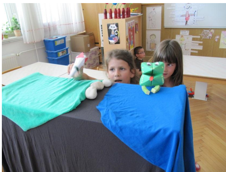
Slika 16: Spontana igra otrok po izdelovanju lutk.

Otroci so ob lutkovni predstavi uživali in se zabavali. Nasmeljali so se zabavnim prizorom in miški pomagali, če je bilo to potrebno. Uživali so v likovnem ustvarjanju in si s tem krepili fino-motoriko in likovno izražanje. Z veseljem so ustvarjali gledališče in ga s tem preko lastne izkušnje tudi spoznavali. S pisanjem pisma so se spoznavali z obliko komuniciranja in prenosa informacij.