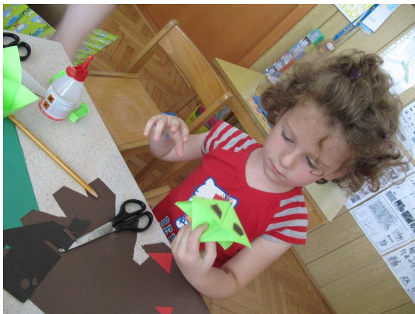
Slika 14: Otroci izdelujejo lutke.