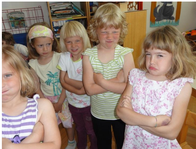
Slika 6: Takšni smo, kadar smo jezni.

Škratek je otroke z veliko vrečo inštrumentov spodbudil k raziskovanju. Otroci so raziskovali in ugotavljali ustrezen način igranja na inštrumente in ob tem doživljali občutek ugodja. Med seboj so si pomagali, se dogovarjali in prilagajali ter si s tem razvijali socialno podobo. Izražali so se z mimiko in si s tem razvijali gledališke sposobnosti, ob tem pa so se neizmerno zabavali in nasmejali.