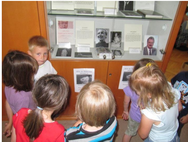
Slika 9: Otroci začudeno opazujejo letake.

zastavljanjem ugank so si razvijali pevsko ustvarjalnost in za dobro izvedeno nalogo dobili pohvalo.