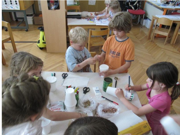
Slika 8: Izdelovanje malih inštrumentov.