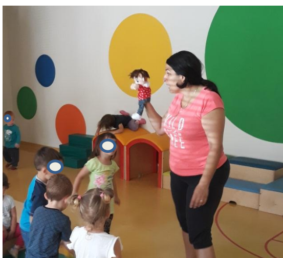
Slika 3.23: Lutka poda navodila otrokom

Pri tej dejavnosti so bili cilji v celoti doseženi, ob spodbudi lutke so bili otroci uspešnejši tako pri oblačenju kot obujanju, vsi so pozorno prisluhnili navodilom, ki smo jim jih podali preko lutke.