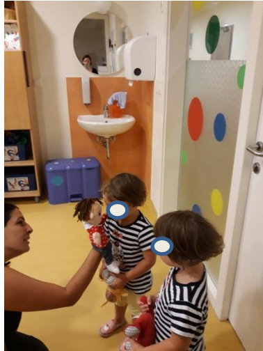
Slika 3.11: Lutka poboža deklico