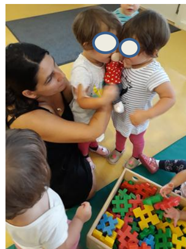
Slika 3.18: Deklici objemata lutko