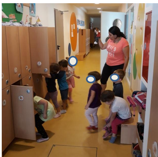
Slika 3.24: Lutka spodbuja otroke k samostojnosti