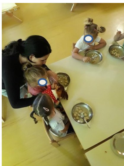
Slika 3.20: Lutka pomaga pri pravilni držbi žlice