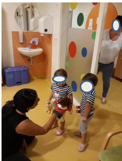
Slika 3.9: Lutka pozdravi deklici ob prihodu v vrtec

Glede na izvedeno dejavnost so bili cilji delno doseženi, deček je ob prisotnosti lutke še teže vstopil v igralnico in tudi komunicirati ni želel z njo. Odzivi vseh ostalih otrok v igralnici so bili pozitivni.