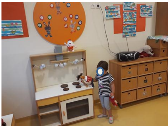
Slika 3.7: Deklica lutki pokaže kuhinjski kotiček