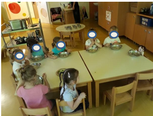
Slika 3.19: Lutka opozarja deklico na pravilno sedenje pri mizi