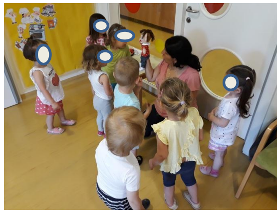
Slika 3.6: Deklica ne želi, da je lutki ime Luka