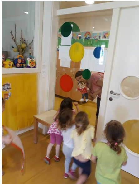
Slika 3.3: Lutka potrka na okno

me je presenetilo, da nihče od otrok ni ugovarjal deklici, ki ni želela lutke poimenovati Luka, vsi so jo le sočutno opazovali in poslušali. Glede na skrb otrok za lutko in navdušenje nad igro z njo lahko rečemo, da so lutko sprejeli kot prijateljico.