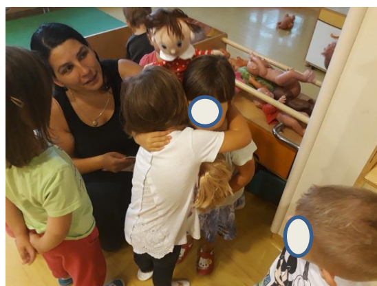
Slika 3.29: Objem deklic, udeleženih v konfliktu