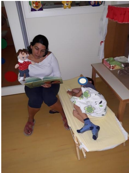
Slika 3.30: Pripovedovanje lutke