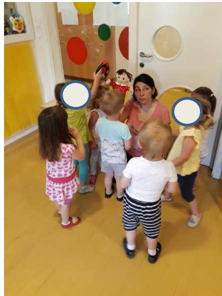
Slika 3.4: Izbira imena za lutko