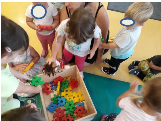
Slika 3.17: Deklica kaže lutki že pospravljene igračke