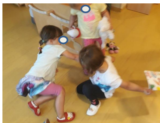
Slika 3.27: Konflikt med deklicama