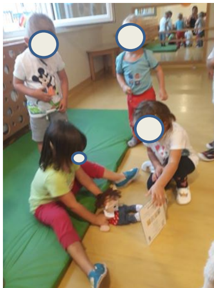
Slika 3.8: Otroci z lutko gledajo slikanico