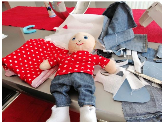
Slika 3.2: Končno oblikovanje lutke doma