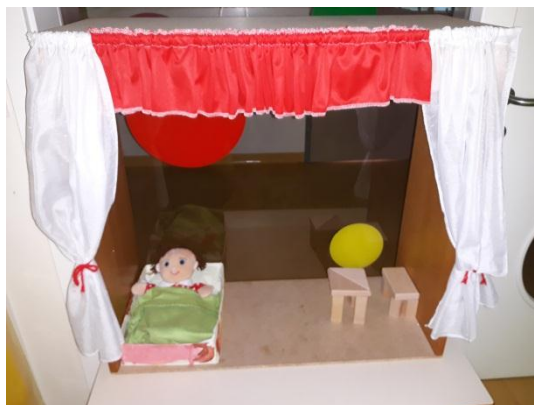
Slika 3.32: Lutka spi v svoji postelji