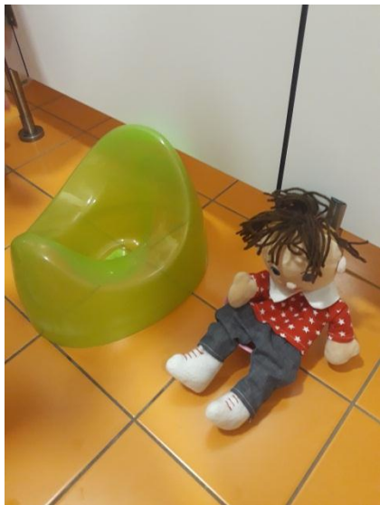
Slika 3.12: Lutka na kahlici