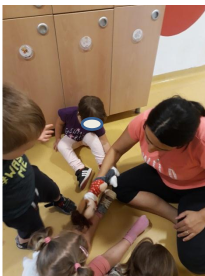
Slika 3.25: Pomoč lutke pri obujanju