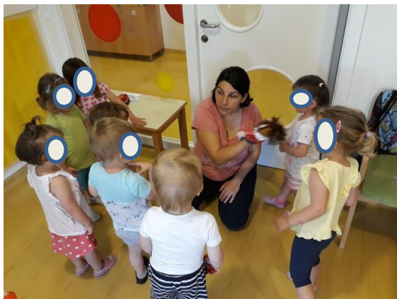
Slika 3.5: Deklica spoznava različne materiale blaga