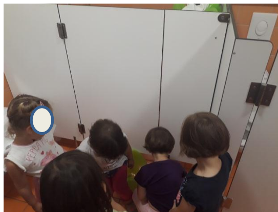
Slika 3.13: Deklica želi sedeti na kahlico poleg lutke