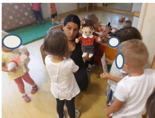
Slika 3.28: Reševanje konflikta s pomočjo lutke