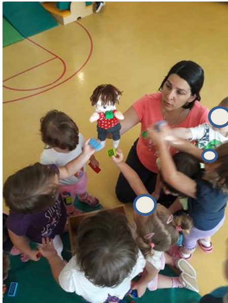
Slika 3.15: Otroci lutki prinašajo kocke