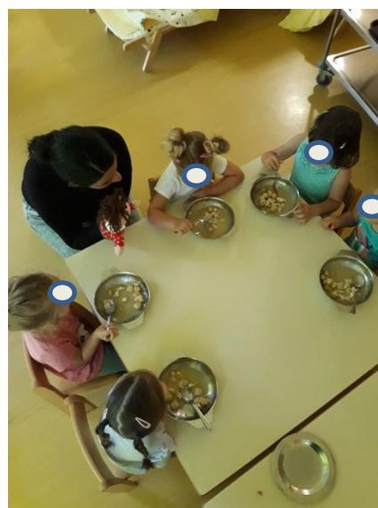
Slika 3.21: Lutka opozarjana na tišje govorjenje pri mizi