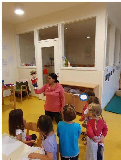
Slika 3.26: Konflikt med vzgojiteljico in lutko

Med potekom dejavnosti in opazovanjem otrok se je pokazalo, da so cilji doseženi. Otroci so ob pomoči lutke lažje reševali spor, lutka je pritegnila njihovo pozornost in posledično so ji prisluhnili. Komunikacija z lutko je potekala sproščeno. Zaupanje lutki so pokazali s tem, ko so jo prosili za pomoč pri reševanju težav.