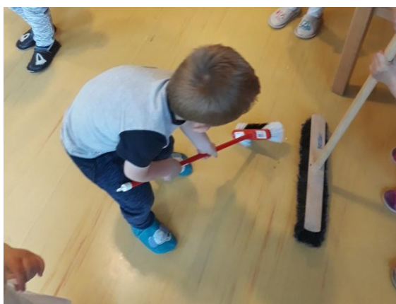
Slika 3.22: Deček pometa po kosilu