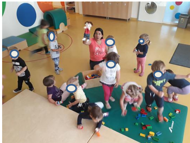
Slika 3.16: Otroci pospravljajo ob petju pesmi