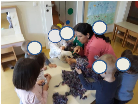
Slika 3.1: Polnjenje zašite osnove za lutko