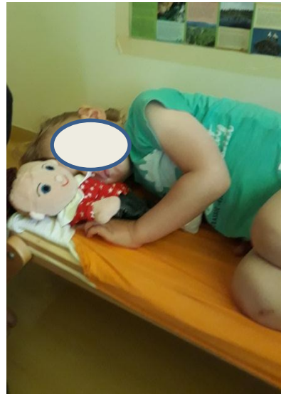
Slika 3.31: Deček spi z lutko