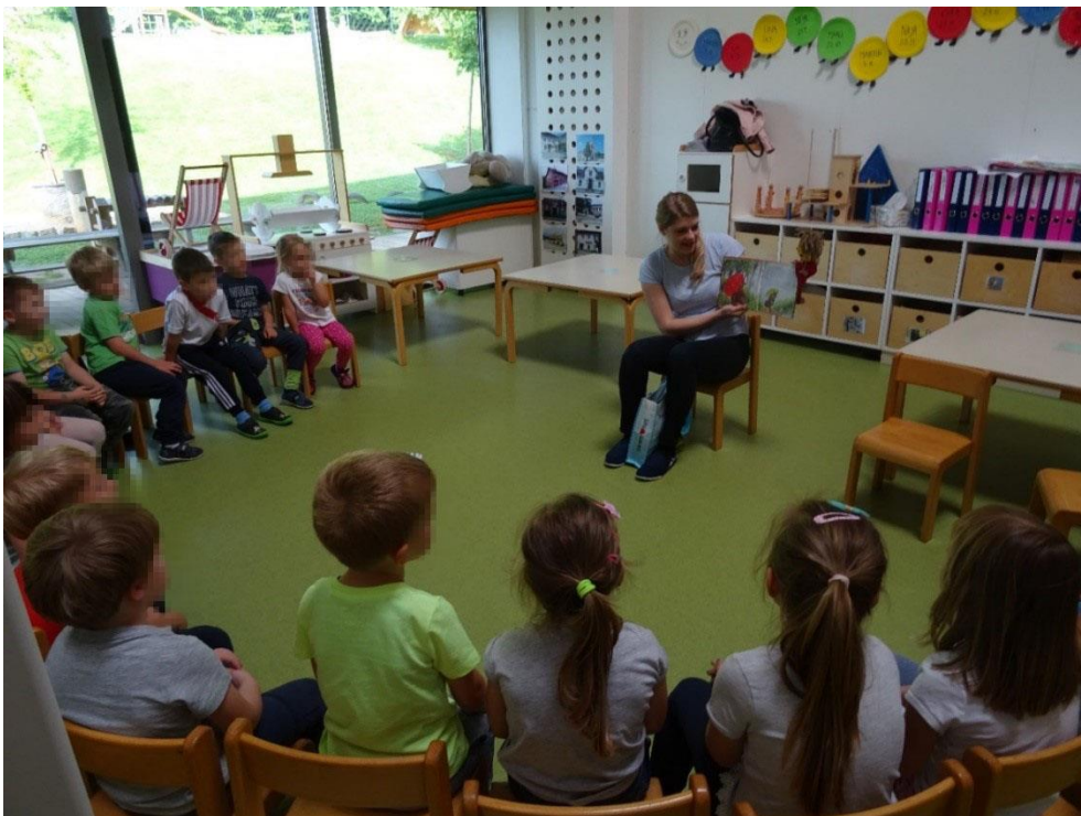
Slika 5: Poslušanje pravljice

živali. Ob gledanju slikanice smo zgodbo skupaj tudi obnovili. Otrokom smo podali navodila, naj se usedejo k mizam. Vsak je dobil delovni list, na katerem so bile na eni strani naslikane živali iz zgodbe, na drugi strani pa je bil naslikana Zoja z dežnikom. Med živalmi in Zojo je bila na rahlo narisana potka. Naloga otrok je bila, da gredo najprej s prstkom po potki, nato pa še z barvico. Pri tej nalogi so si otroci razvijali drobno motoriko. Opazili smo, da so delali vsi otroci, pri tem pa imeli dolgo trajajočo motivacijo. Otroke smo z lutko Zojo spodbujali, da se čim bolj držijo črte. Ko je večina otrok že končala z delovnim listom, smo jim ponudili igro spomin. Vsi otroci so pravila te igre že poznali, vseeno pa smo jih skupaj obnovili. Poudarek smo dali na temu, da ko odkrijejo slikico, na glas povedo, katera žival je na sliki. Otroci so se igro igrali dvakrat, nekateri tudi trikrat. Popravili bi to, da bi bile sličice na tršem in ne na navadnem papirju, saj so otroci lahko videli sličico na drugi strani in tako nekajkrat goljufali pri pravilih igre. Dejavnost smo zaključili, ko smo opazili, da je otrokom motivacija upadla.