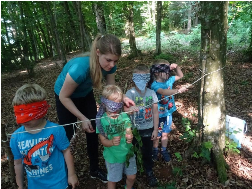
Slika 21: Prepoznavanje gozdnih predmetov z zaprtimi očmi