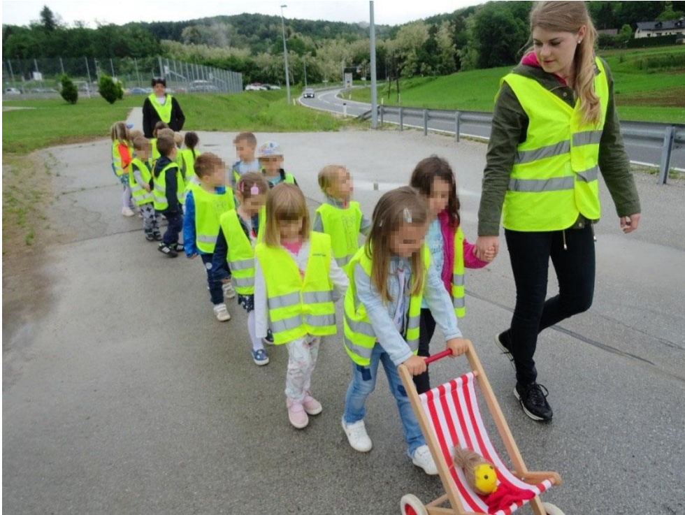
Slika 4: Sprehod do kraja Mirna Peč