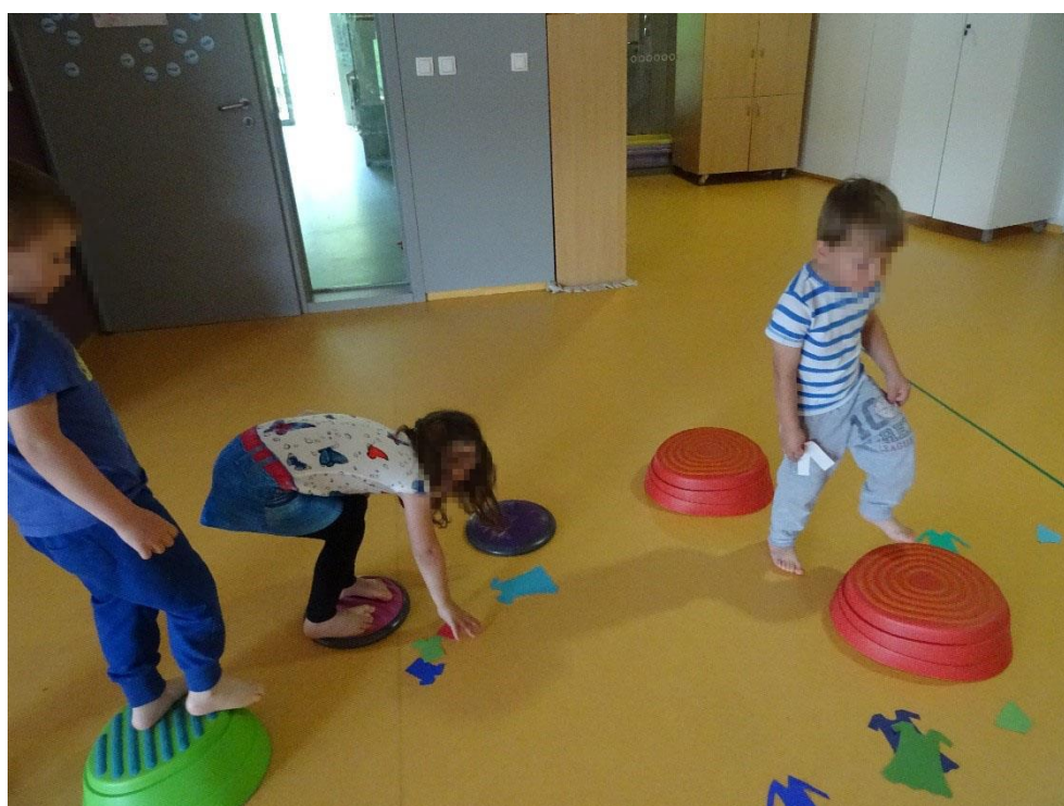
Slika 16: Pobiranje oblačil med poligonom