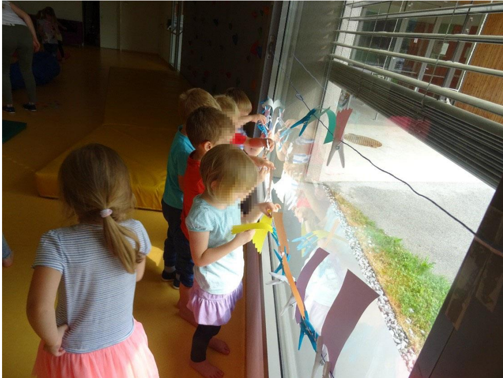
Slika 17: Obešanje oblačil s ščipalko na vrvico