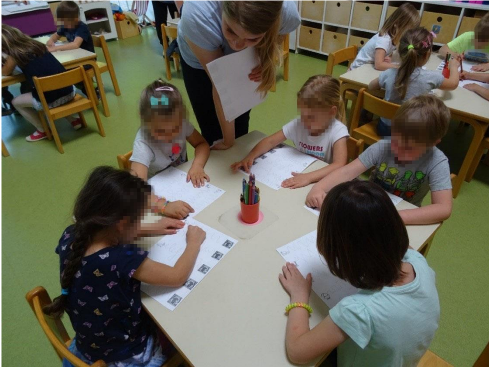
Slika 6: Reševanje delovnih listov