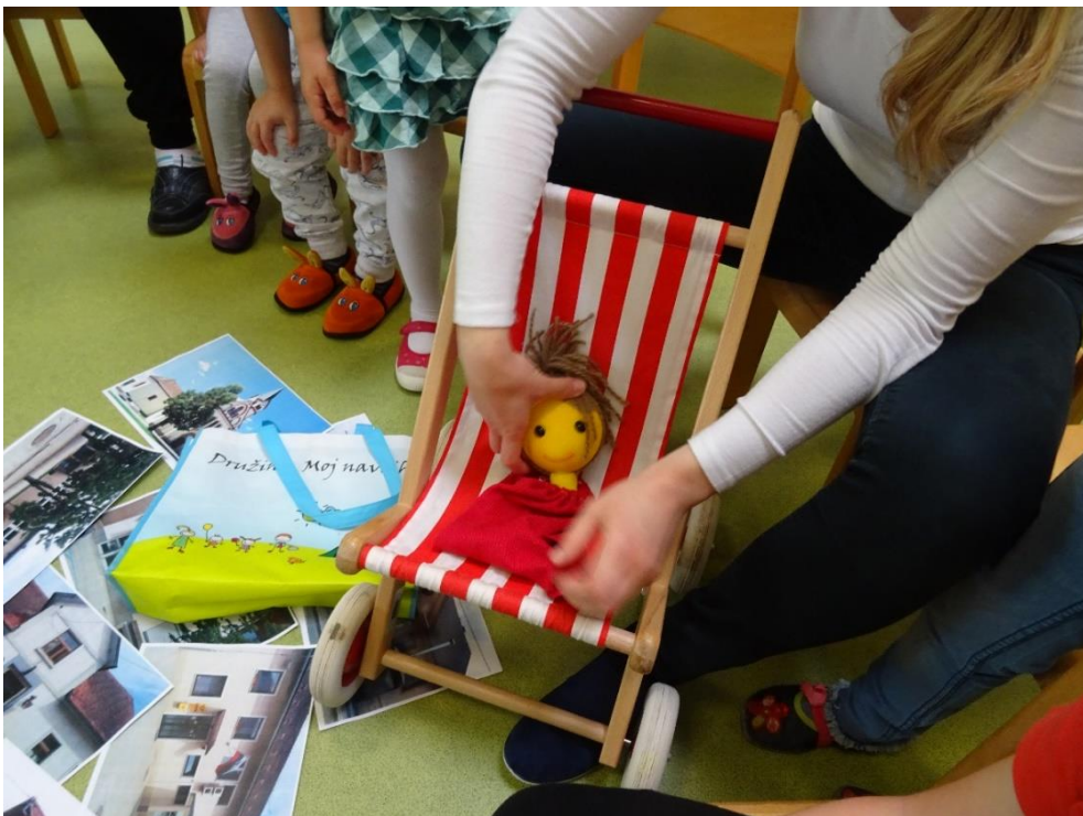
Slika 3: Lutko Zojo položimo v voziček