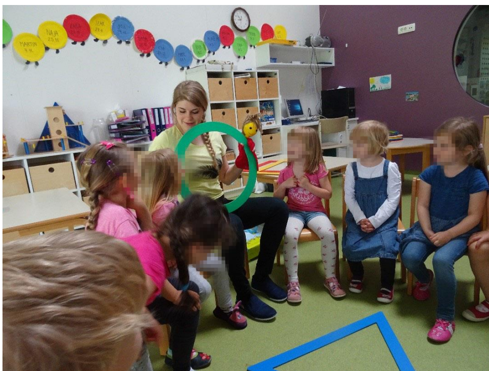
Slika 10: Spoznavanje geometrijskih oblik

opazili težave, smo otroka spodbudili, da skupaj preštejemo kote na liku. Tako je otrok lažje razumel, zakaj je neki lik trikotnik oziroma štirikotnik. Kasneje smo predmete razvrščali še po barvah. Razvrščanje po barvah je otrokom šlo veliko bolje od rok kot razvrščanje po oblikah. Da smo matematično področje povezali še z gibalnim, smo se v zaključku razgibavali z obroči. Vsak otrok je dobil svoj obroč in si poiskal prostor v igralnici. Kazali smo različne vaje za razgibavanje, oni pa so ponavljali za menoj. Vsakemu otroku smo dali možnost, da je pokazal svoj gib. Vsako vajo smo naredili desetkrat. Otroke smo spodbudili k štetju do deset. Po nekaj minutah smo pospravili obroče na stojalo. Otrok, ki je prinesel obroč, je povedal, kakšne barve je. Za konec smo se v krogu prijeli za roke in zaplesali rajalni ples Bela lilija. Otrok, ki je bil v krogu, je povedal, kakšne barve je njegova majčka. Tako smo denimo namesto 'bele lilija' zapeli 'modra lilija'. Otroci so bili motivirani in so nestrpno čakali, da bodo izbrani za ples v krogu. Po nekaj minutah smo dejavnost zaključili. Dejavnost je trajala dobro uro. Med samimi dejavnostmi je v oddelku vladala pozitivna klima. Menimo, da smo z lutko dobro motivirali otroke, saj so bili pripravljeni na dejavnosti in so v njih z veseljem aktivno sodelovali.