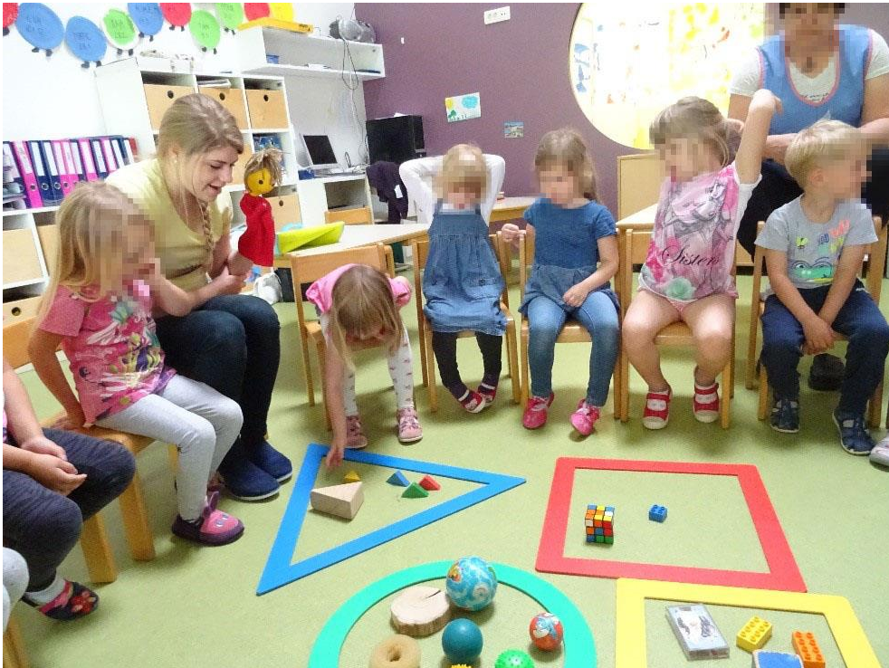
Slika 12: Razvrščanje predmetov po geometrijski obliki