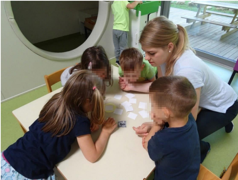
Slika 8: Igra spomin