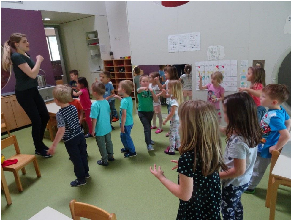
Slika 9: Ples Moj medvedek Jaka

ogledali razstavo na hodniku. Vrnili smo se v igralnico, kjer smo skupaj zapeli in zaplesali na skladbo Moj medvedek Jaka. Otrokom smo kazali gibe, ki so jih ponavljali za nami. Dejavnost je trajala eno dobro uro. Menimo, da smo dosegli zastavljene cilje. Otroci so nam sledili in upoštevali navodila. Z lutko Zojo so bili dobro motivirani.