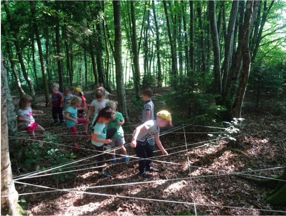
Slika 20: Pajkova mreža