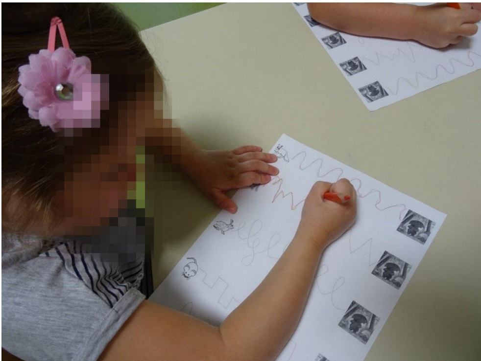
Slika 7: Reševanje delovnih listov