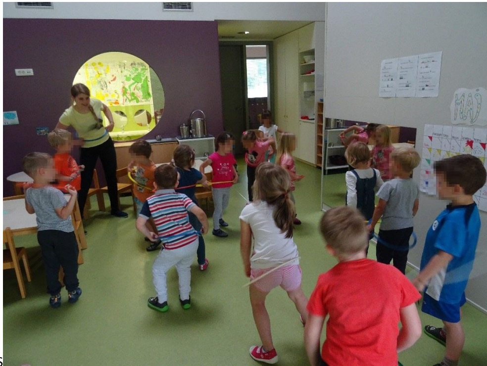
Slika 13: Gibanje z obroči