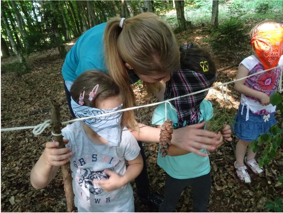
Slika 22: Prepoznavanje gozdnih predmetov z zaprtimi očmi