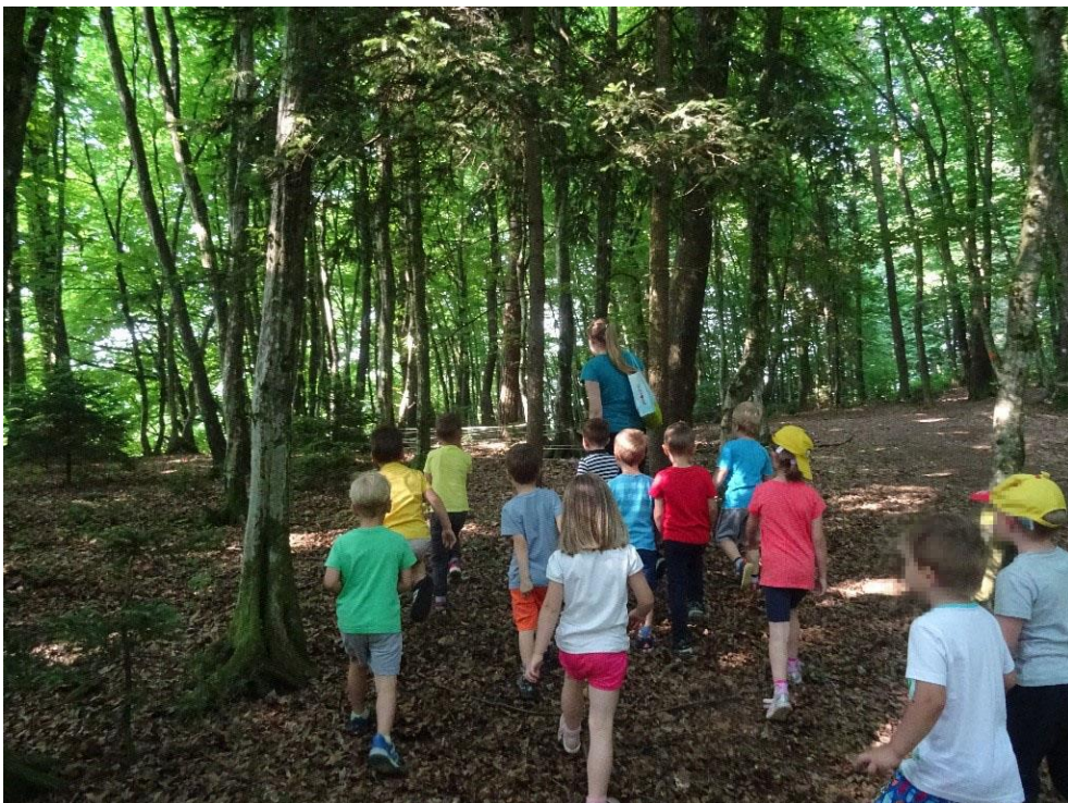
Slika 19: V gozdu poiščemo pajkovo mrežo