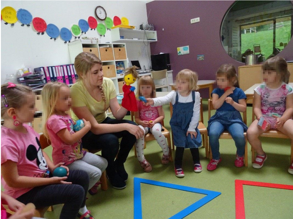
Slika 11: Razvrščanje predmetov po geometrijski obliki