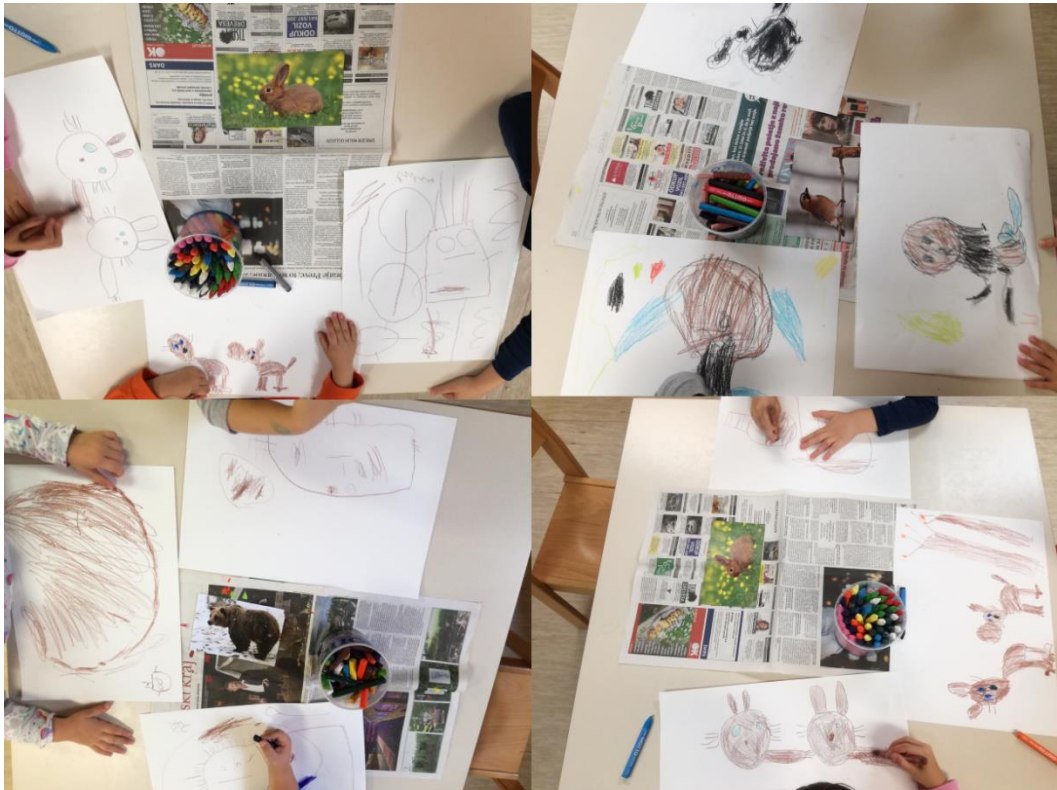
Slika 16: Dejavnosti v drugem starostnem obdobju.

Na koncu smo pa lutke pritrdili na palice in tako so nastale naše ploske lutke. Lutke od vseh otrok so pridobile svoj prostor v lutkovnem kotičku, tako da so se lahko igrali s svojimi lutkami. Velika gneča je nastala v kotičku, saj so se otroci želeli igrati z lutkami, prav tako so si postavili stole in nekateri so sedeli in poslušali, ostali pa so uprizarjali lutkovno predstavo. Zanimivo jih je bilo opazovati, saj si otroci veliko zapomnijo v kratkem času. Najbolj so uživali v igranju preprirov med živalmi. Otroci so pravljico uprizarjali s svojimi in našimi lutkami, tu jih nismo omejevali, le opazovali smo jih in jih z navdušenjem poslušali. Nekaj časa smo bili opazovalec predstave, nato pa so si zaželeli, da bi tudi mi nastopali skupaj z njimi. Z veseljem smo se pridružili njihovi igri. Z dejavnostmi smo si pridobili nova znanja in izkušnje, ki jih ne bomo nikoli pozabili. Naši cilji in nameni so bili popolnoma izpolnjeni.