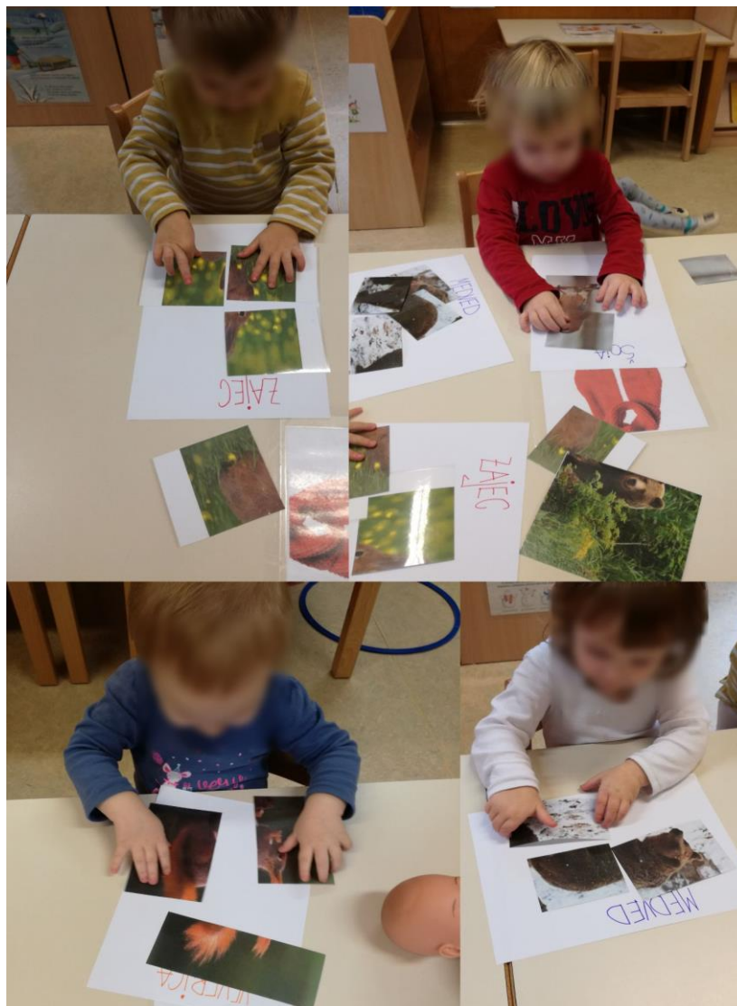
Slika 14: Dejavnosti v prvem starostnem obdobju.

razlike, kolikor se le da. Predvsem smo pa želeli, da otroci sami povedo, ali je na fotografiji deklica/deček, kaj ima oblečeno, kakšne lase ima ... Nato pa smo jim ob drugih zaposlitvah in prosti igri pripravili še živalske sestavljanke. Namreč na mizo smo postavili obrise živali, otroci pa so na te slike postavljali pravilno zloženko, da je nastala pravilna žival. Moramo priznati, da so nekateri otroci nalogo opravili z lahkoto, drugi pa so potrebovali spodbudo. Otroci so se sestavljanek lotili samostojno. V diplomskem delu smo se za izvedbe priprav srečevali z različnimi starostnimi skupinami otrok in opazili smo ogromne razlike ter se tudi naučili stvari prilagajati starosti otrok. Glavno spoznanje smo dosegli, ko smo opazili, da najmlajši otroci, in pa tudi starejši, mnogo stvari že razumejo in zmorejo doseči le višje cilje in naloge jim moramo zadati ter jih ne smemo podcenjevati.