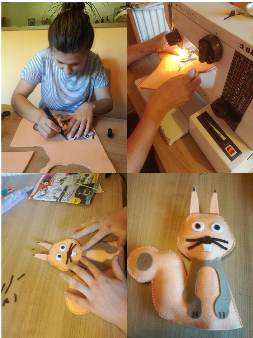
Slika 9: Potek izdelave lutk.