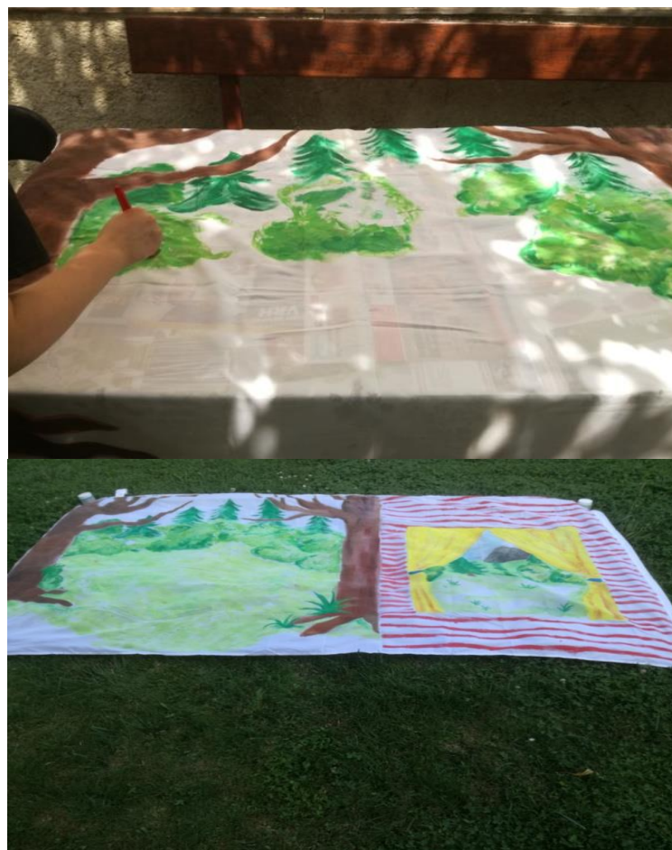
Slika 10: Potek izdelave scene.

Za lutkovno-gledališko predstavo smo naredili tudi sceno, da bi bila naša lutkovna predstava kar se da bolj uprizorjena in doživeta. Sceno smo izdelali tako, da smo na belo rjuho s tempera barvami narisali podobo jase in gozda, saj se velika večina pravljičice dogaja prav na jasi ob gozdu. Narisali pa smo tudi podobo notranjosti medvedje hiše, ki smo jo potrebovali predvsem ob koncu pravljičice za dialoge med medvedki. Uporabili smo veliko zelene in modre barve, pri notranjosti hiške pa smo uporabili pisane barve.