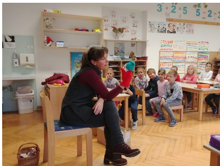
Slika 3: Pripovedovanje z lutko.

Tu gre za preprosto pripovedovanje pravljic z lutkami, ko zgodbo pripoveduje lutka v prvi osebi, otroci zgodbo doživijo popolnoma drugače. Učitelju/vzgojitelju se tako ponuja možnost za kreativno interpelacijo in ustvarjanje pravljničnega/magičnega sveta za otroke.