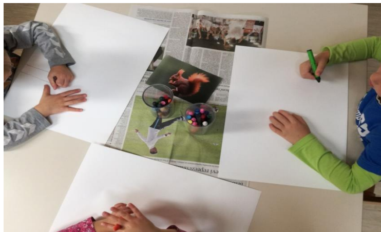
Slika 15: Risanje živali.