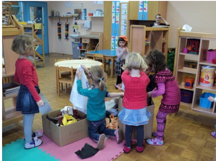
Slika 2: Priprava scene.