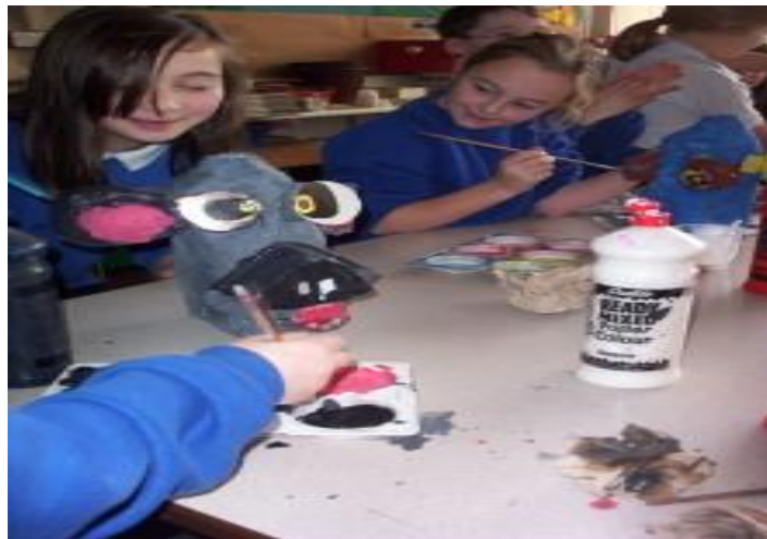
Slika 6: Izdelava lutk.