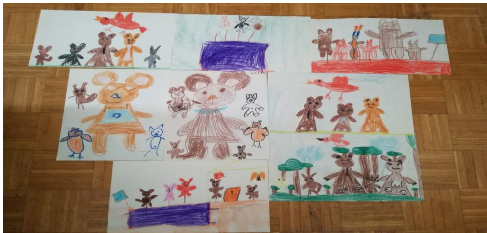
Slika 20: Risbe otrok.

Če hočeš otroka razumeti, motivirati in postati z njim vsaj za trenutek dvokomponentno bitje, moraš z njim vzpostaviti dialog. Po obliki je dialog horizontalna dvosmerna komunikacija med osebami, med katerimi vlada empatični odnos. Klasični vzgojitelj namreč ponuja odgovore – vzpostavlja vertikalno, enosmerno komunikacijo. Vnaprej nekaj ve in je zato njegova vloga bistveno drugačna kot vloga raziskovalca – ustvarjalca, ki se skupaj z otroki vedno znova podaja v neznan svet iskanja odgovora na skupaj zastavljeno vprašanje. V šoli so pomembni odgovori, za umetnost pa so pomembnejša vprašanja. Ta so namreč začetek nove, vedno drugačne poti (Misailović, 1991).