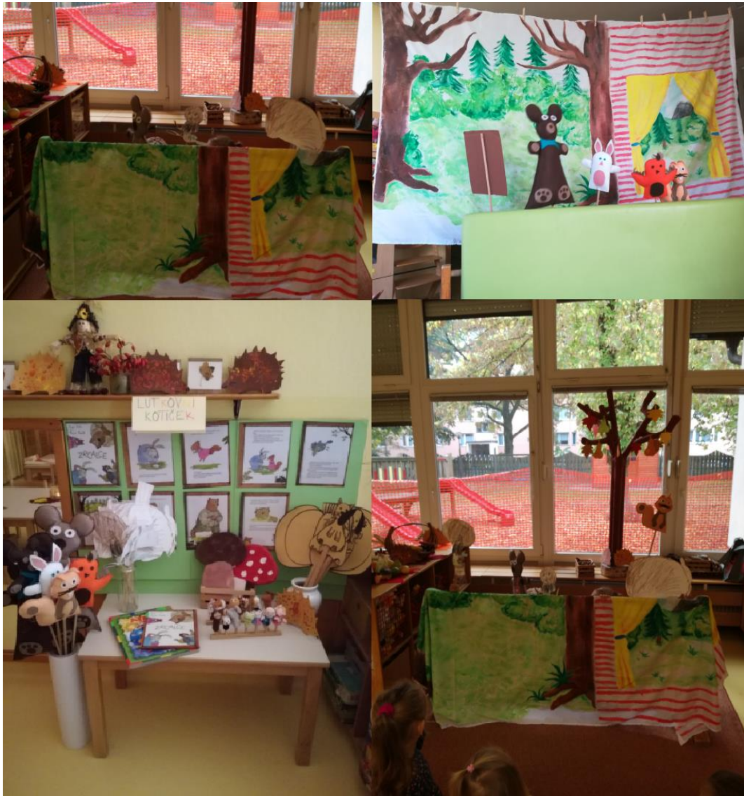
Slika 17: Lutkovni kotiček in izvedba lutkovne predstave v drugem starostnem obdobju.