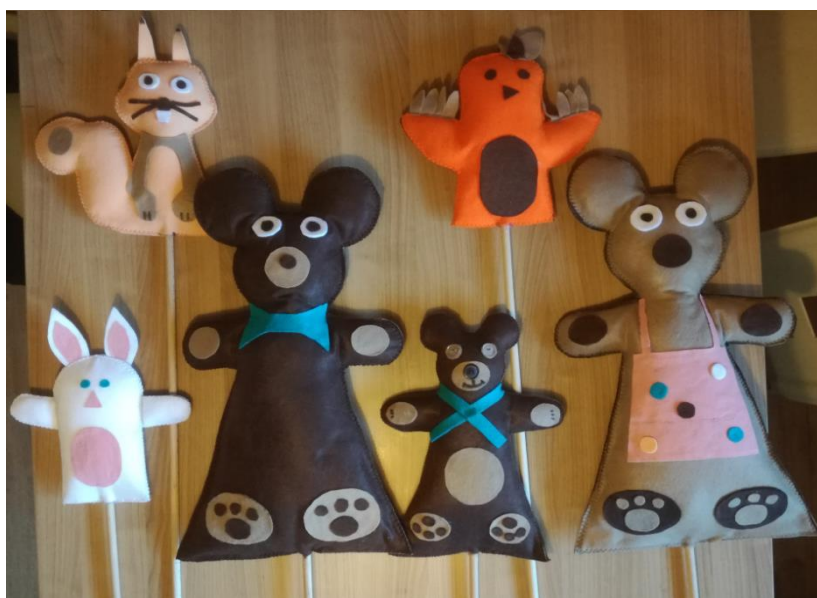
Slika 8: Izdelane lutke.

Izdelave lutk za našo predstavo smo se lotili tako, da smo vsako lutko dvakrat narisali na filc in jo nato izrezali. Pomembno nam je bilo, da so lutke preproste in da otroke pritegnejo z vso svojo močjo. Nato smo lutke ob robovih sešili s pomočjo šivalnega stroja. Lutkam smo potem dodali vse potrebne dodatke: oči, smrček, brke, perje ... Na koncu smo lutko napolnili s poliestrom in dodali palico. Tako so nastale naše lutke na palici. Vseh šest lutk je nastalo na enak način.