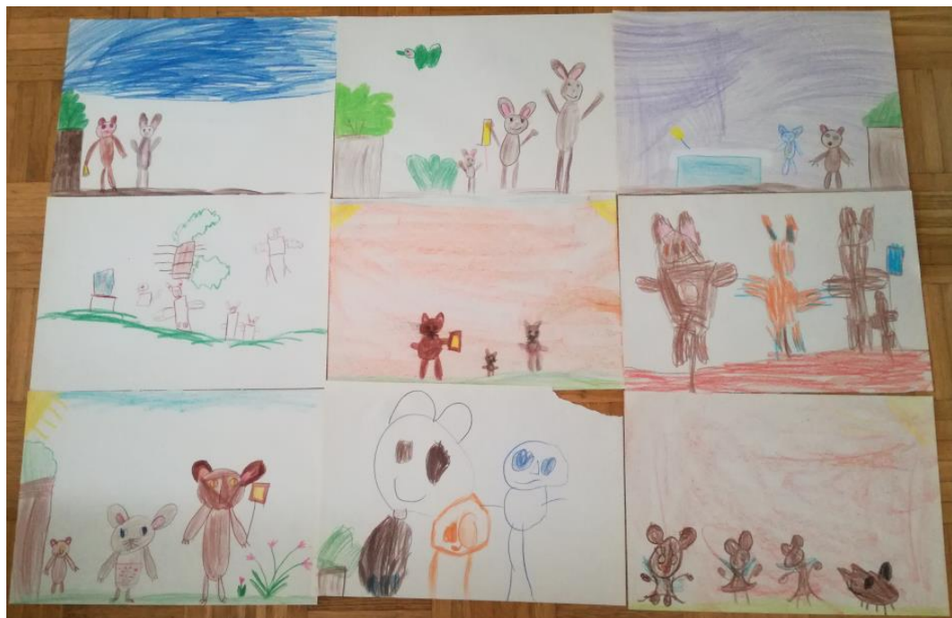
Slika 19: Risbe otrok na temo gledališke predstave.

Pravljica in lutke so otroke vidno navdušile. Veliko jim je pomenilo, da so lutke lahko prijeli, jih objeli, potipali, se z njimi prosto igrali. Prav zato so se hitro po končanih dejavnostih in postavljenem lutkovnem kotičku začele otrokove prve spontane dejavnosti. Prav tu se lahko obrnemo na prvi zastavljeni cilj, otroci so širili svoj svet domišljije in se ob enem spoznali z likovno umetnostjo na njim dojemljiv in zabaven način. Vzeli so lutke in odšli za paravan odigrati predstavo. Nekateri otroci so si naše besede in besedne zveze zelo dobro zapomnili in jih tudi uporabili v svoji lutkovni predstavi. Zanimivo mi je bilo opazovati otroke in njihovo igro, čeprav je bila sama zgodba pravljice dosti zapletena. Prav tako smo z drugačnim pristopom dela neko »težje razumljivo zgodbo« predstavili na njim bolj razumljiv in zabaven način. Otroci so bili tako navdušeni, da če niso bile proste naše lutke na palici, so uporabili svoje ploske lutke in se igrali z njimi. Pri manjših otrocih smo opazila tudi ogledovanje lutk in s tem usvajanje pojma identifikacije. Opazili smo, da otrok ne potrebuje veliko, da začne svojo lutkovno igro. Prav tako so nas lutke več dni spremljale ob obrokih in vodenih dejavnostih v igralnici. Ob koncu lutkovnega tedna so najstarejši otroci spontano narisali prečudovite risbice na temo lutkovne predstave Zrcalce.