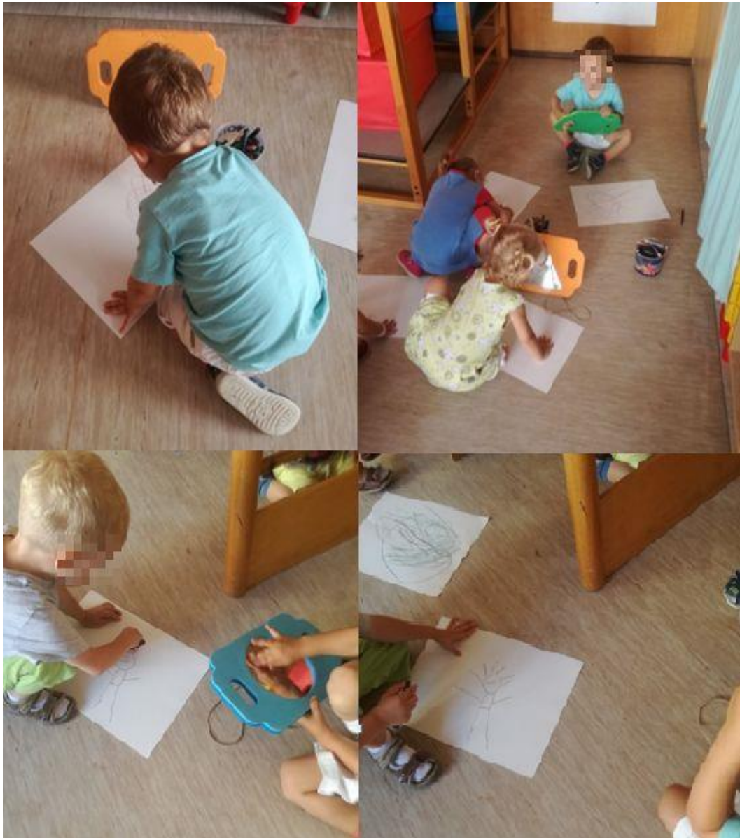
Slika 12: Dejavnosti v prvem starostnem obdobju.