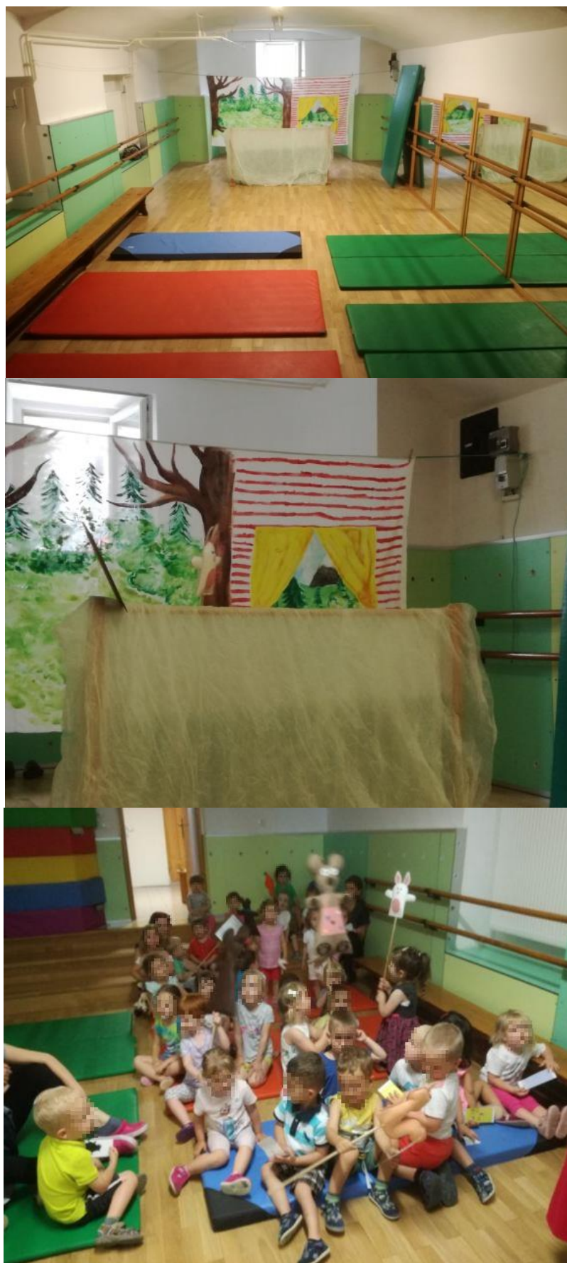
Slika 11: Igralni prostor gledališke predstave.