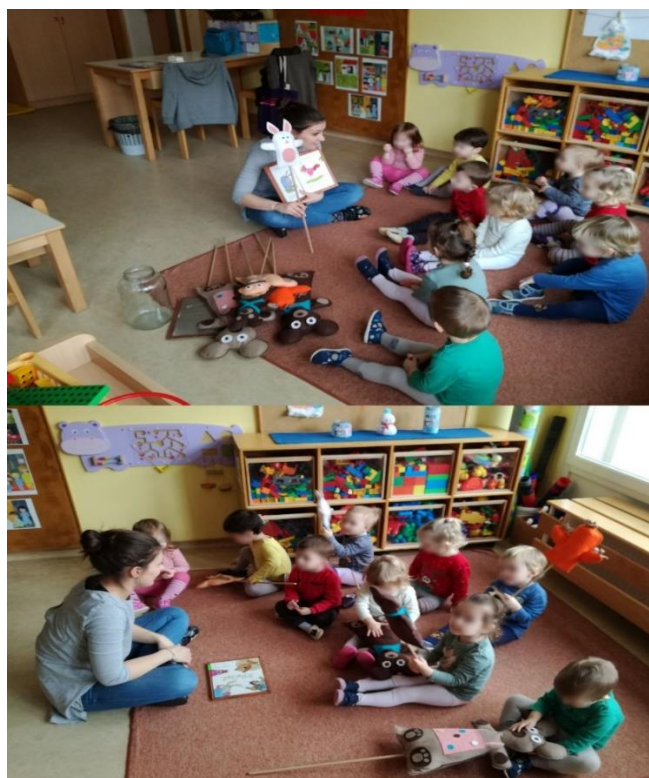
Slika 13: Pripoved pravljice.

pravljice smo otrokom zapeli pesmico o tisti živali, ki je nastopala, ob tem nas je vzgojiteljica spremljala s kitaro. Nato smo se z otroki pogovorili o živalih, ki nastopajo v pravljici. Otroke smo spodbujali z vprašanji, da so nam na lutkah in realnih fotografijah živali pokazali, kje imajo živali oči, nos, brke, šape, perje, kljun ... Ob tem smo se z otroki pogovarjali tudi o barvah lutk in živali.