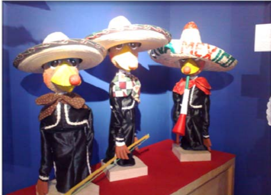
ÁREA DE TÍTERES PLANOS