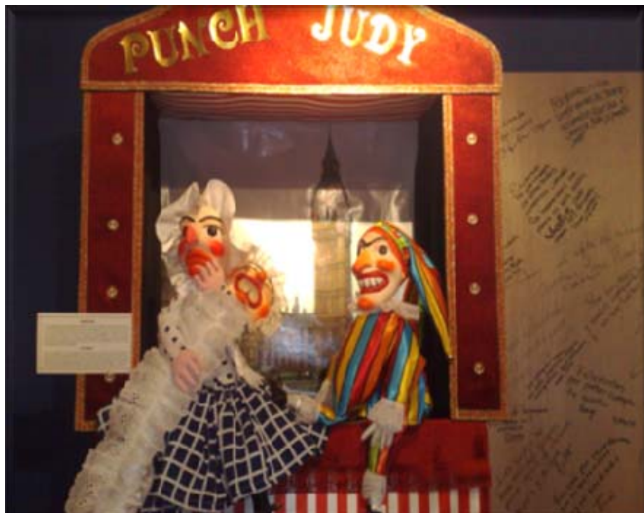
ÁREA DE MUPETS