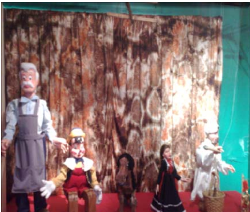
ÁREA DE TÍTERES IMPORTADOS