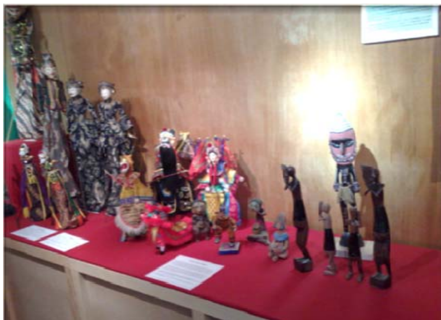
ÁREA DE TÍTERES IMPORTADOS