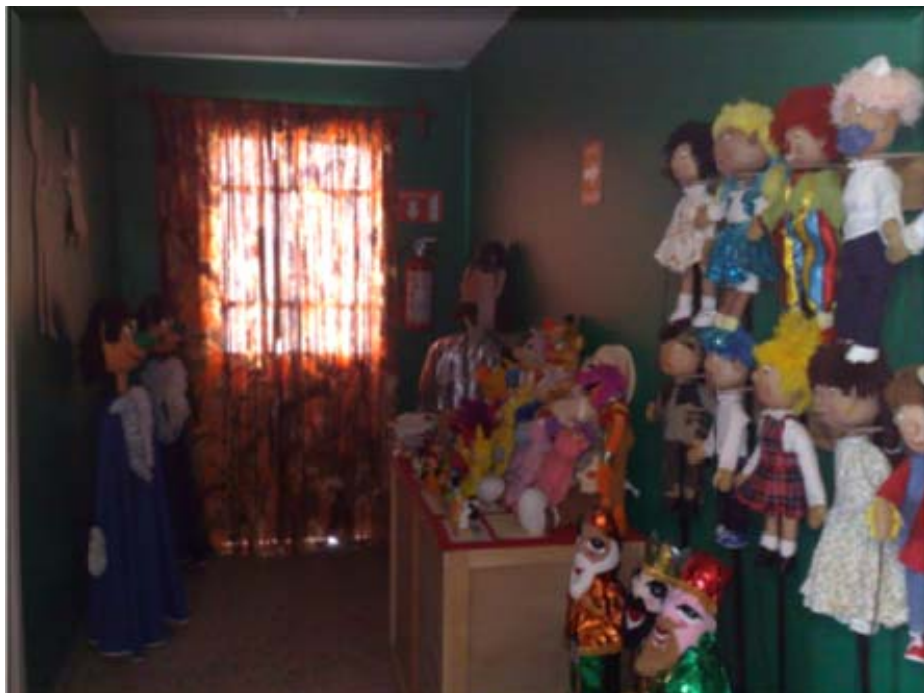
ÁREA DE DIVERSOS TÍTERES