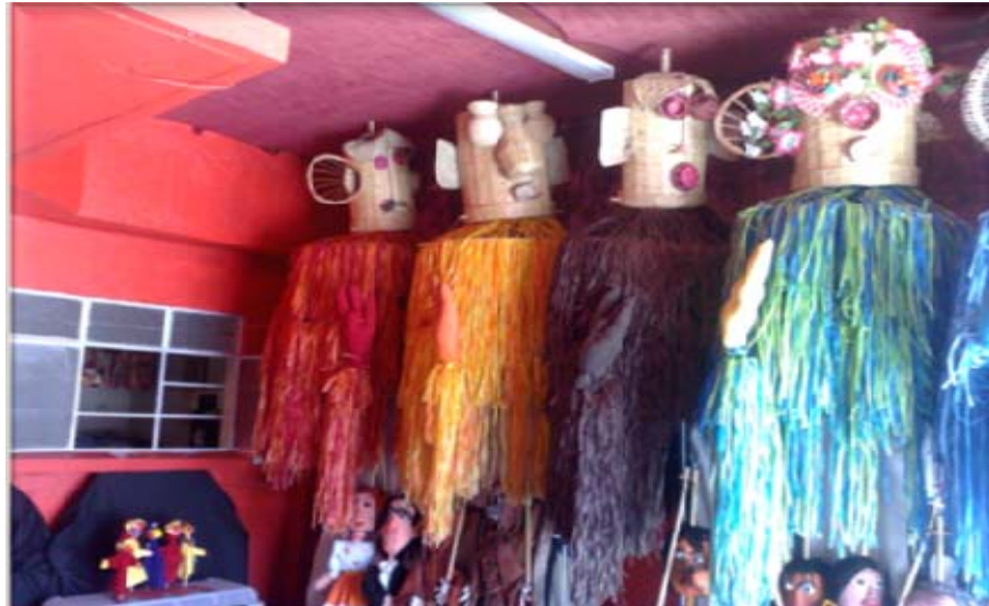
ÁREA DE MOJIGANGAS