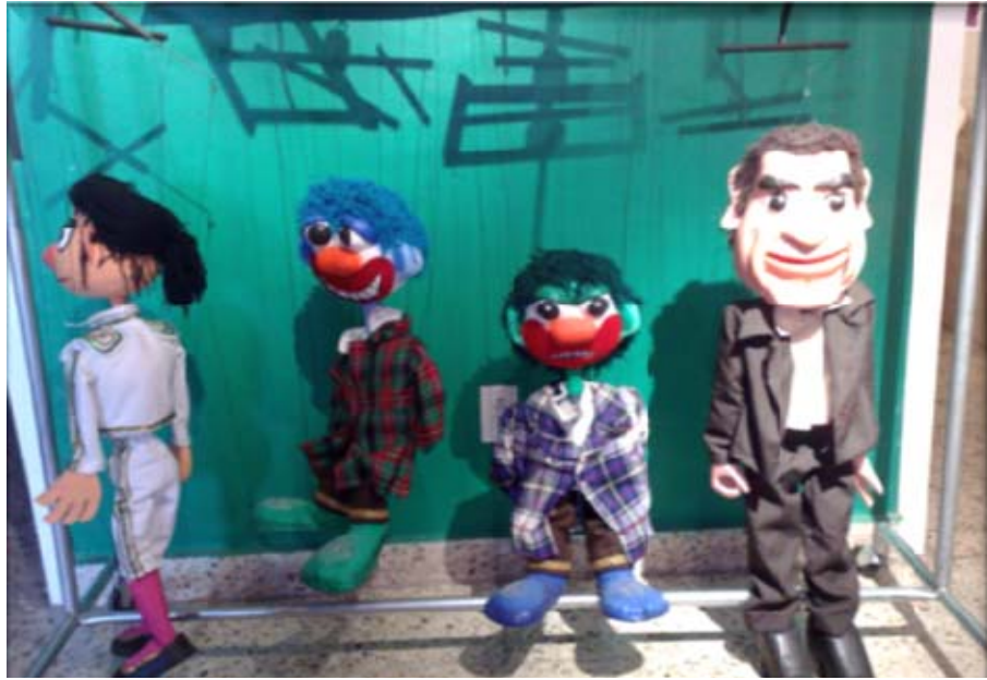
ÁREA DE MARIONETAS