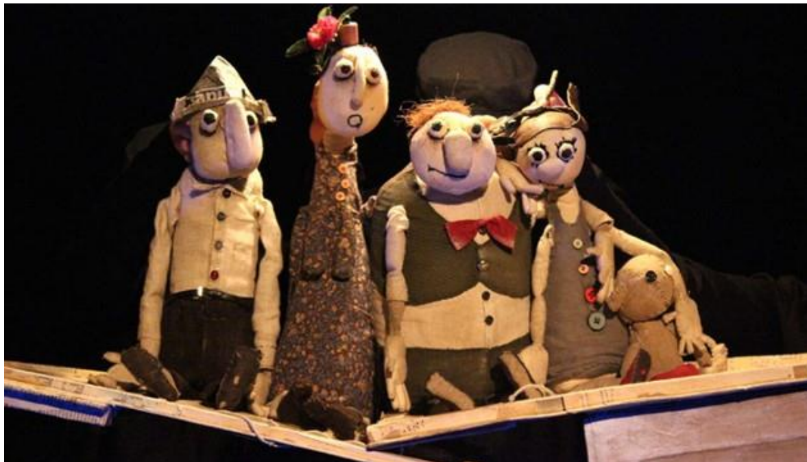
Slika 3. Lutkarska predstava

U Jugoslaviji lutkarsko kazalište gotovo da i nije imalo tradicije, tek nakon Drugoga svjetskog rata počinju pokušaji ozbiljnijih umjetničkih pretenzija. U našim je krajevima prva predstava održana u Ljubljani 1913. godine, a priredio ju je slikar Josip Klemenčić.