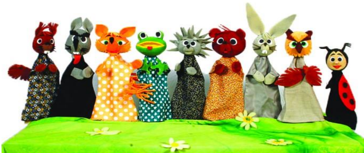
Slika 1. „Scenske lutke“

Za pisanje završnog rada, uzela sam temu „Lutka iz dječjeg kutka“ iz kolegija Lutkarstvo i scenska kultura. Na odabir ove teme potaknulo me više čimbenika. Prvi čimbenik koji me potaknuo na odabir ove teme je sama lutka, zato što je lutka nešto što nas najviše vuče nazad u djetinjstvo i u dane kad smo sanjali da smo likovi iz priča. Lutka je po mom mišljenju najljepša igračka u djetinjstvu svakog čovjeka. Drugi čimbenik zbog kojega sam izabrala upravo tu temu za pisanje je taj što smo na drugoj godini studija, iz istog kolegija imali zadatak napraviti lutkarsku predstavu od početka do kraja. To je bio period koji je mojim kolegicama i meni pomogao da se opustimo, da opet uključimo maštu i da se vratimo u djetinjstvo. Lutkarstvo je područje kreativnog izričaja djeteta i kroz tu umjetnost djeca se sama izražavaju i tako stvaraju. Zanimljivo ih je pratiti kroz cijeli taj pristup lutki i scenskoj umjetnosti. Lutkarstvo može pomoći djeci predškolske dobi u prepoznavanju vlastitih emocija, može im pomoći u izražavanju emocionalnih stanja u odnosu na druge, učenju ekspresivnih tehnika koje omogućuju izražavanje emocionalnih stanja kao što su ljutnja, strah i tuga, kroz likovne tehnike, pjesmu i ples, igre uloga te razvijanjem vlastite kreativnosti.