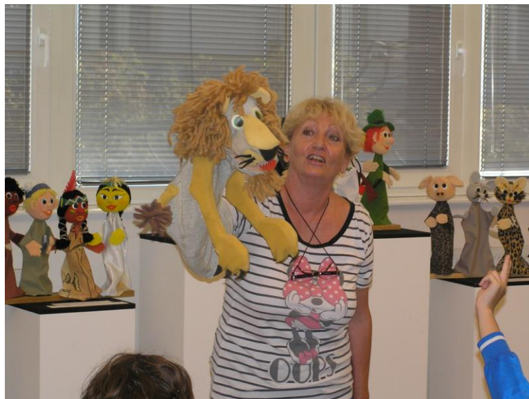
Slika 11. „Igra odgojitelja s lutkom

Odgojitelji bi kao prvo trebali pokazati poseban interes prema lutkarstvu i prema scenskoj lutki. Moraju biti spremni svoja znanja o razvoju djece i metodici rada s djecom predškolskog uzrasta integrirati sa znanjima iz umjetničkih područja te ih primijeniti u planiranju i provođenju programa u dječjem vrtiću. Također svaki odgojitelj mora biti spreman na obrazovanje i usavršavanje tokom cijelog života, no kako se misli na stručno usavršavanje tako se misli i na učenje od djece koja nam često znaju otvoriti oči, uputiti nas i često ostaviti bez daha svojim originalnim pitanjima. Odgojitelj bi mogao pristupiti djetetu kroz igru scenskom lutkom, on mora također biti zaigran i biti dijete u duši. U dječjoj mašti svaki predmet može oživjeti. Bilo kakav predmet ili igračka preuzima ulogu svijeta mašte, a dijete diktira pravila igre. Lutka može biti povjerljiv posrednik između djeteta i njegove okoline. Poznato je kako je jedan od najvažnijih koraka u djetetovom napredovanju otkrivanje načina komunikacije. Najbliži način je kroz osjećaje, međutim ponekad oni znaju za dijete biti stresni i opasni. Kako bi se takve stresne situacije izbjegle često se zbog bolje dvosmjerne komunikacije između djeteta i njegovog sugovornika uvodi lutka (Kroflin, Majaron, 2004).