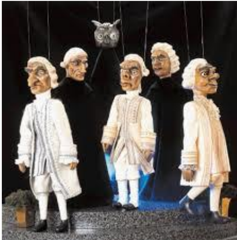
Slika 10. „ Marioneta“

Marioneta s više konaca - Ova vrsta lutke zadržala je omjere čovjeka. Sastoji se od glave, trupa, ruku i nogu te ima pokretljive zglobove. Ove marionete iziskuju veliku vještinu animatora (Vukonić-Žunić, Delaš, 2006.).