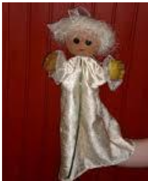
Slika 4. Ginjol lutka

Ginjol je ručna lutka i sam naziv te lutke nam otkriva da se navlači na ruku poput rukavice. Razlikujemo dvije vrste ručnih lutaka, a to su ginjol lutka i lutka zijevalica. Razlika između te dvije lutke je ta, što je ginjol tip lutke koji se navlači na ruku poput rukavice i najčešće kažiprstom pomičemo lutki glavu, a malim prstom i palcem pokrećemo lutkine ruke. Lutka zijevalica se također navlači na ruku, no razlika je u tome što je za nju karakteristično to da otvara i zatvara usta pomoću animatorove ruke.