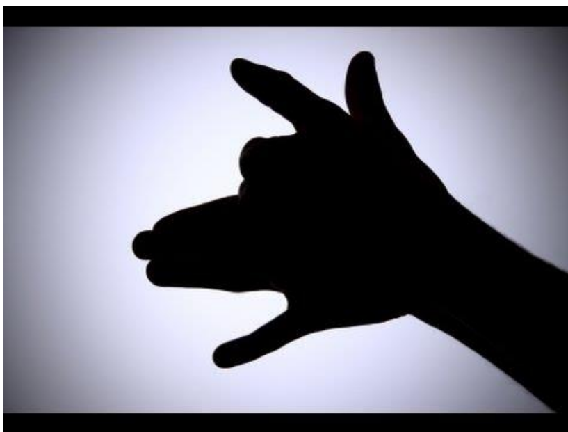
Slika 4. : Gluma rukama - Pas

Pojam sjene djetetu je vrlo zanimljiv jer je ono po prirodi istraživačko biće koje stalno istražuje svoju okolinu. Sjena koja je često i pokretna djetetu ponekad djeluje vrlo tajanstveno. Uz malo mašte i spretnosti pomoću ruku možemo „glumiti” različite likove