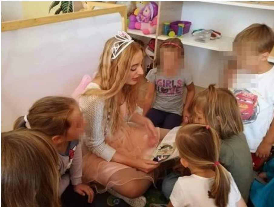
Slika 14: Čitanje Ježeve kućice