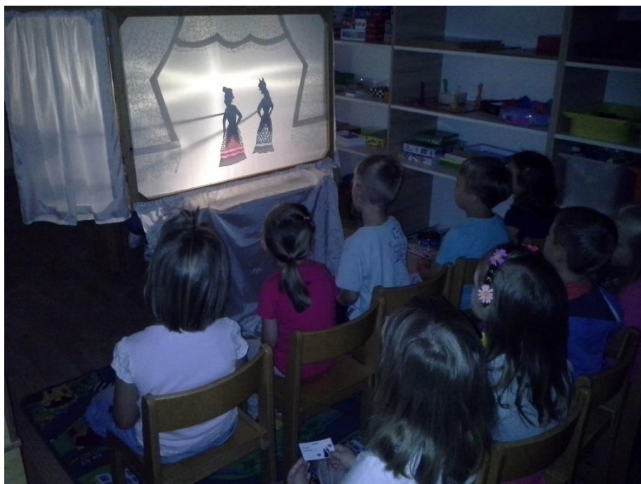
Slika 9: Pepeljuga