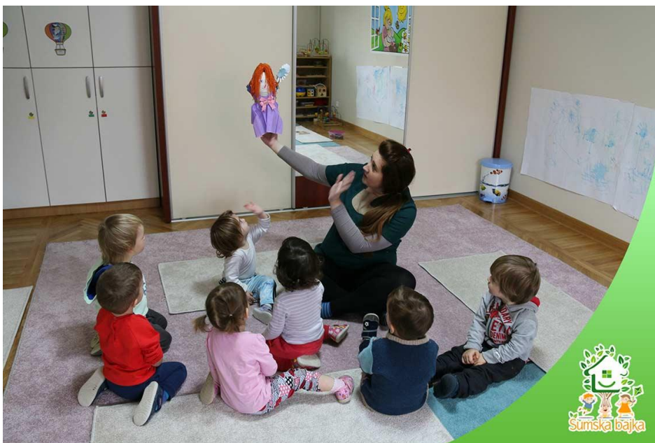
Slika 1: Odgojiteljica pomoću lutke priča priču

Svako dijete odabere najdražeg lika iz neke bajke i zajedno sa svojim roditeljima i odgojiteljicom izrađuje lutku te ih animiraju. U ovakvim radionicama jača se suradnja između odgojitelja i roditelja, te se djeca i roditelji još više povezuju.