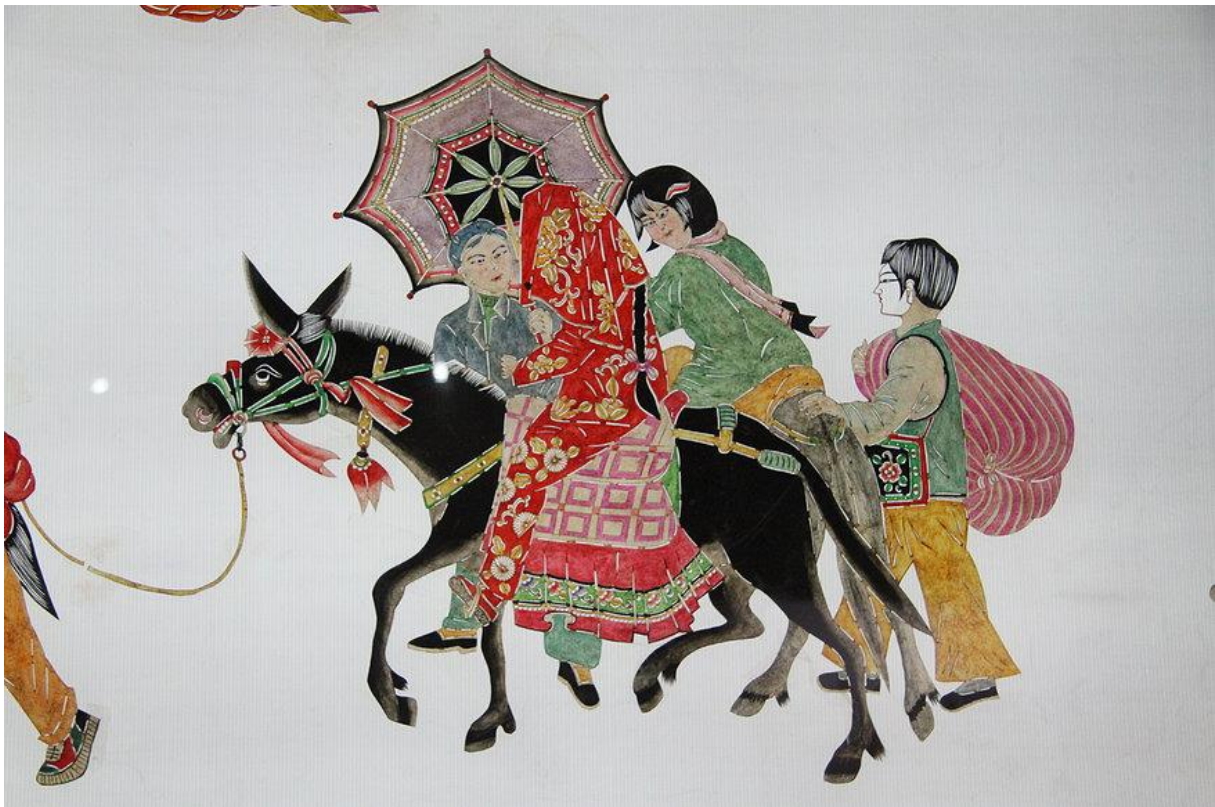
Slika 6: Kineske lutke sjene u boji

Postoji mnogo razloga zašto odabrati baš ovakav način izvođenja neke predstave, a jedan od njih je što se lutke mogu vrlo jednostavno napraviti, pošto su plošne, nije potrebno šivanje, može se koristiti manje materijala i ako koristimo folije u boji lutke će dobiti dodatni efekt. Igra svjetlosti, glazbom, bojama i pokretima također je vrlo zanimljiva djetetu, a pruža i mnoge mogućnosti prilikom stvaranja predstave.