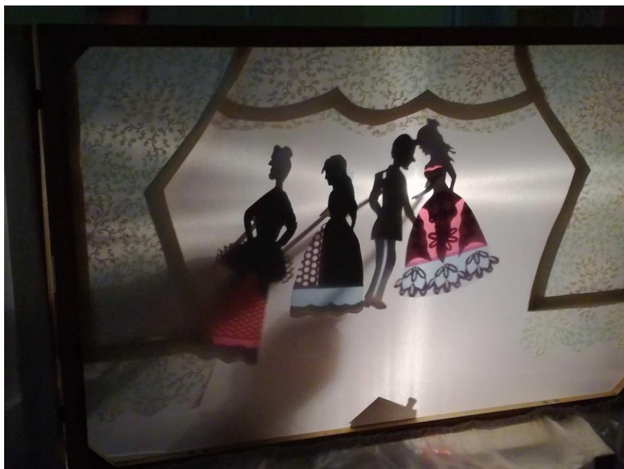
Slika 13: Igra sjenom i svjetlosti