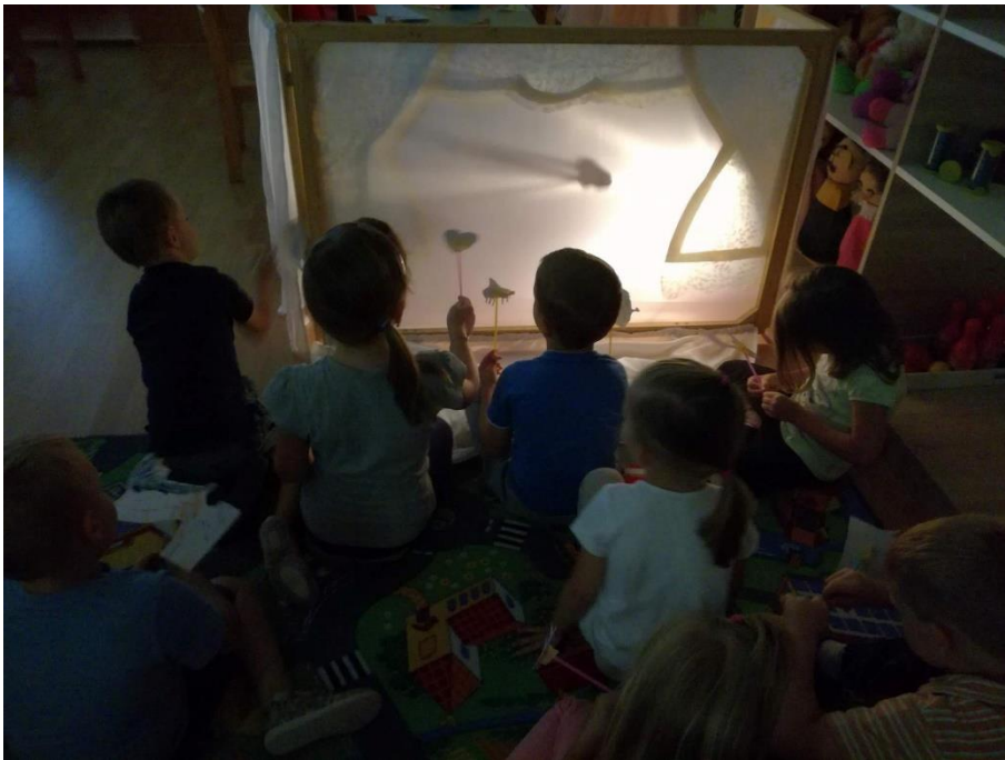
Slika 16: Igra vlastitom sjenom