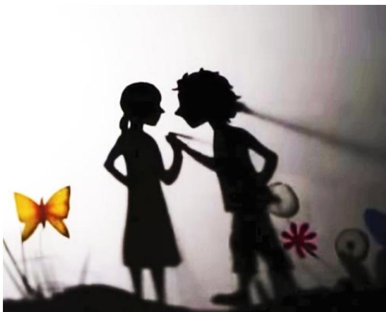
Slika 5: Prizor kazališta sjena

Osim što u kazalištu sjena možemo koristiti ruke, za glumu nam najčešće služe plošne lutke na štapićima. Lutke mogu imati pokretne dijelove, mogu biti napravljene od folija u boji, imati iscrtane detalje itd., sve navedeno pridonosi da lutke budu uočljivije i time ostaju duže u sjećanju gledatelja. Kazalište sjena nam omogućuje i igru sa svjetlom. Ako su lutke bliže platnu one će biti manje i vidjeti će se više detalja na njima, dok ako ih odmaknemo od platna biti će veće. Prilikom izrade važno je zapamtiti kako se radi poluprofil lutke jer se tako mogu najbolje istaknuti detalji lutke.