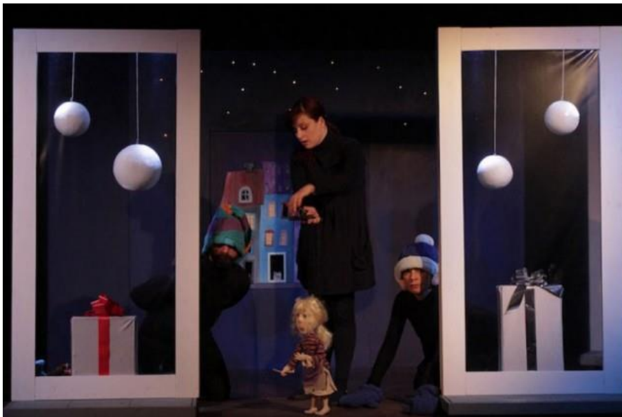
Slika 2 : Scena lutkarskog kazališta

Scena i lutka su međusobno povezane, one se upotpunjuju i ako je potrebno neki dijelovi scene se mogu pomicati. Iako u vrtiću nemamo uvjete kao u lutkarskom kazalištu, uvijek možemo iskoristiti raspoloživa sredstva kao što su stolovi, stolice i igračke. Prije nego što počnemo izrađivati scenografiju, možemo zamoliti djecu da nacrtaju prostor u kojem zamišljaju da će lutke razgovarati i živjeti, također prije nego što izradimo lutke mogu i njih nacrtati. Kako bi se bi mogli bolje predočiti izgled scene možemo napraviti maketu unutar kartonske kutije.