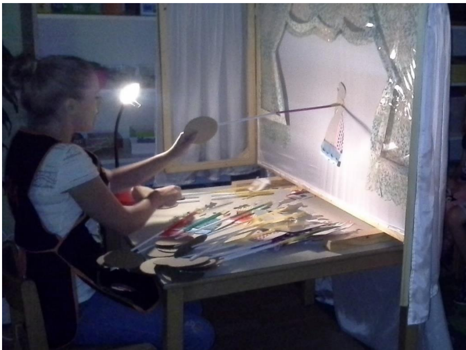
Slika 11: Djeca glume lutkama iz odgledane predstave