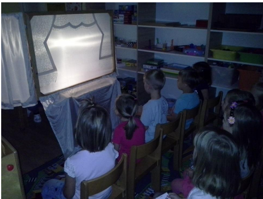
Slika 7: U iščekivanju predstave