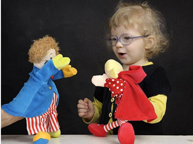
Slika 3 : Djevojčica pokazuje sreću igrajući se lutkom

Od svih lutaka za emocionalni razvoj posebno je važna lutka humaneta, tjelesna lutka koja prikazuje djetetov „alter ego”, visi oko djetetovog vrata, a ruke i noge su joj pričvršćene na djetetove. Dijete ima osjećaj kao da je skriveno te tako lakše izražava svoje osjećaje.