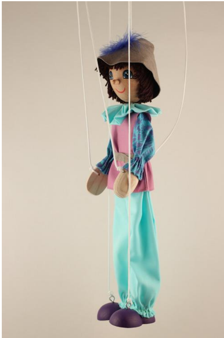
Slika 1. Lutka marioneta

Nedostatak marioneta bi bio taj što im je izrada vrlo zahtjevna i komplicirana, a animacija vrlo teška pa izvođač ne može izvesti više od jednog lika istovremeno.