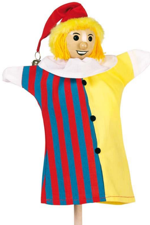
Slika 3. Štapna lutka (preuzeto 10.08.2020. sa http://www.orsomago.it/prodotti/gollnest-kiesel/marionetta-jolly-con-bastone/ )

Ako pomoću lutke javanke želimo predstaviti neku životinju potreban je individualni mehanizam, pošto su te lutke kompliciranije. No, zajedničko im je da postoji glavni štap nosač koji nosi cijelu lutku.