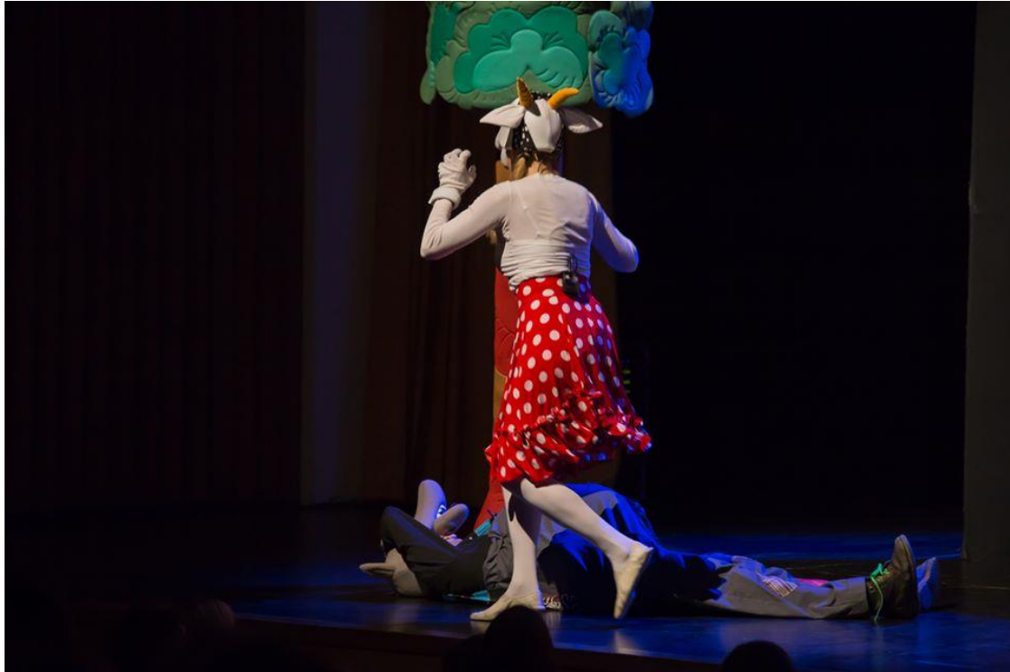
Slika 11. Majka Koza pronalazi zaspalog Vuka

Ova poznata priča aktualna je tema djece na Internetu, te poučava kako je oprez na društvenim mrežama danas jako bitan. S druge strane priča kao i prije ukazuje na to da su ponekad i ona najmanja djeca mudra i snalažljiva (najmanji Kozlić uspjeva nadmudriti Vuka, te se uspjeva spasiti). Mudri kozlić se dobro skrio te time pokazao kako veličina i snaga nisu uvijek bitne i važne u životu.