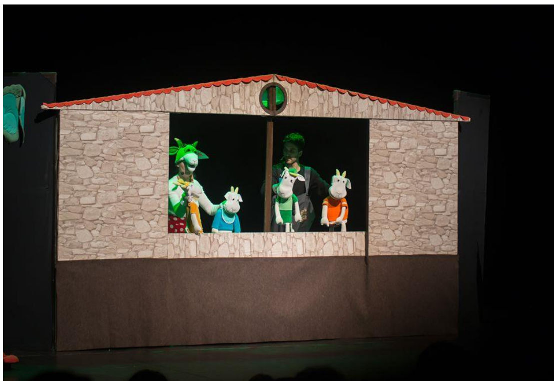
Slika 8. Majka Koza se oprašta sa Kozličima (Preuzeto 10.08.2020. sa