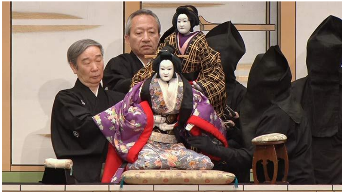
Slika 6. Bunraku lutka (preuzeto 10.08.2020. sa https://traditionalkyoto.com/culture/bunraku/ )

Za pokretanje ove lutke potrebna su dva ili tri lutkara. Glavni lutkar lijevom rukom kontrolira pokrete i drži glavu i trup kroz prorez na leđima lutke, a desnom rukom kontrolira desnu ruku lutke. Drugi lutkar pomiče lijevu ruku i šaku lutke, a treći njene noge.