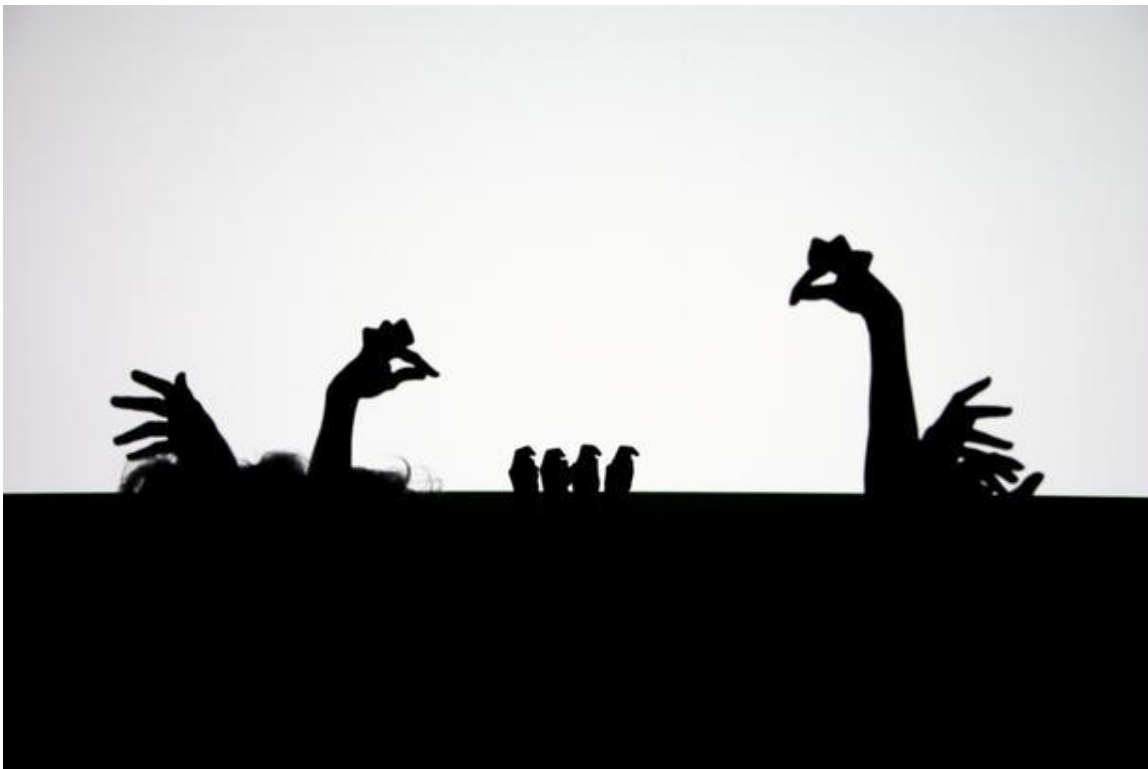
Slika 5. Lutke sjene (preuzeto 10.08.2020. sa https://www.vecernji.hr/kultura/zkl-i-liberdance-dovode-dvije-predstave-kazalista-sjena-107837 )

Kazalište sjena najviše se razvilo na Dalekom istoku, a ponajviše u Kini. Lutke sjena najčešće su se pravile od kože, pergamenta, papira, a u novije vrijeme i od plastike. Ove su lutke najčešće dvodimenzionalne i djeluju poput pokretnih sličica. Lutka se pokreće između platna i izvora svjetlosti.