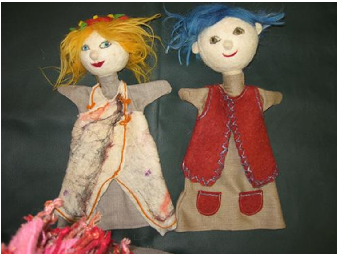
Slika 2. Ginjol lutke