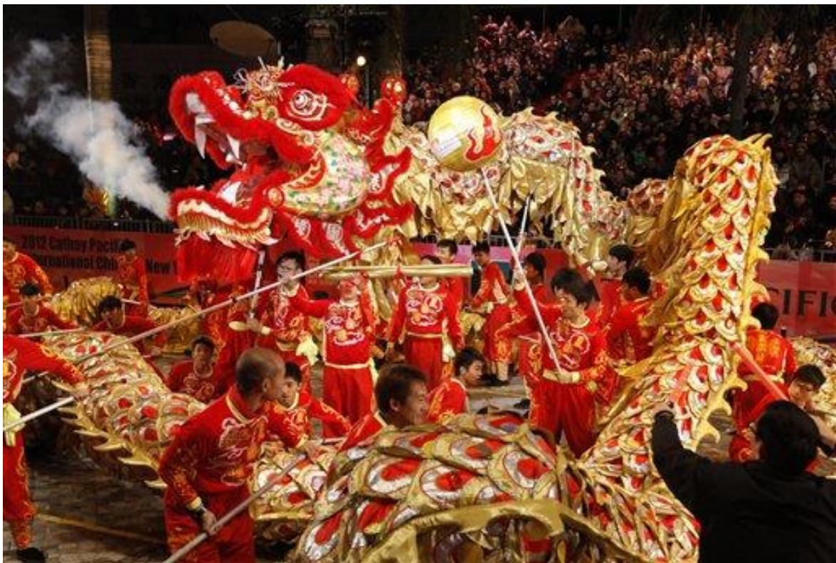
Slika 4. Gigantska lutka (preuzeto 10.08.2020. sa https://www.thedailybeast.com/chinese-new-year-2012-year-of-the-dragon-celebrations-photos )

Velike ili gigantske lutke – ove lutke su jedinstvene po svojoj veličini koja ih izdvaja iz prostornog okruženja. Ovisno o veličini može ih pokretati jedan ili više lutkara. Za gledatelje ove lutke su zbog same svoje veličine i načina kretanja dovoljna atrakcija. Najprikladnije su za ulične performanse, karnevalske povorke i slično.