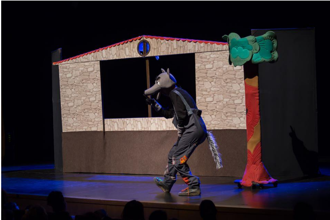
Slika 9. Dolazak Vuka (Preuzeto 10.08.2020. sa

je pokucao na vrata pretvarajući se da im je majka i povikao da otvore vrata i da je svakome nešto donio.