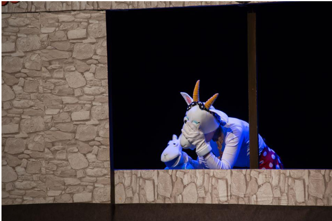
Slika 10. Najmlađi Kozlić govori majci što se dogodilo

vrata otvorena, cijelu kuću razbacanu i nigdje Kozlića. Uspjela je pronaći najmlađeg kozlića koji joj je ispričao sve što se desilo.