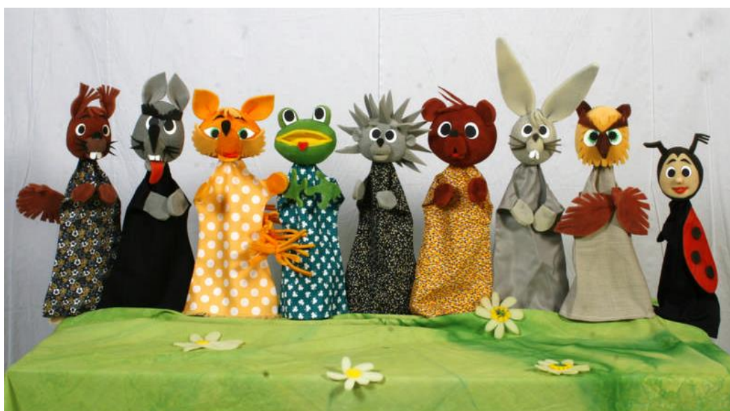
4. slika: Ginjol lutke 5

karikirani, no to nije zakonitost koju treba slijepo slijediti. Osoba koja lutku pokreće određuje kakva će ona biti i dodjeljuje joj karakter. Važan je položaj ruke, ritam hoda i intonacija glasa. Osnova kostima je rukavica s tri prsta. Kostim lutke treba biti jednostavan tj. neupadljiv kako bi do izražaja došle ruke i lice. Duljina kostima koji je navučen na ruku glumca lutkara trebala bi sezati gotovo do lakta. Ako želimo da lutka ima trbuh može se napraviti kostim čiji je prednji dio dvostruk, poput džepa, pa se može ispuniti vatom. Ista stvar je i za grbu na leđima. Kostim se izrađuje od tkanine koja je mekana i podatna kako bi glumac lutkar nesmetano mogao pokretati lutku (Županić BeniĆ, 2009).