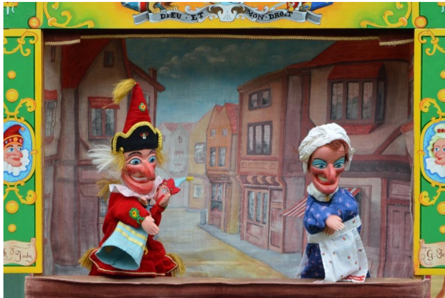
3. slika: Punch and Judy 4

Autor Henryk Jurkowski u svome djelu Povijest europskog lutkarstva (2005) navodi kako se na početku 19. st. pojavio novi lik, izdanak komedije ručne lutke. Bio je to „Guignol“ koji je danas kod nas sinonim za ručnu lutku.