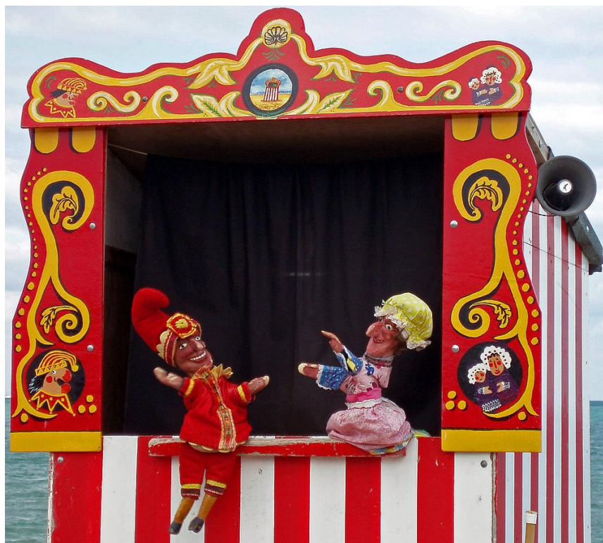
5. slika: Pozornica za ginjole 6

Lutkarska pozornica ( booth ) za ručne lutke je visoka i ima prozor koji je smješten iznad lutkareve glave. Pozornica za ginjole se nalazi na vrhu prednjeg paravana, a lutke se pojavljuju na scenu odozdo te jednako tako i odlaze. Okvir scene je najčešće ukrašen i ima zastor koji se pomiče na početku predstave i zatvara na kraju. Obično se s donje strane okvira nalazila daska na koju bi lutka mogla ostaviti neki rekvizit. S unutarnje strane paravana, postavljene su kukice kako bi lutkar mogao objesiti lutke koje mu nisu u tom trenutku potrebne na sceni. Unutar ove „lutkarske kutije“ nema puno prostora, stoga se unutra obično nalazio jedan lutkar koji je animirao različite likove (Županić Benić, 2009).