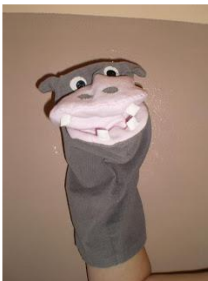
Slika 3. Lutka zijevalica

Zijevalica (slika 3) je također ručna lutka, samo što animatorova ruka iznutra otvara i zatvara lutkina usta. (Tomljanović, 2015)