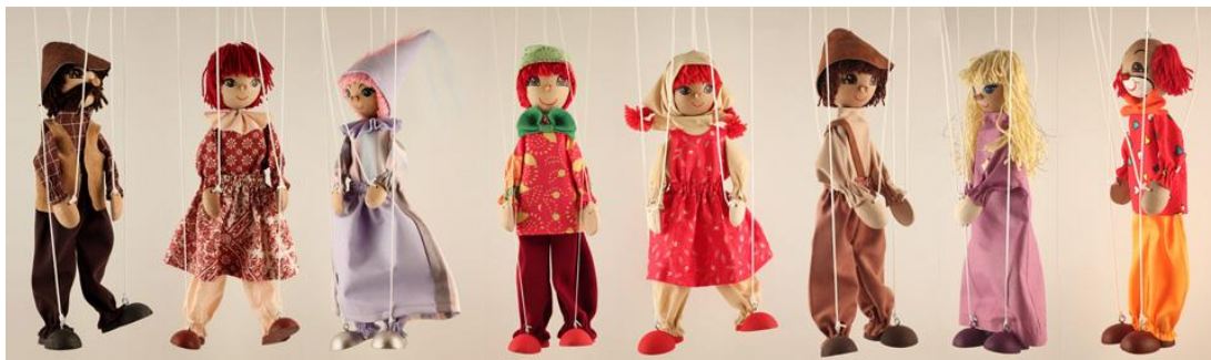
Slika 1. Lutke marionete