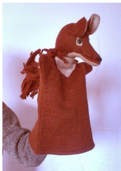
Slika 2. Ginjol lutka