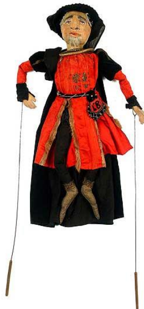
Slika 4. Lutka javajka