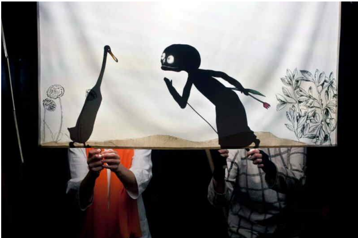
Slika 5. Lutke sjene