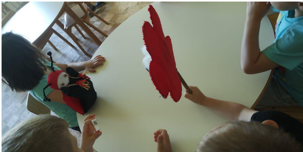
Slika 6. Djeca animiraju lutke