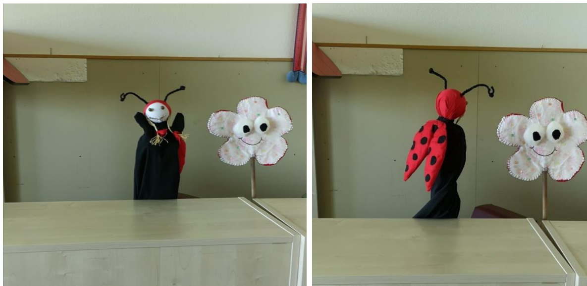
Slika 4. i 5. Bubamara Klara i cvjetić Kruno

BUBAMARA KLARA: Prvo te želim zagrliti jako, a onda možemo kući polako ( bubamara Klara i cvjetić Kruno se zagrlje i odlaze kući uz prepričavanje svih pustolovina koje su im se našle na putu. )