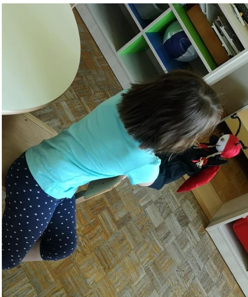
Slika 7. Razgovor djevojčice i lutke