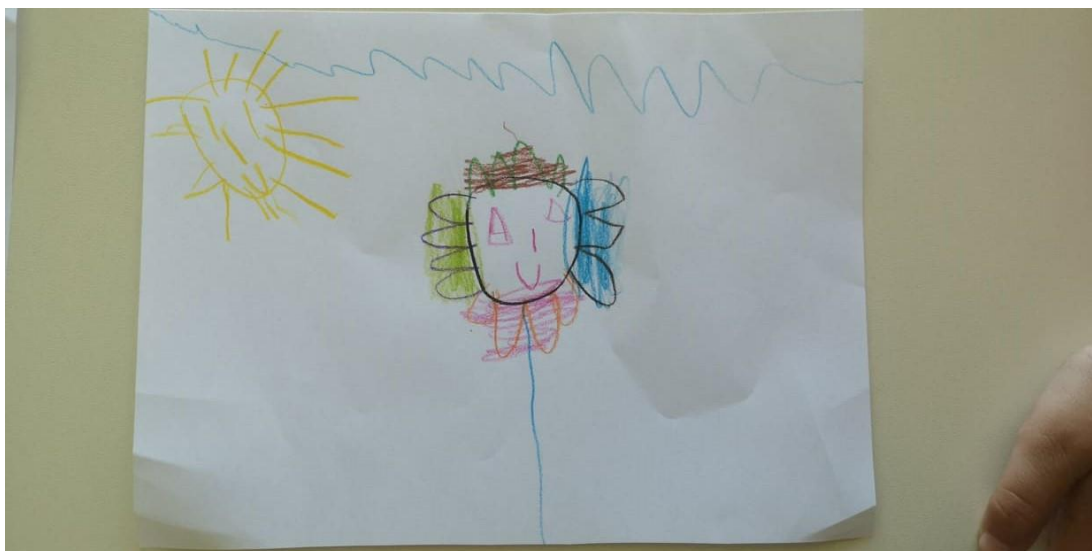
Slika 8. Crtež cvjetića Krune