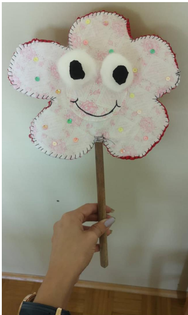
Slika 3. Štapna lutka cvijet

Prilikom izrade štapne lutke koristila sam: crnu, crvenu i roza tkaninu, vatu, škare, ljepilo, konac, flomaster, kuhaču i perlice.