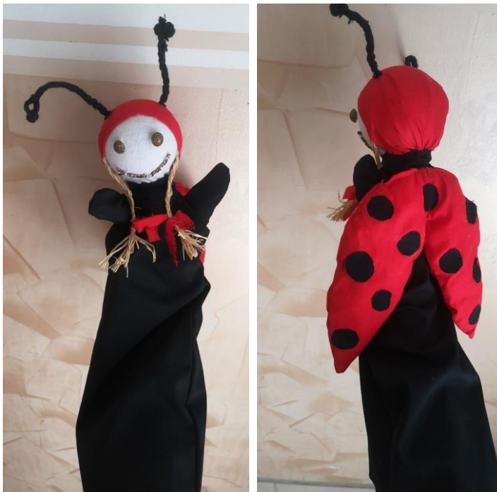
Slika 1. i 2. Ginjol lutka, bubamara Klara

Prilikom izrade ginjol lutke bila mi je potrebna: tkanina u crnoj i crvenoj boji, zlatni gumbi, zlatna vrpca za usta, žica, karton, liko, igla i konac.