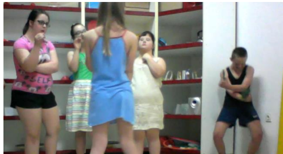
Slika 22. Majmun se svađa s putnicima (lijevo), a dijete koje glumi džunglu pleše (desno)

ruku te transformirali glas kao što je to trebalo. Pripovijedala sam priču, a djeca su glumila. Jedno dijete danas nažalost nije moglo doći pa su njegove uloge preuzela druga djeca. Početne dijelove su, kao i dosad, vrlo dobro izveli. Svako dijete znalo je što treba raditi, a pokreti su im bili smireni i smisleniji. Kada su putnici pogledali u kartu jedno dijete putnik je uzviknuo „karta“ što me iznenadilo jer je to dijete inače povučeno i ne voli se isticati. Zatim su letjeli, opet jako dobro kao inače, te sletjeli u džunglu. Dijete za koje sam rekla da prvih nekoliko susreta nije htjelo sudjelovati danas je bilo odlično. Sudjelovalo je i glumilo sve što treba. Premda mu je mala pomoć i dalje trebala oko glume tigra, no o tome ću govoriti kasnije u tekstu. Sada je to dijete glumilo džunglu i mahalo kartonskim drvećem u zraku. Uskoro se pojavila zmija od koje su putnici pobjegli pa se pojavio majmun s bananama. Dijete je došlo ispred putnika i bacalo kartonske banane. U tom trenutku dijete koje je glumilo džunglu se smijalo i radosno plesalo s drvećem u ruci, a majmun i putnici su se svađali (slika 22).