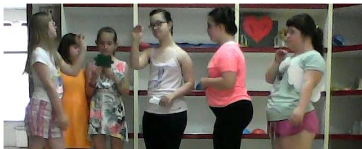
Slika 21. Majmun (lijevo) poziva putnike na ples