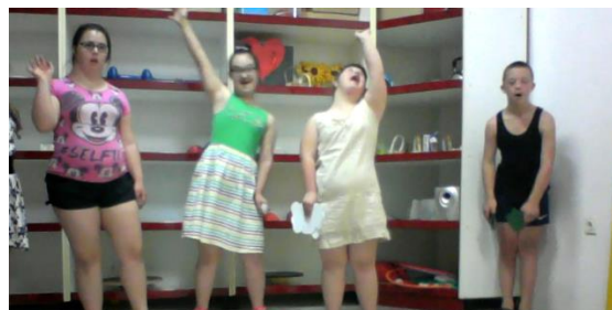
Slika 23. Pjevanje i plesanje

Nastavila sam dalje priču htijući reći kako je majmun putnike pozvao na ples, no jedno dijete me prekinulo i dovršilo moju rečenicu. Tada je jedno dijete putnik uzviknulo „hoćemo“ i radosno su krenuli u pravcu plesa. Pitala sam ih koja pjesma se čula na plesu, a oni su odmah počeli pjevati i plesati (slika 23).