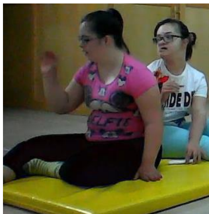
Slika 15. Dijete fokusirano na ruku

Zamijetila sam da jedno od djece putnika jako dobro izvodi pokrete, govori što treba bez moje opomene da to čini, ali bez transformacije glasa te je manje fokusirano na ruku, a više na mene dok je drugo dijete putnik gotovo cijelo vrijeme fokusirano na ruku i ono što s njom radi (slika 15), prati sadržaj no neće samoinicijativno govoriti kada treba, iako zna što treba reći i zna kada to treba reći.