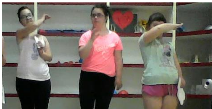
Slika 20. Putnici gledaju lijevo-desno gledajući jesu li pobjegli

Hodanje putnika također je bilo već dobro uvježbano. Kod pojave zmije došlo je do jedne nove jako dobre izvedbe. Jedno dijete je to odlično prikazalo pokrećući ruku u svakom zglobu u svim smjerovima u kojima je moglo. Isto to dijete je još neko vrijeme nastavilo glumiti zmiju dok sam govorila da su se putnici uplašili i krenuti bježati od zmije. Nakon što su putnici odglumili kako su se umorili od trčanja pala mi je na um ideja da bi se mogli osvrnuti lijevo – desno te iza sebe kako bi vidjeli jesu li pobjegli od zmije (slika 20).