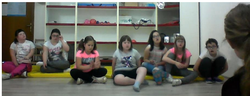
Slika 1. Uvodni razgovor o dijelovima tijela

Kao uvod u istraživanje o lutkarskoj animaciji tijela odabrala sam razgovor o pojedinim dijelovima tijela kako bi na samom početku obratila pozornost upravo na svaki dio kojim ćemo se zasebno baviti u lutkarskoj animaciji. Razgovor o pojedinim dijelovima tijela te reakcijama je vidljiv na slici 1.