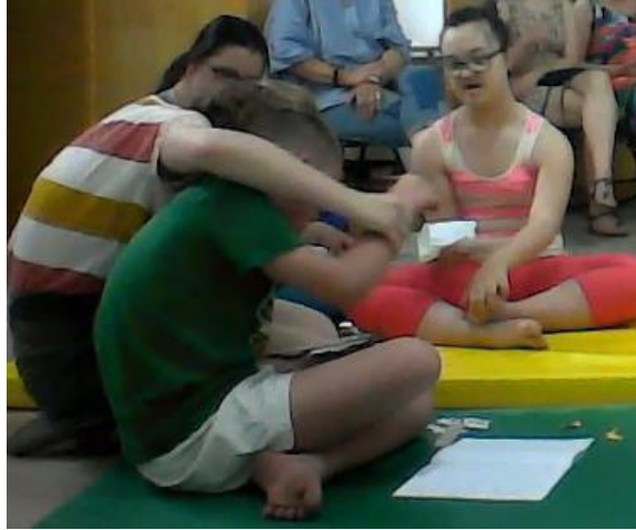
Slika 11. Pomoć djetetu koje glumi tigra

Danas sam osjetila da je dijete više sudjelovalo gurajući ruku prema naprijed, ali i dalje je bilo nesigurno da to učini samo. Putnici su se uplašili i pobjegli te su nakon pogleda u kartu trebali odgurati kamen s vrata pećine. Učinili su to jako dobro kao i prošli put (slika 12).