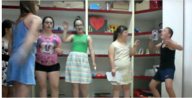
Slika 24. Dijete tigar (desno) želi baciti malu kutiju na putnike

izvedba i ona prije se razlikuju po tome što je dijete ovog puta bilo puno bolje i sigurnije. Ono je danas pomicalo moju ruku te je puno glasnije oponašao riku tigra negoli prošli put. Morala sam ga odmah pohvaliti. Toliko je bio sretan da je nastavio rikati, uzeo malu kutijicu i htio baciti na putnike i dalje glumeći, sada već zločestog, tigra (slika 24).