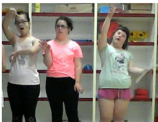
Slika 18. Putnici se razbuđuju i zijevaju

Današnji zadatak bio je izvesti priču stojeći te poraditi na finesama jer se istraživanje privodilo kraju. Pokušala sam biti samo u ulozi pripovjedača s vrlo malim ubacivanjem i pomaganjem djeci. Započela sam pripovijedanje, a djeca su paralelno radila ono što sam pričala. U prvom dijelu priče gdje putnici spavaju, bude se i rastežu te gledaju u kartu i kreću na putovanje se vidi veliki pomak u odnosu na prijašnje izvedbe. Njihova gluma razbuđivanja vidi se na slici 18.