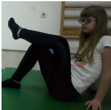
Slika 5. Radi lakše glume stopalom dijete stavlja nogu na koljeno

na izazov koji je pred njega stavljen. Novi zadatak je bio odglumiti starog djeda. Jedno dijete je tada radije glumilo staru bakicu. Izmisli je situaciju da je bakica isplela tajice te ih je pružalo meni. Upitala sam ga ima li nešto i za druge pa je jednom djetetu ponudilo čokoladu. Pitala sam to dijete može li nam pokazati kako jede i guta čokoladu. Dijete je inače plaho i nesigurno pa ga je trebalo više puta potaknuti i ohrabriti. No na koncu je „prožvakalo“ čokoladu i gutnulo ju na način da je malo poskočilo rukom u zrak. Izvedba je bila solidna. Samo što ga je trebalo opomenuti da gleda u ruku. Sljedeće što smo glumili su djeca glumila s užitkom - lopove koji se šuljaju. Odjednom je jedno dijete skočilo svojom rukom na moju i reklo da puca u mene te da će me smjestiti u zatvor. Svidjelo mi se što su djeca s vremena na vrijeme nudila svoja rješenja. Nakon ovoga odlučila sam se da krenemo vježbati animaciju stopala. Pokazala sam im kako da legnu na leđa i podboče se rukama te dignu jednu nogu u zrak. Za lakše izvođenje mogli su staviti jednu nogu na koljeno druge noge koja im je bila savinuta što se može vidjeti na slici 5.