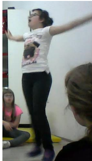
Slika 2. Dijete glumi let ptice