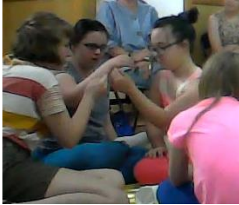
Slika 13. Podižemo putnika koji je pao

Dijete koje se pridružilo putnicima za koje sam već napomenula da nije baš bilo aktivno danas, takvo je ostalo do samog kraja. Tek se malo pridružilo kada je trebalo izvlačiti škrinju iz špilje. Drama izvlačenja škrinje produživala se na zahtjev djece. Čak su četiri puta pokušavali izvući škrinju te kad su ju konačno izvukli otvorili su zamišljen poklopac i svatko je rekao svoju lijepu riječ. Naklonili su se, zapljeskali jedni drugima te se zagrlili jer su bili jako uspješni ovog puta.