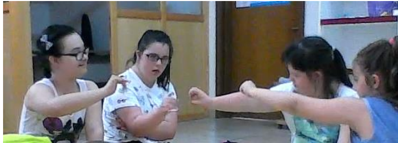
Slika 10. Svađa putnika s majmunom

na to. Dijete koje je bacalo banane je i danas bilo uspješno u tome. U tom trenutku sam pitala putnike što će sada napraviti pošto majmun baca banane na njih. Jedno dijete putnik je znalo da treba pokušati zamoliti majmuna da to ne radi i pritom uspješno transformiralo glas. Tad je nastao žamor (slika 10) jer majmunčić tvrdoglavo nije slušao, no na koncu su se pomirili i on ih je pozvao na bal lijepo kao i prošli put.