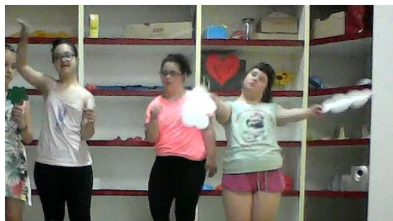
Slika 19. Putnici lete, a oblaci plešu

Hodanje putnika također je bilo već dobro uvježbano. Kod pojave zmije došlo je do jedne nove jako dobre izvedbe. Jedno dijete je to odlično prikazalo pokrećući ruku u svakom zglobu u svim smjerovima u kojima je moglo. Isto to dijete je još neko vrijeme nastavilo glumiti zmiju dok sam govorila da su se putnici uplašili i krenuti bježati od zmije. Nakon što su putnici odglumili kako su se umorili od trčanja pala mi je na um ideja da bi se mogli osvrnuti lijevo – desno te iza sebe kako bi vidjeli jesu li pobjegli od zmije (slika 20).