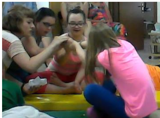
Slika 12. Djeca guraju kamen s ulaza pećine

Danas sam osjetila da je dijete više sudjelovalo gurajući ruku prema naprijed, ali i dalje je bilo nesigurno da to učini samo. Putnici su se uplašili i pobjegli te su nakon pogleda u kartu trebali odgurati kamen s vrata pećine. Učinili su to jako dobro kao i prošli put (slika 12).